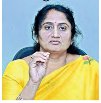
చేస్తున్నారు. ఎన్టీఆర్ భరోసా పెన్షన్ కింద 92,744 మంది నేతన్నలకు రూ.3వేల నుంచి రూ.4వేల వరకు పెన్షన్ మొత్తం పెంచారు. రాష్ట్రవ్యాప్తంగా విస్తృతంగా క్లస్టర్ల ఏర్పాటు చేస్తున్నారు. చేనేత రంగాభివృద్ధి కోసం ముడి సరుకులపై సబ్సిడీ, నెట్ ఫండ్ అండ్ డజిస్ట్రా, ఆధునిక డిజైన్లపై శిక్షణ అందిస్తున్నారు. పనిముట్ల కొనుగోలుకు 90శాతం వరకు సబ్సిడీతో అందజేస్తున్నారు.