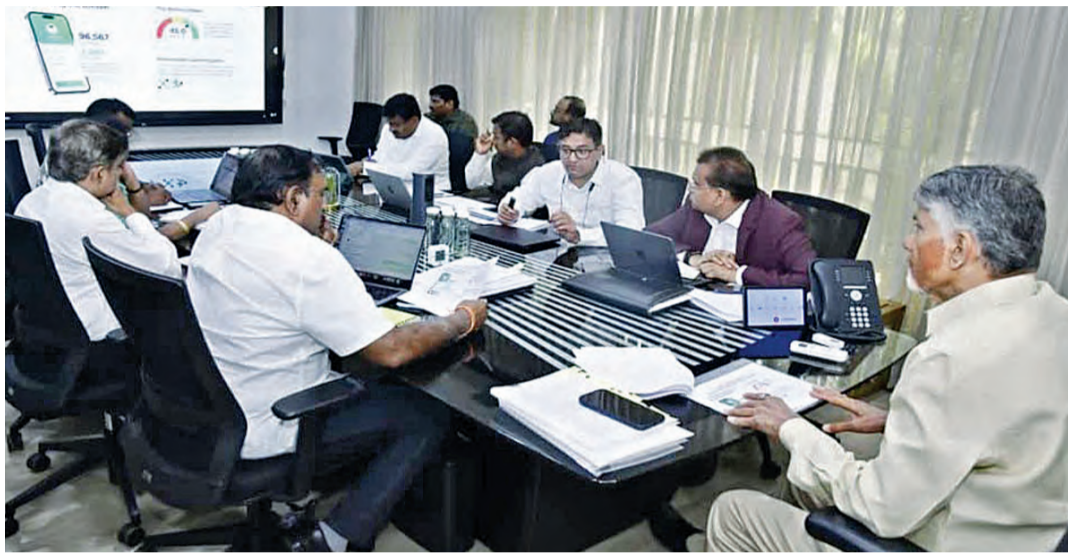
మంగళవారం సంజీవని ప్రాజెక్టు క్యాంపు కార్యాలయంలో సమీక్షిస్తున్న సిఎం చంద్రబాబు

జూలైలోగా అమలు చేయడానికి కార్యచరణ ఉచిత నగదు రహిత ఆరోగ్యబీమా కూడా అమలు ప్రతి నెల 4వ శనివారం స్వర్ణాంధ్ర గ్రామసభలు ప్రాజెక్టుపై సమీక్షలో సిఎం చంద్రబాబు