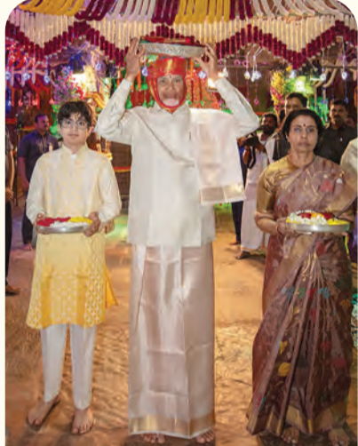
సీతారామ కల్యాణంకు పట్టు వస్త్రాలు తీసుకు వెళుతున్న సీఎం చంద్రబాబు నాయుడు