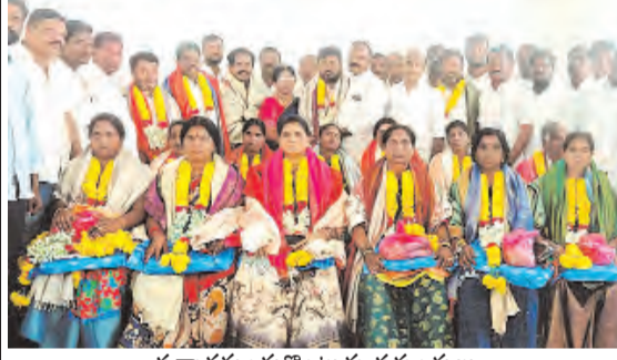
సన్మానముంటూ వైశాఖ సర్పంచులు