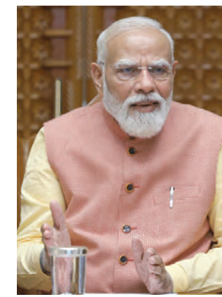
एलपीजी और पेट्रोल-डीजल उपलब्धता पर चर्चा की गई।

नई दिल्ली, 1 अप्रैल (एजेंसियाँ)। दिल्ली में प्रधानमंत्री आवास पर पीएम मोदी की अध्यक्षता में बुधवार शाम 7 बजे कैबिनेट कमेटी ऑन सिक्वोरिटी की बैठक हुई। इसमें पश्चिम एशिया में जारी संघर्ष के कारण भारत में मौजूद हालात की समीक्षा की गई।