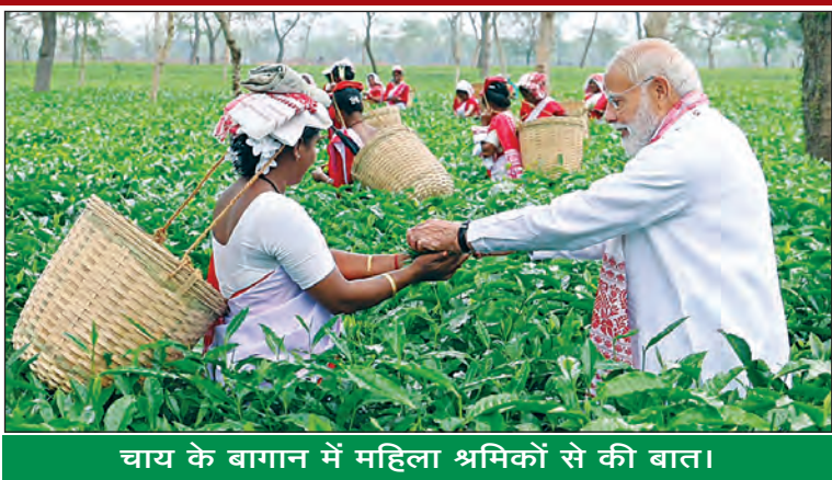
चाय के बागान में महिला श्रमिकों से की बात।