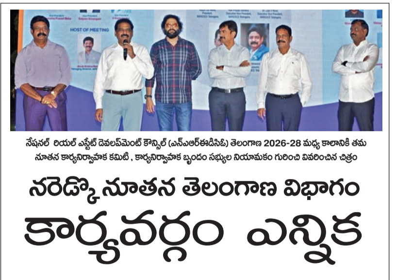
నేషన్ రియల్ ఎస్టేట్ డెవలప్ మెంట్ కౌన్సిల్ (ఎన్ఎల్డీసీ) తెలంగాణ 2026-28 మధ్య కాలానికి తమ నూతన కార్యనిర్వహక కమిటీ, కార్యనిర్వహక బృందం భర్తీల నియమాంక గురించి వివరించిన సత్తం