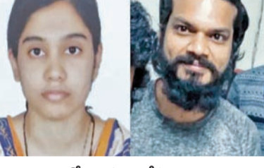
బెంగళూరులో ఆత్మహత్య చేసుకున్న తెలంగాణు చెందిన టేకీ దంపతులు

బెంగళూరు ఘటనలో ఎవ కారణంగా ఉద్వీగం పోవడంతో మానసికంగా క్షంగిపోయి సాఫ్ట్ లెట్ దంపతుల బలవ్యరణం భద్ర ఆత్మహత్యలో 18వ అంతస్తు నుంచి దూకి భార్య ఆత్మహత్య హైదరాబాద్ లో ఇద్దరి ఆంత్యక్రియలు