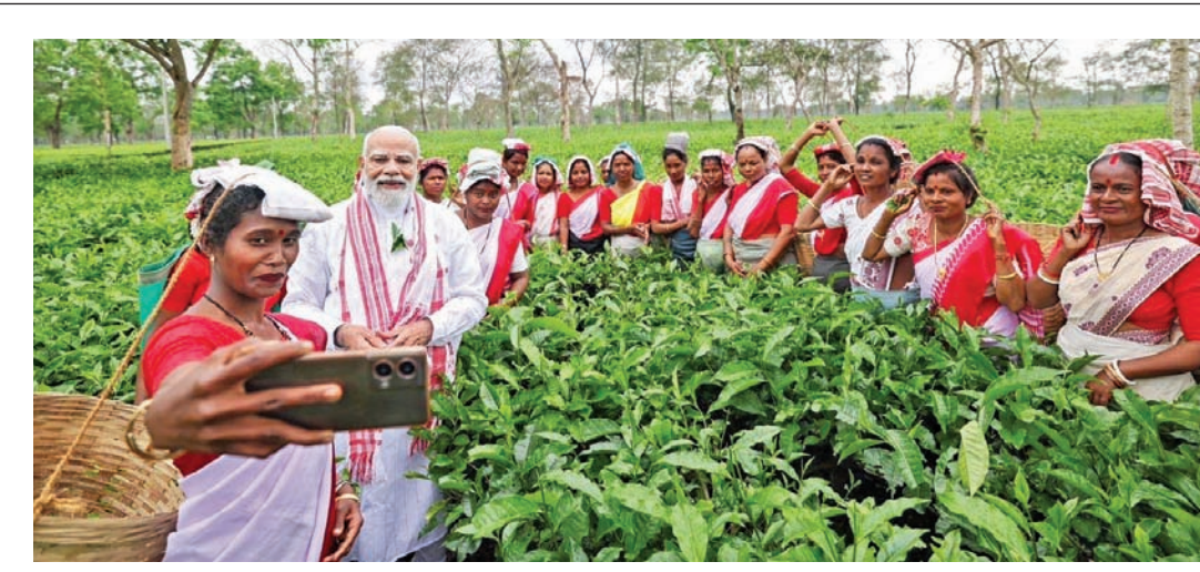
అసోంలోని ది బ్రూగ్ డి టోటల్ కార్మికులతో సెట్టి దిగుతున్న ప్రధాని మోడీ

>>> ఆరోగ్యశాఖ, మైనారిటీ సంక్షేమ శాఖల్లో పనిచేసే వేలాది మందికి లబ్ధి చేకూరుతుంది. నేరుగా భారత్ జమ కావడం వల్ల పారదర్శకం పెరుగుతుంది. ప్రభుత్వ శాఖల ఉద్యోగులకు ప్రస్తుతం ఏ విధంగానైతే ఇంటిగ్రేటెడ్ ఫైనాన్సియల్ మేనేజ్మెంట్ సిస్టమ్(ఐఎఫ్ఎఎస్) ద్వారా జీతాలు అందుతున్నాయో, ఆడి విధానాన్ని కాంట్రాక్ట్ సిబ్బందికి కూడా వర్తింపజేస్తున్నారు. దీని కోసం ఇప్పటికే అన్ని జిల్లాల అధికారులు సిబ్బంది ఆధార కాల్కులను వారి డ్రాస్ట్ కౌంటర్ అనుసంధానం చేసే ప్రక్రియను పూర్తి చేశారు. ఉన్నతాధికారులకు ఇందుకు సంబంధించిన డేటాను కూడా పంపించారు. ముఖ్యంగా మున్సిపాలిటీల్లో పనిచేసే పారిశుధ్య కార్మికులు,టెక్నికల్ చర్చుళ్లు గతంలో అనేక కష్టాలు పడేవారు,స్థానిక వస్తులు చూపుతూనే జీతాలు ఇస్తామనే నిబంధనలతో అధికారులు వారిపై ఒత్తిడి తెచ్చేవారు, టార్గెట్ల పూర్తికావడంతో నెలల తరబడి వేతనాలు ఆగిపోయేవి. దీంతో కార్మికులు తమ నిత్యసంరాల కోసం వడ్డీ వ్యాపారులను ఆశ్రయించి అప్పులపాలయ్యేవారు. ఇప్పుడు ప్రభుత్వం నేరుగా నిధులు విడుదల చేయనుండాంటే అధిక్తుల చూసాళ్లతో సంబంధం లేకుండా ప్రతి నెలా 1వ తేదీనే జీతం వచ్చి అవకాశం ఏర్పడింది.