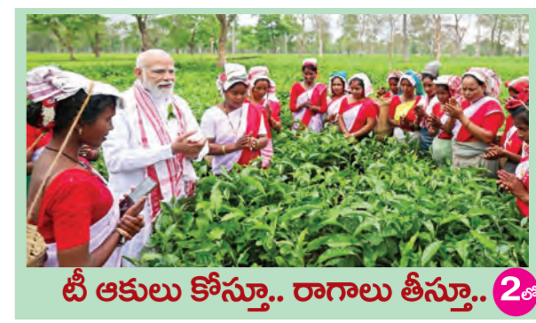
టీ ఆకులు కోస్తూ.. రాగాలు తీస్తూ.. 2వ