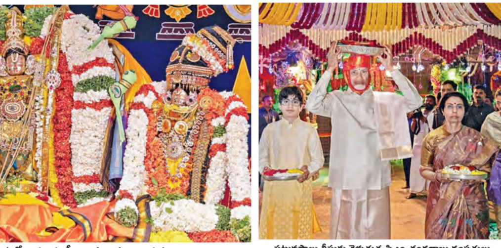
బంటిమిట్టలో బుధవారం సీతారాముల కల్యాణం దృశ్యం