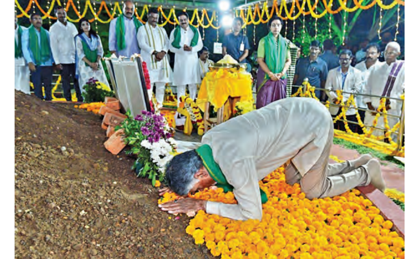
గురువారం అమరావతి బిల్లు ఆమోదంతో ఉద్దండరాయుని పాలెంలో అమరావతికి భూమిపూజ జరిగిన సందర్భంలో సాష్టాంగ ప్రణామం చేస్తున్న సిఎం చంద్రబాబు

అందులో రైతులు చేసిన త్యాగం శాశ్వతం. అనేక కుట్రలను ఎదుర్కొని రాజధానిని దక్కించుకున్నాం. రాజధానిని స్వీకారం అన్న వారు నేడు అడ్డన్ లేకుండా పోయారు. అమరావతిపై పార్లమెంటులో తిరుగులేని శాసనం చేసుకున్నాం. ఇప్పటి వరకు రాష్ట్రానికి అడ్డన్ లేదు, కానీ నేడు ఒక శాశ్వత అడ్డన్ వచ్చింది. అమరావతి రాజధాని అంధ్రుల ఆత్మగౌరవానికి బిహ్నం. 29 వేల మంది రైతులు 33 వేల ఎకరాలు ఇచ్చి చేసిన త్యాగం వల్లే ఈ విజయం సాధ్యమైంది. 1,631 రోజుల ఉద్యమం ఒక చరిత్ర. ఉద్యమాన్ని అడ్డుకున్న ప్రభుత్వంపై రాజధాని రైతులు,