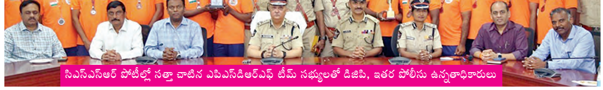
సిఎస్ఎస్ఆర్ పోటీల్లో సత్తా చాచిన ఎపిఎస్డిఆర్ఎఫ్ టీమ్ సభ్యులతో డిజిపి, ఇతర పోలీసు ఉన్నతాధికారులు