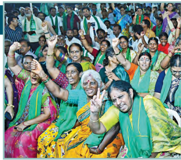
రాజ్యసభలో బిల్లు ఆమోదంతో గురువారం అమరావతిలో రైతుల సంబరాలు

విజయవాడ ఏప్రిల్ 2. ప్రభాతవార్త ప్రతినిధి: రాజధానిగా అమరావతికి చట్టబద్ధత లభించడం... రాష్ట్ర చరిత్రలో సువర్ణ అధ్యాయమని ముఖ్యమంత్రి నారా చంద్రబాబు నాయుడు పేర్కొన్నారు. పార్లమెంటు లోని ఉభయ సభల్లో ఆంధ్ర ప్రదేశ్ పునర్వ్యవస్థీకరణ (సవరణ) బిల్లు, 2026 ఏకగ్రీవంగా ఆమోదం పొందటంపై ఆయన హర్షం వ్యక్తం >>2