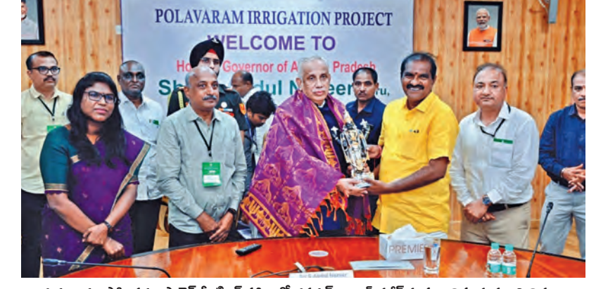
గురువారం పోలవరం ప్రాజెక్ట్ మీటింగ్ హాల్ లో గవర్నర్ అబ్దుల్ నజీర్ ను సన్మానిస్తున్న మంత్రి నిమ్మల

విజయవాడ, ఏప్రిల్ 2 ప్రభాతవార్త ప్రతినిధి: విజయవాడ నుంచి హైదరాబాద్ కు విమానంలో ప్రయాణించే వారికి ఇది తీసి కబురే! ఈ రెండు నగరాల మధ్య విమానయాన సేవలు మరింత విస్తృతం కానున్నాయి. కొత్తగా మరో రెండు విమాన సర్వీసులు అందుబాటులోకి రానున్నట్లు విజయవాడ అంతర్జాతీయ విమానాశ్రయం డైరెక్టర్ లక్ష్మీ కాంతరెడ్డి తెలిపారు. ఫై91 ఎయిర్ లైన్స్ సంస్థ ఈ సర్వీసులను నడపనున్నట్లు వెల్లడించారు. మొదటి సర్వీసు ఈ నెల 10వ తేదీ నుంచి ప్రారంభం కానుంది. ఈ విమానం ప్రతిరోజూ ఉదయం 6:05 గంటలకు హైదరాబాద్ లో బయలుదేరి 7:10 గంటలకు విజయవాడ చేరుకుంటుంది. తిరిగి విజయవాడ నుంచి ఉదయం 7:30 గంటలకు >>2