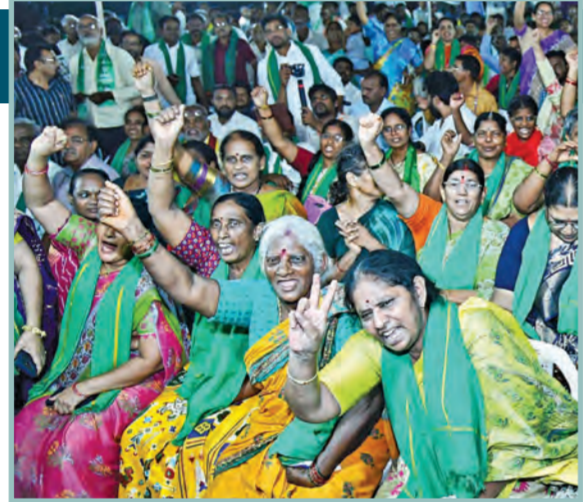
రాజ్యసభలో బిల్లు ఆమోదంతో గురువారం అమరావతిలో రైతుల సందరాలు