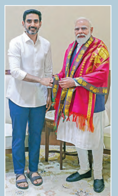
గురువారం న్యూఢిల్లీలో ప్రధాని మోడీకి కృతజ్ఞతలు తెలుపుతున్న మంత్రి లోకేశ్