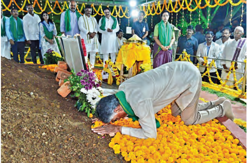
గురువారం అమరావతి బిల్లు ఆమోదంతో ఉద్ధవరాయుని పాలెంలో అమరావతికి భూమిపూజ జరిగిన సందర్భంలో సాష్టాంగ ప్రణామం చేస్తున్న సిఎం చంద్రబాబు