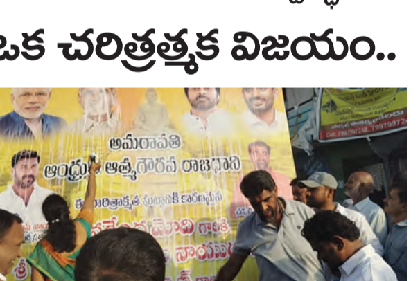
సుండుపల్లె, ఏప్రిల్ 02, ప్రభాతవార్త :