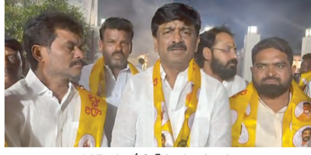
పులివెందుల, ఏప్రిల్ 2, ప్రభాత వార్త :

అమరావతిని ఆంధ్రప్రదేశ్ ఏకైక రాజధానిగా నిలబెట్టే దిశగా లోక్ సభ, రాజ్యసభలో బిల్లులు ప్రవేశపెట్టడం రాష్ట్ర చరిత్రలో ఒక కీలక మైలురాయిగా నిలిచిందని టి.డి.పీ నాయకుడు బి.బెకే రవి పేర్కొన్నారు. ఈ నిర్ణయాన్ని కూటమి పార్టీల శ్రేణులు హడావిడికలతో స్వాగతించుకున్నాయి తెలిపారు. దేశంలోని దాదాపు రాజకీయ పార్టీలు ఈ ప్రాజెక్టు మద్దతు తెలపడం ఆంధ్రప్రదేశ్ ప్రజల గెలుపుగా అభివర్ణించారు. ఒకే రాష్ట్రానికి ఒకే రాజధాని అన్న తమ నిబద్ధత నేడు నిజమైందని ఆయన పేర్కొన్నారు. ముఖ్యమంత్రి నారా చంద్రబాబు నాయుడు దూరదృష్టితో అమరావతిని అంతర్జాతీయ ప్రమాణాలతో అభివృద్ధి చేస్తామని తెలిపారు. సైబరాబాద్ ను ప్రపంచ వటంలో నిలబెట్టిన విధంగా అమరావతిని కూడా అభివృద్ధి చేస్తామని ఆయన విశ్వాసం వ్యక్తం చేశారు. అదే సమయంలో, వైఎస్ జగన్ మోహన్ రెడ్డి ప్రభుత్వం మూడు రాజధానుల పేరుతో ఆడిన రాజకీయానికి నేడు ముగింపు పలికిందని విమర్శించారు. రాయలసీమ ప్రాంతానికి చెందిన వ్యక్తిగా అమరావతి అభివృద్ధి ప్రతి ఒక్కరికీ గర్వకారణమని టి.బి.కే రవి ఆన్నారు. బెంగళూరు- అమరావతి, ఆనంతపుర్ - అమరావతి మధ్య వేగవంతమైన రవాణా సదుపాయాలు రాష్ట్ర అభివృద్ధికి కొత్త దిశలు తీసుకురావచ్చాయని పేర్కొన్నారు. ఈ చారిత్రాత్మక విజయానికి కృషి చేసిన ఎం.టి.ఎ, ఉద్యమకారులు, ప్రజలకు ఆయన హృదయ పూర్వక కృతజ్ఞతలు తెలిపారు.