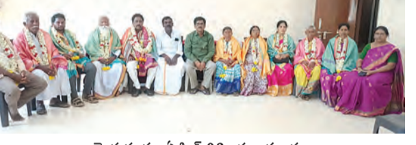
మైదుకూరు, ఏప్రిల్ 02, ప్రభాతవార్త: