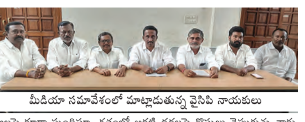
మీడియా సమావేశంలో మాట్లాడుతున్న వైసిపి నాయకులు