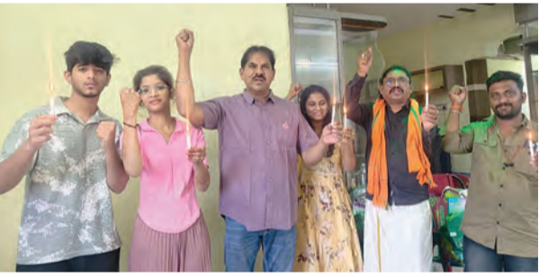
వేంపల్లె, ఏప్రిల్ 02 ప్రభాత వార్త )