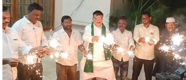
కడప కార్పొరేషన్ ఏప్రిల్ 2 ప్రభాతవార్త: