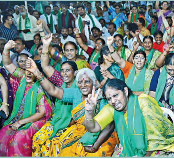
రాజ్యసభలో బిల్లు ఆమోదంతో గురువారం అమరావతిలో రైతుల సంబరాలు

ఈ సందర్భంగా మాట్లాడిన కేంద్రమంత్రి రామ్మోహన్ నాయుడు తెలుగు ప్రజలందరికీ ఇవాళ చరిత్రాత్మకమైన రోజు అని అన్నారు. "బిల్లు ప్రవేశపెట్టడాన్ని తెలుగు ప్రజలంతా గర్వంగా భావిస్తున్నారు. ప్రజా రాజధాని అమరావతి చరిత్రలో గుర్తుంటుంది. సంక్షోభాలను అవకాశాలుగా మలచుకోవడం మా నాయకుడు నేర్పించారు. ఆంధ్ర ప్రదేశ్ రాజధాని గురించి ప్రజలకు స్పష్టత ఇస్తున్నాం. రాజధాని కోసం ఉద్దేశించిన రైతులు, మహిళలకు సరైన న్యాయం దక్కింది. విభజన సమయంలో ఒక రాష్ట్రానికి రాజధాని ఉంది, మరో రాష్ట్రానికి లేదు అని వెల్లడించారు. సభ్యులు అడ్డుకున్నారు. మహిళా రిజర్వేషన్లపై 30 ఏళ్ల పాటు ఏం చేశారో ఖర్చే ప్రశ్నించారు. బిల్లు ప్రవేశపెట్టడం రైతుల విజయమని రేణుకా చౌదరి అన్నారు. ఉద్దేశమే అమరావతికి రైతులను, మహిళలను అంధ్రుల అత్యగౌరవానికి బిచ్చం. రాజధానిపై 12 ఏళ్లగా అస్పృహత ఉందని వెల్లడించారు. అస్పృహత వల్ల పెట్టుబడులు వెనక్కి వెళ్లాయని >>2