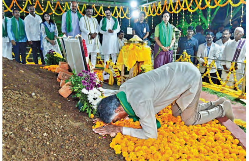
గురువారం అమరావతి బిల్లు ఆమోదంతో ఉద్దండరాయని పాలెంలో అమరావతికి భూమిపూజ జరిగిన ప్రాంతంలో సాక్షిగా ప్రజామం చేసేందుకు సిఎం చంద్రబాబు

అందులో రైతులు చేసిన త్యాగం శాశ్వతం. అనేక కుట్రలను ఎదుర్కొని రాజధానిని దక్కించుకున్నాం. రాజధానిని స్వీకారం అన్న వారు నేడు అడ్డం లేకుండా పోయారు. అమరావతిపై పార్లమెంటులో తిరుగులేని శాసనం చేసుకున్నాం. ఇప్పటి వరకు రాష్ట్రానికి అడ్డం లేదు, కానీ నేడు ఒక శాశ్వత అడ్డం వచ్చింది. అమరావతి రాజధాని అంధ్రుల అత్యగౌరవానికి బిచ్చం. 29 వేల మంది రైతులు 33 వేల ఎకరాలు ఇచ్చి చేసిన త్యాగం వల్లే ఈ విజయం సాధ్యమైంది. 1,631 రోజుల ఉద్యమం ఒక చరిత్ర. ఉద్యమాన్ని అడ్డుకున్న ప్రభుత్వంపై రాజధాని రైతులు,