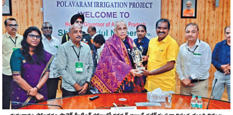
గురువారం పోలవరం ప్రాజెక్ట్ మీటింగ్ హాలులో గవర్నర్ అబ్దుల్ నజీర్ ను సన్మానిస్తున్న మంత్రి నిమ్మల

విజయవాడ, ఏప్రిల్ 2 ప్రభాతవార్త ప్రతినధి: విజయవాడ నుంచి హైదరాబాద్ విమానంలో ప్రయాణించే వారికి ఇది తీపి కబురు! ఈ రెండు నగరాల మధ్య విమానయాన సేవలు మరింత విస్తృతం కానున్నాయి. కొత్తగా మరో రెండు విమాన సర్వీసులు అందుబాటులోకి రానున్నట్లు విజయవాడ అంతర్జాతీయ విమానాశ్రయ డైరెక్టర్ లక్ష్మీ కాంఠారెడ్డి తెలిపారు. పై91 ఎయిర్ లైన్స్ సంస్థ ఈ సర్వీసులను నడపనున్నట్లు వెల్లడించారు. మొదటి సర్వీసు ఈ నెల 10వ తేదీ నుంచి ప్రారంభం కానుంది. ఈ విమానం ప్రతిరోజూ ఉదయం 6:05 గంటలకు హైదరాబాద్ బయలుదేరి 7:10 గంటలకు విజయవాడ చేరుకుంటుంది. తిరిగి విజయవాడ నుంచి >>2