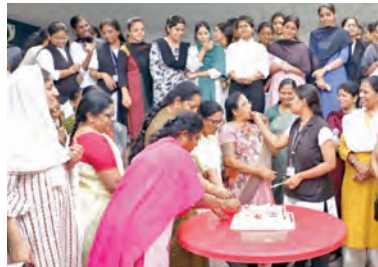
తిరుపతి, ఏప్రిల్ 2 ప్రభాత వార్త ప్రతినిధి: అమరావతి బిల్లు రాజ్యసభలో ఆమోదం పొందిన సందర్భంగా తిరుపతి వద్దావతి మహిళా

- అమరావతి బిల్లు ఆమోదంతో పద్మావతి వర్నిటీలో సంబరాలు