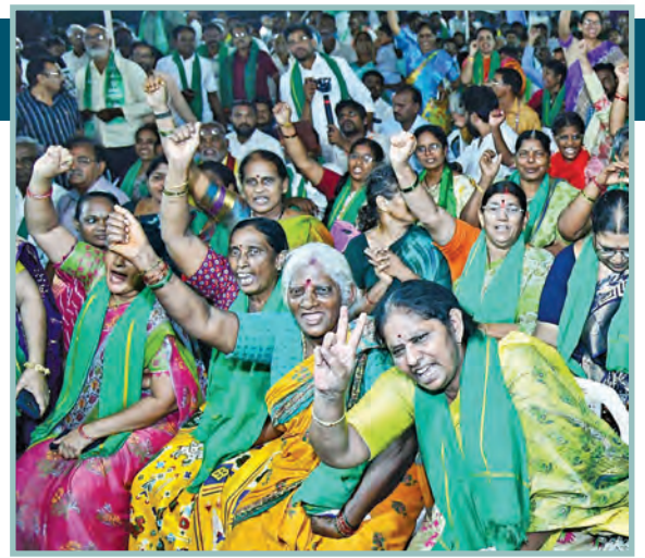
రాజ్యసభలో బిల్లు ఆమోదంతో గురువారం అమరావతిలో రైతుల సంబరాలు

ఈ సందర్భంగా మాట్లాడిన కేంద్రమంత్రి రామోహన్ నాయుడు తెలుగు ప్రజలందరికీ ఇవాళ చరిత్రాత్మకమైన రోజు అని అన్నారు. "బిల్లు ప్రవేశపెట్టడాన్ని తెలుగు ప్రజలంతా గర్వంగా భావిస్తున్నారు. ప్రజా రాజధాని అమరావతి చరిత్రలో గుర్తుంటుంది. సంక్షోభాలను అవకాశాలుగా మలమకోవడం మా నాయకుడు నేర్పించారు. ఆంధ్ర ప్రదేశ్ రాజధాని గురించి ప్రజలకు స్పష్టత ఇస్తున్నాం. రాజధాని కోసం ఉద్యమించిన రైతులు, మహిళలకు సరైన న్యాయం దక్కింది. విభజన సమయంలో ఒక రాష్ట్రానికి రాజధాని ఉంది, మరో రాష్ట్రానికి లేదు అని వెల్లడించారు. సభ్యులు అడ్డుకున్నారు. మహిళా రిజర్వేషన్లపై 30 ఏళ్ల పాటు ఏం చేశారని ఖగ్గే ప్రశ్నించారు. బిల్లు ప్రవేశపెట్టడం రైతుల విజయమని రేణుకా చౌదరి అన్నారు. ఉద్యమ సమయంలో రైతులను, మహిళలను తీవ్రంగా హింసించారన్నారు. రాజధానిపై 12 ఏళ్లుగా అన్యాయం ఉందని వెల్లడించారు. అన్యాయం పట్ల పెట్టుబడులు వెనక్కి వెళ్లాయని >>2