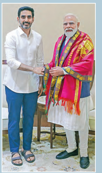
గురువారం న్యూఢిల్లీలో ప్రధాని మోడీకి కృతజ్ఞతలు తెలుపుతున్న మంత్రి లోకేశ్

3-4-2026 శుక్రవారం సంపుటి: 32 సంఠిక: 62 పేజీలు: 8+4 వెల: 6.50