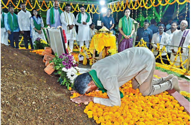
గురువారం అమరావతి బిల్లు ఆమోదంతో ఉద్ధవరాయుని పాలెంలో అమరావతికి భూమిపూజ జరిగిన సందర్భంలో సాక్షింగ ప్రజామం చేస్తున్న సిఎం చంద్రబాబు