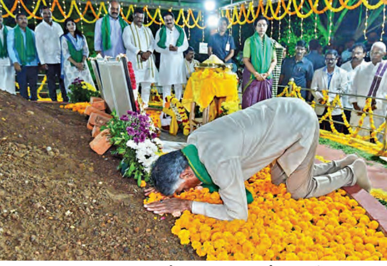
గురువారం అమరావతి బిల్లు ఆమోదంతో ఉద్ధండరాయుని పాలెంలో అమరావతికి భూమిపూజ జరిగిన ప్రాంతంలో సాష్టాంగ ప్రణామం చేస్తున్న సిఎం చంద్రబాబు

అందులో రైతులు చేసిన త్యాగం శాశ్వతం. అనేక కుట్రలను ఎదుర్కొని రాజధానిని దక్కించుకున్నాం. రాజధానిని స్థాపనం అన్న వారు నేడు ఆడ్రెస్ లేకుండా పోయారు. అమరావతిపై పార్లమెంటులో తిరుగులేని శాసనం చేసుకున్నాం. ఇప్పటి వరకు రాష్ట్రానికి ఆడ్రెస్ లేదు, కానీ నేడు ఒక శాశ్వత ఆడ్రెస్ వచ్చింది. అమరావతి రాజధాని అందడం అత్యుద్దేశానికి విహ్వలం. 29 వేల మంది రైతులు 33 వేల ఎకరాలు ఇచ్చి చేసిన త్యాగం వల్లే ఈ విజయం సాధ్యమైంది. 1,631 రోజుల ఉద్యమం ఒక చరిత్ర. ఉద్యమాన్ని అడ్డుకున్న ప్రభుత్వంపై రాజధాని రైతులు,