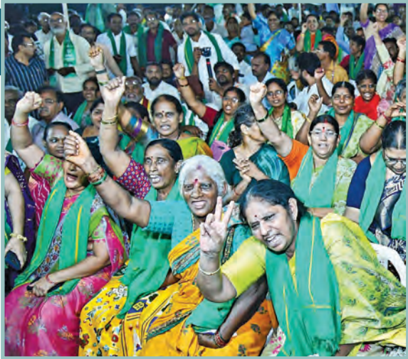
రాజ్యసభలో బిల్లు ఆమోదంతో గురువారం అమరావతిలో రైతుల సంబరాలు

ప్రధాని మోడీ, అమితాబ్ బాచు ప్రత్యేక ధన్యవాదాలు: సిఎం చంద్రబాబు