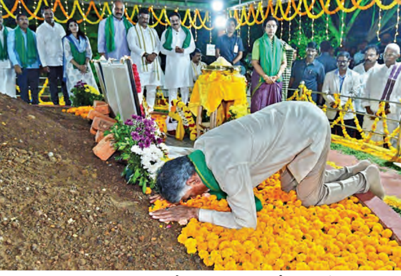
గురువారం అమరావతి బిల్లు ఆమోదంతో ఉద్దండరాయుని పాలెంలో అమరావతికి భూమిపూజ జరిగిన ప్రాంతంలో సాష్టాంగ ప్రణామం చేస్తున్న సిఎం చంద్రబాబు

అందులో రైతులు చేసిన త్యాగం శాశ్వతం. అనేక కుట్రలను ఎదుర్కొని రాజధానిని దక్కించుకున్నాం. రాజధానిని స్మృతానం అన్న వారు నేడు ఆడ్రస్ లేకుండా పోయారు. అమరావతిపై పార్లమెంటులో తిరుగులేని శాసనం చేసుకున్నాం. ఇప్పటి వరకు రాష్ట్రానికి ఆడ్రస్ లేదు, కానీ నేడు ఒక శాశ్వత ఆడ్రస్ వచ్చింది. అమరావతి రాజధాని అంధ్రం అత్యగౌరవానికి విహ్వం. 29 వేల మంది రైతులు 33 వేల ఎకరాలు ఇచ్చి చేసిన త్యాగం వల్లే ఈ విజయం సాధ్యమైంది. 1,631 రోజుల ఉద్యమం ఒక చరిత్ర. ఉద్యమాన్ని అడ్డుకున్న ప్రభుత్వంపై రాజధాని రైతులు,