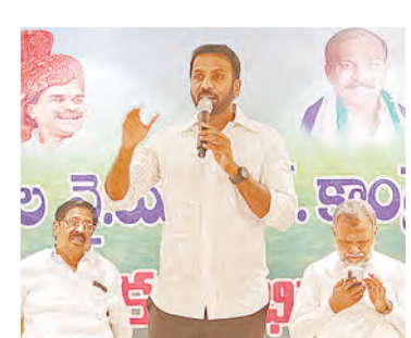
కార్యకేంద్ర విద్యను అందించామని చెప్పారు. అయితే దానిని నేటి తెలుగు దేశం ప్రభుత్వం అడ్డుకుందని చెప్పారు. పేదవారు ఇంధనం చదువులెక్కువవకూడదా. నీయం కుమారుడు నేటి బడిశాఖ మంత్రి ఎక్కడ చదివాడో అయినకు తెలియదా. అలాగే నీయం మనమును నేడు ప్రభుత్వం పాఠశాలలో చదవుతున్నాడో అని ముఖ్యమంత్రి

నంద్యాల, ఏప్రిల్ 3, ప్రభాతవార్త ప్రతినంది : మన పార్టీ అధికారంలో ఉండగా ఎన్నో పనులు చేశాము వాటిని రాబోవు ఎన్నికల్లో ప్రచారము చేసి విజయమే లక్ష్యంగా పని చేయాలని నంద్యాల మాజీ యంఝం శిల్పారవివంధ్రకేశోరెడ్డి పార్టీ నాయకులకు పిలుపు నిచ్చారు. ఈ సందర్భము ఒక ప్రముఖవేటర్లలో మాజీ సర్పంచులు, మాజీ కోస్టులర్లు, యంపిఐసీ, యంపిపిలతో సమావేశము నిర్వహించారు. ఈసందర్భముగా అయిన మాజీనాయకుల మనము అధికారములో ఉండగా ఎన్నో అభివృద్ధి కార్యక్రమాలు చేపట్టాము అయితే వాటిని మనము చెప్పకపోక పోవచ్చును అన్నారు. ఉదాహరణముగా నంద్యాలలో మెడికల్ కాలేజీ, అలాగే గ్రామంలో పాఠశాల పనులవరకు నాడు చేసిన కార్యక్రమము చేపట్టి నూర్పల్లె రూపేరేఖలు మార్చుమని చెప్పారు. అలాగే అన్ని గ్రామాల పాఠశాలలో ఇంధన మిడియం ఏర్పాటు చేసి పేదపిల్లలకు