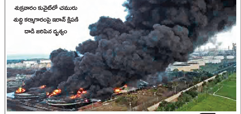
శుక్రవారం కువైట్ లో చమురు శుద్ధి కర్మాగారంపై ఇరాన్ క్షిపణి దాడి జరిపిన దృశ్యం

అమెరికా ఫెటర్ జెట్ల కూల్చివేత గల్ఫ్ దేశాల్లోని 8 వంతెనలు కూల్చివేయాలని ఇరాన్ టార్గెట్ హార్డుట్ జలసంఘిని తెలిపింది తీరుతాం: ట్రంప్ ట్రంప్ కు ఆయన స్టేట్ లోనే జవాబిస్తాం: ఇరాన్ >>2