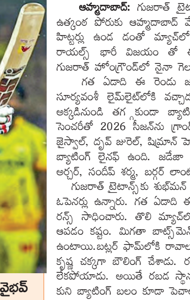
గుజరాత్ టైటాన్స్ శతకంతో వెలుగులోకి వచ్చాడు

అవ్వదాబాద్: గుజరాత్ టైటాన్స్, రాజస్థాన్ రాయల్స్ మధ్య మరో డెత్వంకం పోరుకు అవ్వదాబాద్ వేదిక కానుంది. రెండు జట్లలోనూ హార్డ్ డెత్వంకం దంతో మ్యాచ్లో పరుగుల వరద ఛాయం. రాజస్థాన్ రాయల్స్ భారీ విజయం తో ఈ మ్యాచ్ కోసం ఎదురుచూస్తుండగా... గుజరాత్ హోంగ్రౌండ్లో సైనిక గెలుపు పోటీ చేయాలని ఉద్దేశించుకుంది. గత ఏడాది ఈ రెండు జట్ల మధ్య జరిగిన మ్యాచ్లోనే వైఫల్య సూర్యవంశీ లైమెట్లలోకి వచ్చాడు. 35 బంతుల్లోనే శతకం బాధించి అక్కడినుండి తగ్గ కూడా బ్యాటింగ్ కోసం సాగున్నాడు. మెరుపు హాఫ్ సెంచురీతో 2026 సీజన్ ను గ్రాండ్గా అరంభించాడు. మరోవైపు యుజ్వాల్ ఛాస్టాన్, ధృవ్ బాచెల్, షివ్ హామ్బ్లర్, రవీంద్ర జడేజా రూపంలో స్ట్రాంగ్ బ్యాటింగ్ లైన్ ఉంది. జడేజా స్ట్రైక్ బౌలింగ్ ఆదనపు బలం. జోప్రా అర్జున్, సందీప్ శర్మ, బర్గర్ లాంటి మేటి పేసర్ అటాక్ ఉంది. గుజరాత్ టైటాన్స్ కు శుభీమన్ గిల్, సాయి సుదర్శన్ రూపంలో చక్కని ఓపెనర్లు ఉన్నారు. గత ఏడాది ఈ జోడి 159.33 ప్రయోక్ రేట్తో 912 రన్స్ సాధించారు. తొలి మ్యాచ్లో విఫలమైన... ట్రాఫ్లో పడితే వీరిని పంజాబ్ కెప్టెన్. మిగతా బ్యాట్స్మెన్ కూడా రాజీంబాడు స్కోరుపై ఆశలు ఉండాలి. బట్లర్ ఫామ్లోకి రావాలని ఆశిస్తున్నాడు. తొలి మ్యాచ్లో ప్రసిద్ధ్ కృష్ణ చక్కగా బౌలింగ్ చేశాడు. రవీంద్ర జడేజా అనుకున్నంత మేర రాజీంబాడు లేకపోయాడు. అయితే రవీంద్ర స్ట్రాంగ్ జేసన్ హోల్డర్ ను జట్టులోకి తీసుకుని బ్యాటింగ్ బలం కూడా పెంచాలని లక్ష్యంతో గుజరాత్ ఉంది.