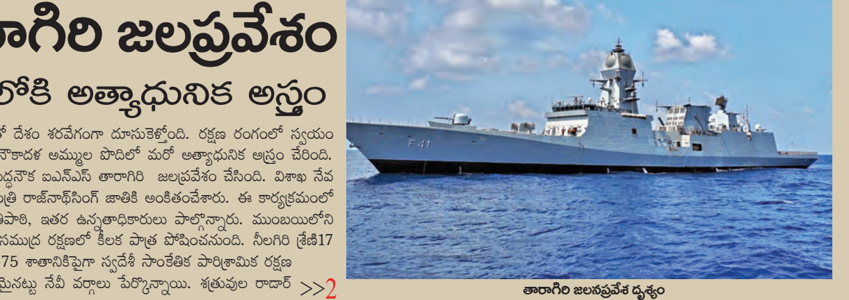
తారాగిరి జలప్రవేశం దృశ్యం

విఎన్ఎస్ తారాగిరి జలప్రవేశం నేవీ అమ్ముల పాదిలికి అత్యాధునిక అస్త్రం విశాఖపట్నం, ఏప్రిల్ 3 ప్రభాతవార్త: ఆత్మనిర్భర భారత్ తో దేశం శరవేగంగా దూసుకెళ్తోంది. రక్షణ రంగంలో స్వయం సమృద్ధి సాధించడంలో కీలక ముందడుగు వడింది. నౌకాదళ అమ్ముల పాదిలిలో మరో అత్యాధునిక అస్త్రం చేరింది. నవ్వడేశీ పరిశోధనలో రూపొందించిన స్పెల్డ్ ట్రిగ్గర్ యుద్ధనౌక ఐఎన్ఎస్ తారాగిరి జలప్రవేశం చేసింది. విశాఖ నేవీ లోకాయాచార్య శుక్రవారం ఈనౌకను కేంద్రరక్షణ మంత్రి రాజీనాథ్ సింగ్ జాతికి అంకితం చేశారు. ఈ కార్యక్రమంలో సీఎస్ జనరల్ అనిల్ చౌహాన్, నేవీ చీఫ్ డి.ఎస్ కె.టి.పాటి, ఇతర ఉన్నతాధికారులు పాల్గొన్నారు. ముంబయిలోని మజగావ్ డాక్ షిప్ లో నిర్మించిన ఈ యుద్ధ నౌక సముద్ర రక్షణలో కీలక పాత్ర పోషించనుంది. సీలగిరి శ్రేణి 17 ఏలర్ ఇది నాలుగోది. ఆత్మనిర్భర భారత్ లో భాగంగా 75 శాతానికి పైగా నవ్వడేశీ సాంకేతిక పారిశ్రామిక రక్షణ ఉత్పత్తుల తయారీ సంస్థలు ఇందులో భాగస్వామ్యమైనట్లు నేవీ వర్గాలు పేర్కొన్నాయి. శత్రువుల దాడుల >>2