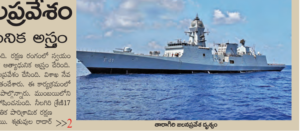
తారాగిరి జలప్రవేశం దృశ్యం

విశాఖపట్నం, ఏప్రిల్ 3 ప్రభాతవార్త: ఆత్మనిర్భర భారత్ తో దేశం శరవేగంగా దూసుకెళ్తోంది. రక్షణ రంగంలో స్వయం సమృద్ధి సాధించడంలో కీలక ముందడుగు పడింది. సాంకేతి అమ్ముల పొదిలో మరో అత్యాధునిక అస్త్రం చేరింది. స్వదేశీ పరిష్కారంతో రూపొందించిన స్పెల్డ్ ట్రైగ్గర్ కు బిల్లు నాని అమ్ముల పొదిలో మరో అత్యాధునిక అస్త్రం చేరింది. సాంకేతి అమ్ముల పొదిలో మరో అత్యాధునిక అస్త్రం చేరింది. స్వదేశీ పరిష్కారంతో రూపొందించిన స్పెల్డ్ ట్రైగ్గర్ కు బిల్లు నాని అమ్ముల పొదిలో మరో అత్యాధునిక అస్త్రం చేరింది. >>2