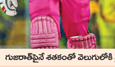
గుజరాత్ పైనే శతకంతో వెలుగులోకి వైభవ్

గుజరాత్ టైటాన్స్ కు శుభ్రమే గిల్, సాయి సుదర్శన్ రూపంలో చక్కని ఓపెనర్లు ఉన్నారు. గత ఏడాది ఈ జోడి 159.33 ట్రయ్స్ రేట్తో 912 రన్స్ సాధించారు. తొలి మ్యాచ్లో విఫలమైనా... ట్రాక్లో పడితే వీరిని ఆపడం కష్టం. మిగతా బ్యాట్ మెన్ కూడా రాణిస్తే భారీ స్కోరుపై ఆశలు ఉంటాయి. బర్దర్ పావలోకి రావాలని ఆశిస్తున్నాడు. తొలి మ్యాచ్లో ప్రసిద్ధి కృష్ణ చక్కగా బౌలింగ్ చేశాడు. రవీంద్ర ఖాన్ అనుకున్నంత మేర రాణింపలేకపోయాడు. అయితే రబడ నానంద్ జెసన్ హోల్డర్ను జట్టులోకి తీసుకుని బ్యాటింగ్ బలం కూడా పెంచాలన్న లక్ష్యంతో గుజరాత్ ఉంది.