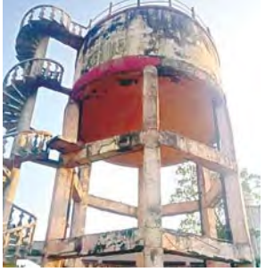
అచ్చుతాపురం, ఏప్రిల్ 3, ప్రభాతవార్త

అంగన్వాడీ పక్కనే ప్రమాద ఘంటిక, అధికారుల నిర్లక్ష్యంపై ఆగ్రహం