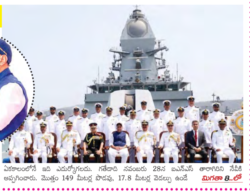
విశాఖలోనే ఐడి ఎదుర్కొగలదు. గతేడాది నవంబరు 28న ఐఎన్ఎస్ తారాగిరిని నేవీకి అప్పగించారు. మొత్తం 149 మీటర్ల పొడవు, 17.8 మీటర్ల వెడల్పు ఉండే మిగతా 8..లో

విశాఖపట్నం, ఏప్రిల్ 3 ప్రభాతవార్త అత్యున్నత భారత్ దేశం శరవేగంగా దూసుకెళ్ళింది. రక్షణ రంగంలో స్వయం సమృద్ధి సాధించడంలో కీలక ముందడుగు వదిలింది. నౌకాధికారి అమ్ములపాదలో మరో అత్యాధునిక అస్త్రం చేరింది. స్వదేశీ పరిజ్ఞానంతో రూపొందించిన సైల్వర్ ప్రోగ్రెస్ యుద్ధ నౌక ఐఎన్ఎస్ తారాగిరి జలప్రవేశం చేసింది. విశాఖ నేవల్ డాక్ యార్డ్లో శుక్రవారం ఈ నౌకను కేంద్ర రక్షణ మంత్రి రాజీనాథ్ సింగ్ జాతీయ అంకితం చేశారు. ఈ కార్యక్రమంలో డి.వి.ఎస్ జనరల్ అనిల్ చౌహాన్, నేవీ చీఫ్ డిన్ కె.త్రిపాఠి, ఇతర ఉన్నతాధికారులు పాల్గొన్నారు. ముంబయిలోని మజున్ డాక్స్ లిమిటెడ్ నిర్మించిన ఈ యుద్ధ నౌక సముద్ర రక్షణలో కీలక పాత్ర పోషించనుంది. సిలగిరి శ్రేణి 17వో ఐడి నాలుగోది. అత్యున్నత భారత్లో భాగంగా 75 శాతానికిపైగా స్వదేశీ సాంకేతిక పారిశ్రామిక రక్షణ ఉత్పత్తుల తయారీ సంస్థలు ఇందులో భాగస్వామ్యమై ట్యు నేవీ వర్గాలు పేర్కొన్నాయి. శ్రేణిపై రాధార్లలో చిక్కుకుండా అత్యంత రహస్యంగా పనిచేయడం దీని ప్రత్యేకత. గాలిలోని లక్ష్యాలను, ఉపరితలంలో పాలు సముద్రగర్భంలోని జలాంతర్గాములను