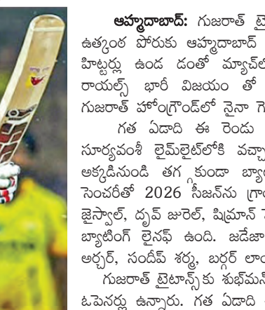
గుజరాత్ పైనే శతకంతో వెలుగులోకి వెళ్లవో

అమ్మాదాబాద్: గుజరాత్ బ్రిటాన్, రాజస్థాన్ రాయల్స్ మధ్య మరో ఉత్సాహం పోరుకు ఆహ్వానం వేడక కానుంది. రెండు జట్లలోనూ హార్ట్ డ్రాప్లు ఉండడంతో మ్యాచ్లో పరుగులు వరకే జరుగుతుంది. రాజస్థాన్ రాయల్స్ భారీ విజయం తో ఈ మ్యాచ్ కోసం ఎదురుచూస్తుండగా.. గుజరాత్ హోంగ్రౌండ్లో నైనా గెలుపు బోజీ చేయాలని ఉభయభాగంతోంది. గత ఏడాది ఈ రెండు జట్టు మధ్య జరిగిన మ్యాచ్లోనే వైశాఫ్ సూర్యవంశీ లైవ్ లైట్లోకి వచ్చాడు. 35 బంతుల్లోనే శతకం బాగాడు. అక్కడినుండి తగ్గుకుంటూ బ్యాటింగ్ కొనసాగిస్తున్నాడు. మెరుపు హాఫ్ సెంచరీతో 2026 సీజన్ను గ్రాండ్గా ఆరంభించాడు. మరోవైపు యశ్విన్ జైస్వాలి, ధ్వని జారెల్, షివ్రామ్ హెగ్డే, రవీంద్ర జడేజా రూపంలో స్ట్రోంగ్ బ్యాటింగ్ లైవ్ లైట్ ఉంది. జడేజా స్పిన్ బౌలింగ్ అడనపు బలం. జోషా ఆర్డర్, సందీప్ శర్మ, బర్దర్ లాంటి మేటి పేస్ ఆటాక్ ఉంది. గుజరాత్ బ్రిటాన్ కు శుభవేస్ గెల్, సాయి సుందర్ రూపంలో చక్కని ఓపెనర్లు ఉన్నారు. గత ఏడాది ఈ జోడీ 159.33 ప్రయిక్ రేటితో 912 రన్స్ సాధించారు. తొలి మ్యాచ్లో విఫలమై... ట్రాక్లో పడితే వీరిని అవడం కష్టం. మిగతా బ్యాట్స్ మెన్ కూడా రాజీస్థాన్ భారీ స్కోరుపై ఆశలు ఉంటాయి. బట్లర్ ఫామోస్ రోహిత్ రావాలని ఆశిస్తున్నాడు. తొలి మ్యాచ్లో ప్రసిద్ధ్ క్రీకెట్ చక్కగా బౌలింగ్ చేశాడు. రవీంద్ర జడేజా అనుకున్నంత మేర రాజీస్థాన్ లైవ్ లైట్లో. అయితే రబడ స్టాండ్లో ఖైసన్ హోల్డెన్ జట్టులోకి తీసుకుని బ్యాటింగ్ బలం కూడా పెంచాల్సి లక్ష్యంతో గుజరాత్ ఉంది.