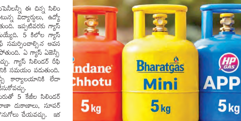
ఐదు కిలోల సిలిండర్లను మి గ్యాస్ ఏజెన్సీ కార్యాలయానికి రేదా సమీపంలోని దురాకాల్లో సులువుగా రిఫిల్లింగ్ చేసుకోవచ్చు.

ముంబయి, ఏప్రిల్ 3: గ్యాస్ సిలిండర్లలో ఇప్పటివరకు ఉన్న 14.2 కిలోల సిలిండర్లకు తోడు ఇప్పుడు కొత్తగా ఐదు కిలోల సిలిండర్లకూడా అందుబాటులోకి వచ్చాయి. అయితే ఇప్పుడు 5 కిలోల సిలిండర్లు కూడా అందుబాటులోకి వచ్చాయి. ఈ మేరకు అన్ని గ్యాస్ కంపెనీలు 5 కేజీల లో కంపెనీలు ఈ నిర్ణయం తీసుకున్నాయి.