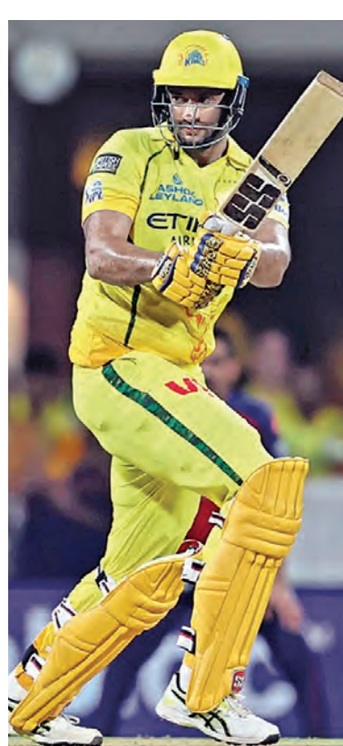
సిక్స్లు, 4 ఫోర్లతో ఆర్డర్నంత సాధించి అవులు అయ్యాడు. మిగతా పనిని శశంక సింగ్, స్ట్రోయ సిన్ పూర్తి చేసి పంజాబ్ గెలుపొందించారు.

చెన్నై: సొంత మైదానంలో చెన్నై సూపర్ కింగ్స్ కురాళ్లు కమ్ముతారు. చెపాక్లో సుడిగాలి ఇన్నింగ్స్ ఆడిన అయ్యుమ్ మాత్రం (73) ఆర్డర్ శతకం తరం తొక్కా.. పంజాబ్ కింగ్స్ బౌలర్లకు సర్దురాజ్ ఖాన్(32) డడ పుట్టించాడు. మాత్రం మెరుపులతో డీలా పడిన ప్రత్యర్థిని డెత్ ఓవర్లలో శివం దూబే (45 నానోబి) మరింత కుంగదీసేలా బౌండరీలతో విరుచుకుపడ్డాడు. ఈ ముగ్గురి విద్వేసంతో రెండోదలు కోట్లైన చెన్నైకు ఆ స్కోరు కూడా నిలబడలేదు. చెపాక్లోనూ చెన్నై సూపర్ కింగ్స్ కు నిరాశే మద్దతు. 210 పరుగుల లక్ష్యంతో బ్యాటింగ్ కు దిగిన పంజాబ్ కింగ్స్... మరో 8 బంతులుండగానే 5 వికెట్లు కోల్పోయి లక్ష్యాన్ని అందుకుంది. ప్రీయాన్ ఆర్ట్(11 బంతుల్లో 39) మెరుపు దూడీతో ప్రారంభమైన పంజాబ్ డేటింగ్ ప్రభుసీఘాస్ సింగ్(34 బంతుల్లో 43), కూపర్ కాన్హె(22 బంతుల్లో 36), శ్రీయాన్ అయ్యర్(24 బంతుల్లో 46), నేహాల్ వధోరా(13) వరకు కొనసాగింది. ఖలీల్ బంతులను ఫోర్, సిక్స్లతో ఇన్నింగ్స్ ఆలంబించిన ప్రీయాన్ ఆర్ట్... ఆ తర్వాత మాల్ హెల్ లిజ్ట్ 4, 6, 4తో 20 రన్స్ సాధించాడు. కరణ్ శిక్షా ప్రభు సిహాన్ మూడు ఫోర్లతో అటాక్ చేశాడు. ఈ విధంగా బుట్టిన బ్యాట్స్ మెన్ వచ్చినట్లే చెన్నై బౌలర్లు విరుచుకుపడడంతో 200 ప్లస్ లక్ష్యం కూడా చిన్నతోయింది. ముఖ్యంగా శ్రీయాన్ అయ్యర్ కెప్టెన్ ఇన్నింగ్స్ ఆడాడు. 29 బంతుల్లోనే 3