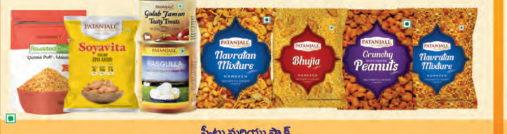
స్వీట్లు మరియు సాక్స్