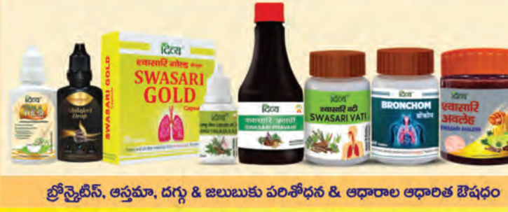
బ్రోన్కైటిస్, ఆస్తమా, దగ్గు & జలుబుకు పరిశోధన & ఆధారాల ఆధారిత ఔషధం