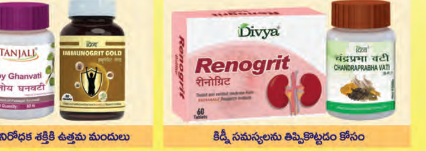
రోగనిరోధక శక్తికి ఉత్తమ మండులు కిడ్నీ సమస్యలను తిప్పికొట్టడం కోసం