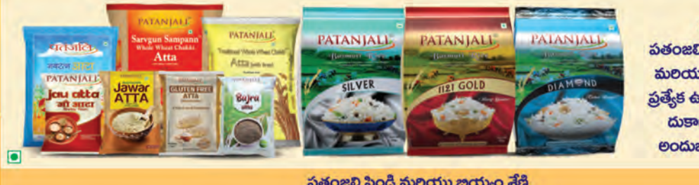
పతంజలి పెండి మరియు జియం శ్రేణి