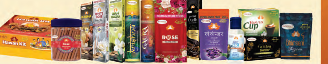
మీరు ఎంచుకున్న దేవుడిని ప్రార్థించడంలో మీకు సహాయపడడానికి 100% స్వచ్ఛమైన వెదురు లేని అగర్ బేస్, భీమ్సేని కర్పూరం, స్వచ్ఛమైన సువ్వల సూనె మరియు హవాన్ సమగ్రి.