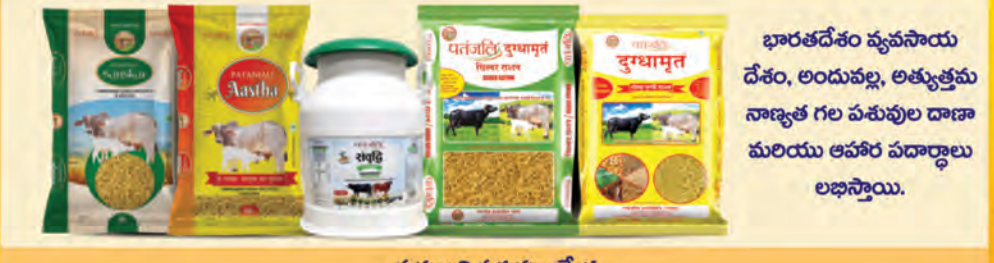
పతంజలి పశువుల మేత

పతంజలి ఉత్పత్తులు దాదాపు 1 కోటి దుకాణాల్లో అందుబాటులో ఉన్నాయి. అయితే, ఏదైనా ఉత్పత్తి దుకాణంలో అందుబాటులో లేకపోతే, దయచేసి దుకాణదారుడితో డిమాండ్ చేసినట్లయితే అతను దాని లభ్యతను నిర్ధారిస్తాడు.