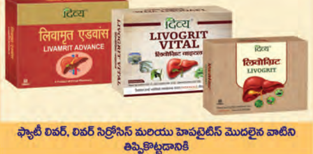
ఫ్యాటీ లివర్, లివర్ సిస్ట్రోసిస్ మరియు హెపటైటిస్ మొదలైన వాటిని తిప్పికొట్టడానికి