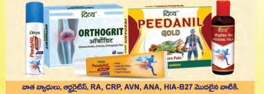
వాత వ్యాధులు, ఆర్థరైటిస్, RA, CRP, AVN, ANA, HIA-B27 మొదలైన వాటికి.