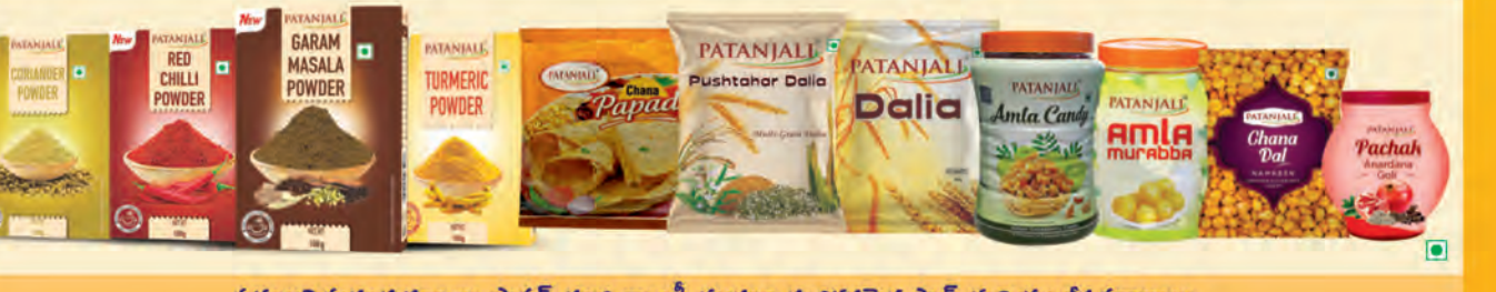
పతంజలి సుగంధ ద్రవ్యాలు, పాపిడ్, గంజ, క్యాండ్, మురబ్బా, రుచికరమైన సాక్స్ మరియు జీర్ణ పదార్థాలు