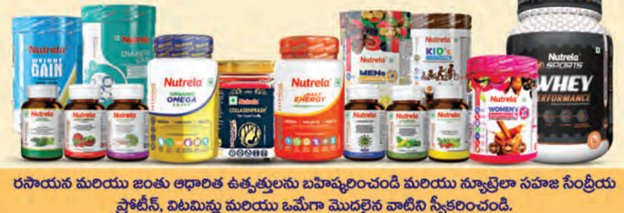
రసాయన మరియు జంతు ఆధారిత ఉత్పత్తులను బహిష్కరించండి మరియు స్వాభావిక సహజ సేంద్రీయ ప్రోటీన్, విటమిన్లు మరియు ఒమేగా మొదలైన వాటిని స్వీకరించండి.