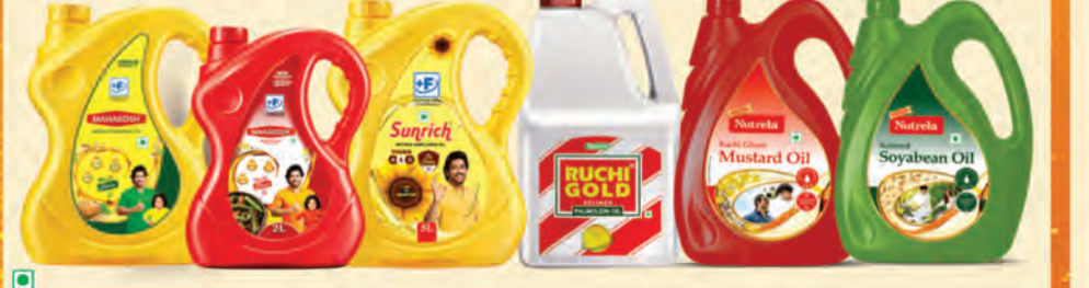
మహాకోప, సనోలచ్, మరియు దేశంలో నంబర్ 1 పామ్ ఆయిల్ బ్రాండ్, రుచి గోల్డ్, అలాగే స్వాభావిక శ్రేణి సూనెలు.