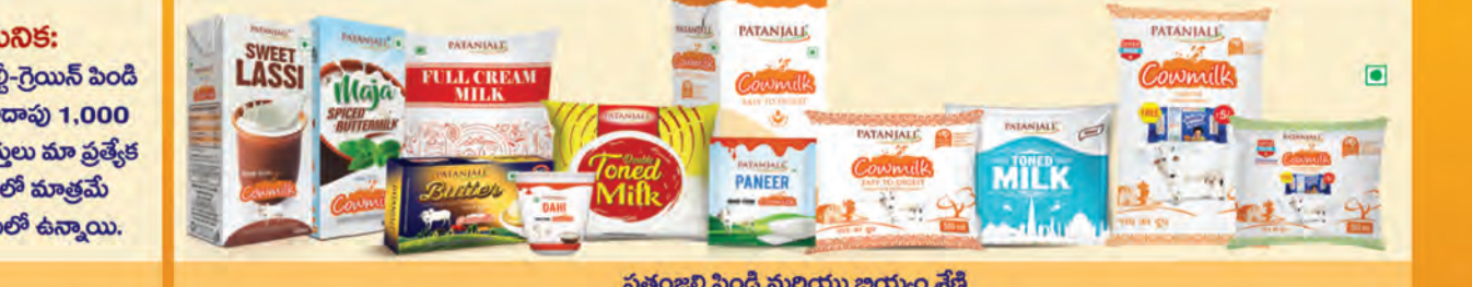
పతంజలి పెండి మరియు జియం శ్రేణి