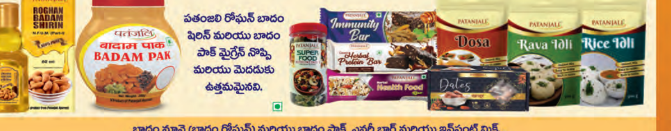
బాదం సూనె (బాదం రోఫుస్) మరియు బాదం పాక్, ఎనర్జీ బార్ మరియు ఇన్ స్పెంట్ మిక్స్