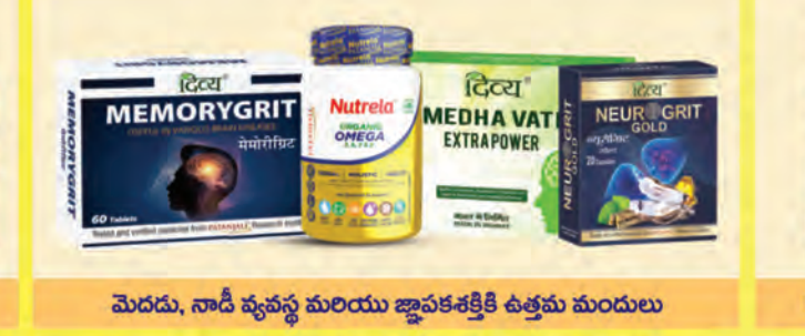
మెదడు, నాడీ వ్యవస్థ మరియు జ్ఞాపకశక్తికి ఉత్తమ మండులు