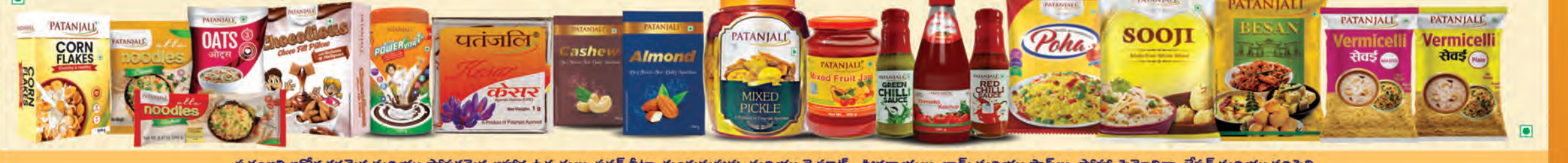
పతంజలి ఆరోగ్యకరమైన మరియు పోషకమైన ఆహార ఉత్పత్తులు, పవర్ బీటా, కుంకుమపువ్వు మరియు డ్రై ఫ్రూట్స్, తీరగాయలు, జామ్ మరియు సాస్లు, పోపా, సెమోలినా, బేసన్ మరియు వర్మిచెల్లీ.