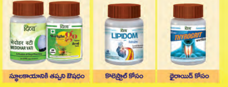
స్థూలకాయానికి తప్పని ఔషధం కొలెస్ట్రాల్ కోసం థైరాయిడ్ కోసం

వైద్య సంప్రదింపుల కోసం సమీపంలోని పతంజలి చికిత్సాలయం సంప్రదించండి. 5,000 పతంజలి ఎక్స్ క్లూజివ్ స్టోర్లను కనుగొనడానికి Googleలో శోధించండి. మీ ఇంటి నుండి 1800 296 1111 కు కాల్ చేసి మీ సమస్యలన్నింటినీ ఉచితంగా పరిష్కరించుకోండి. పతంజలి సేవల గురించి తెలుసుకోవడానికి 8954 555 999 కు కాల్ చేయండి. పతంజలి ఉత్పత్తుల కోసం ఆన్ లైన్ ఆర్డర్ చేయడానికి, OrderMe యాప్ ను డౌన్ లోడ్ చేసుకోండి.