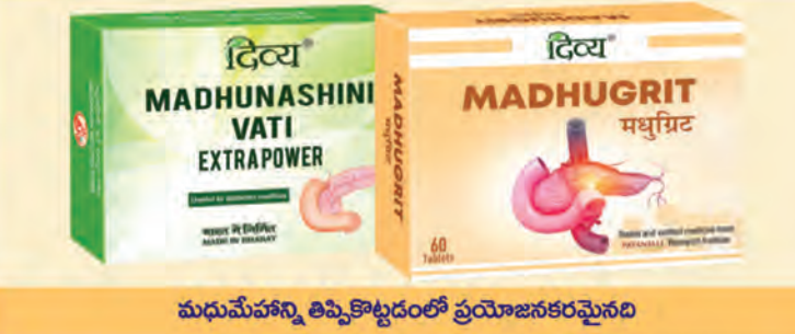
మధుమహేన్ని తిప్పికొట్టడంలో ప్రయోజనకరమైనది