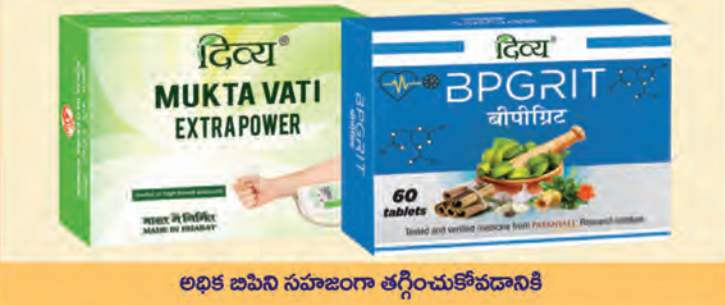
అధిక బిపిని సహజంగా తగ్గించుకోవడానికి

దాతృత్వానికి శ్రేయస్సు: పతంజలి గ్రూప్ సంపాదించే లాభాలన్నీ విద్య, ఔషధాల అభివృద్ధి, చెట్ల పెంపకం, సనాతన ధర్మ ప్రచారం మరియు భారతమాత సేవలో నిమగ్నమై ఉన్న పతంజలి గురుకులం, భారతీయ శిక్షా బోర్డు, ఆచార్యకులం, పతంజలి విశ్వవిద్యాలయం మరియు పరిశోధనా ఫౌండేషన్ కు అంకితం చేయబడ్డాయి. ఈ విధంగా లాభాలలో 100% నిస్వార్థ దాతృత్వం మరియు జాతీయ సేవలో పెట్టుబడి పెట్టబడతాయి. ఆరోగ్యకరమైన, సంపన్నమైన మరియు ఉజ్వలమైన భారతదేశాన్ని సృష్టించడానికి తన చివరి శ్వాస వరకు స్వచ్ఛ మరియు సమగ్రతతో భారతమాతకు సేవ చేస్తూనే ఉంటానని పూజ్య స్వామి రామ్ దేవ్ జీ ప్రతిజ్ఞ చేశారు. చాలా సంవత్సరాలుగా, పూజ్య ఆచార్య బాలకృష్ణ జీ ప్రపంచంలోని అగ్రశ్రేణి 2% శాస్త్రవేత్తలు మరియు పరిశోధకులలో ఒకరిగా ఉన్నారు. ఆయన దార్శనికత పతంజలిని సైన్స్, పరిశోధన మరియు స్వదేశీ ఆవిష్కరణల ద్వారా ప్రపంచ పటంలో ప్రముఖ బ్రాండ్ గా ఎదగడానికి దారితీసింది. నేడు, పతంజలి యోగా, ఆయుర్వేదం, స్వదేశీ మరియు సనాతన ధర్మాలకు సేవలందిస్తున్న భారతదేశంలోని ప్రముఖ సంస్థ.