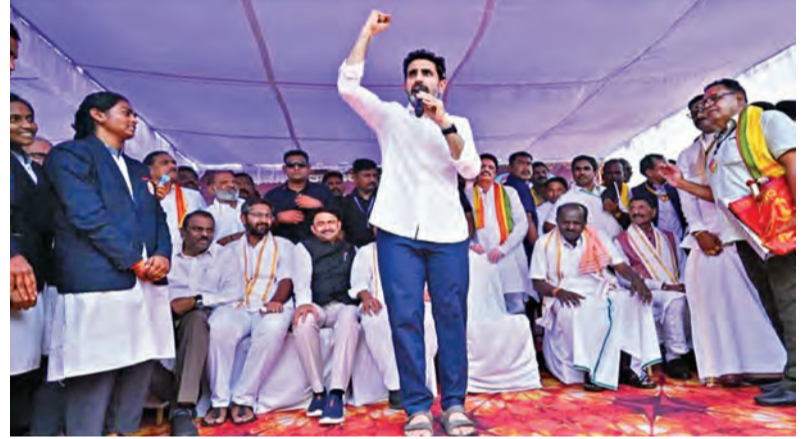
శనివారం కర్ణాటక నింధనూరులో సైనిక స్మారక ప్రారంభ సభలో మాట్లాడుతున్న మంత్రి లోకేశ్

స్వామి. దానికి మేం రుణపడి ఉన్నాం కర్ణాటకలోని రాయచూర్ జిల్లా నింధనూరులో ఆయన పర్యటించారు. ఈ సందర్భంగా తన తండ్రి అరెస్టు నాటి జ్ఞాపకాలను నెమరువేసుకున్నారు. సమాజంలో సైనిక విలువల ఆపవృత్త గురించి ఆసక్తికర వ్యాఖ్యలు చేశారు. మంత్రి నారా లోకేశ్ ఉదయం కర్ణాటకలోని నింధనూరుకు చేరుకున్నారు. స్థానిక తెలుగు యువత ఆయనకు ఘన స్వాగతం పలికింది. భారీ గజమాలతో లోకేశ్ ను సత్కరించారు. యువగళం జెండాలు చేతబాని జై లోకేశ్ అంటూ నినాదాలు చేశారు. నింధనూరులోని ఎంజీ సర్కిల్ నుంచి గంగావతి రోడ్డు వరకు భారీ షేక్ రాల్సి నిర్వహించారు. ఈ రాల్సిలో కేంద్ర మంత్రులు హెచ్.డి కుమారస్వామి, సంజయ్ సేథ్ పాల్గొన్నారు. ఉత్సాహంగా సాగిన ఈ రాల్సిలో ప్రజలందరికీ అభినందన చెప్పి లోకేశ్, కేంద్ర మంత్రులు ముందుకు సాగారు. రాల్సి అనంతరం హోస్పిట్ల క్యాంప్ గంగావతి రోడ్డులోని కర్పూరి కర్పూరి మండలం వద్దకు చేరుకున్నారు. అక్కడ సర్కిల్ ఎన్టీఆర్ క్యాంప్ విగ్రహాన్ని కేంద్ర మం