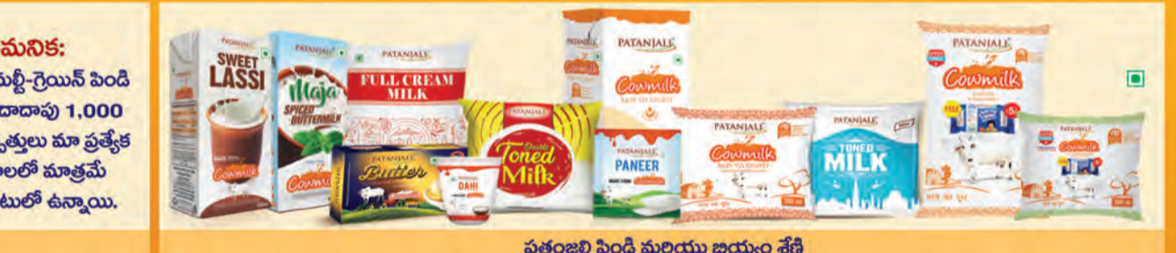
పతంజలి పెండి మరియు జియ్యం శ్రేణి