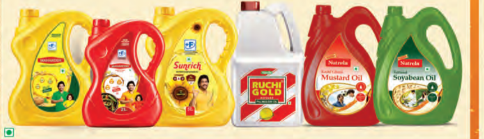
మహాకోష్ఠ్, సన్ రిచ్, మరియు దేశంలో నంబర్ 1 పామ్ ఆయిల్ బ్రాండ్, రుచి గోల్డ్, అలాగే స్వచ్ఛతల శ్రేణి నూనెలు.