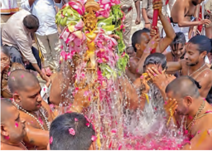
కనుల పండువగా జరుగుతున్న చక్రస్నానం