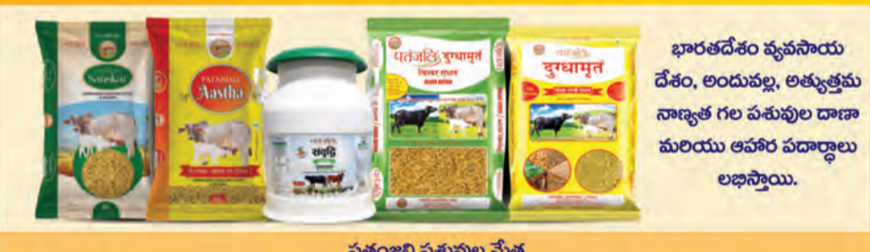
పతంజలి పశువుల మేత

పతంజలి ఉత్పత్తులు దాదాపు 1 కోటి దుకాణాల్లో అందుబాటులో ఉన్నాయి. అయితే, ఏదైనా ఉత్పత్తి దుకాణంలో అందుబాటులో లేకపోతే, దయచేసి దుకాణదారుడితో డిమాండ్ చేసినట్లయితే అతను దాని లభ్యతను నిర్ధారిస్తాడు.