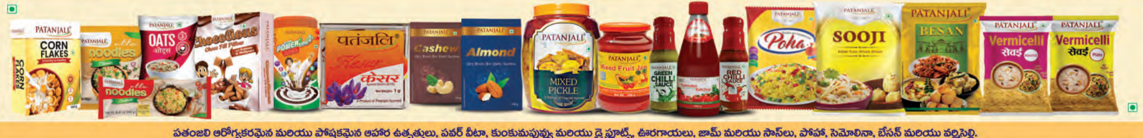
పతంజలి ఆరోగ్యకరమైన మరియు పోషకమైన ఆహార ఉత్పత్తులు, పవర్ బీటా, కుంకుమపువ్వు మరియు డ్రై ఫ్రూట్స్, ఊరగాయలు, జామ్ మరియు సాసలు, పోహా, సెమోలినా, బేసన్ మరియు వల్సెల్లి.