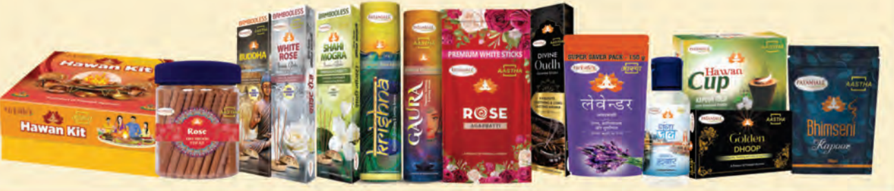
మీరు ఎంచుకున్న దేవుడిని ప్రార్థించడంలో మీకు సహాయపడటానికి 100% స్వచ్ఛమైన వెదురు లేని అగ్రశ్రేణి, భీమ్సేని కర్పూరం, స్వచ్ఛమైన సువ్వుల నూనె మరియు హవాన్ సమగ్ర.