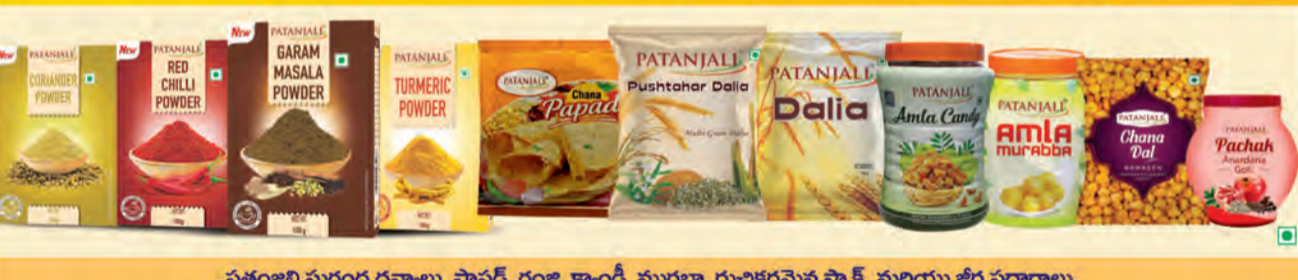
పతంజలి సుగంధ ద్రవ్యాలు, పావడ్, గంజి, క్యాండ్, మురబ్జా, రుచికరమైన స్నాక్స్ మరియు జిడ్ల పదార్థాలు