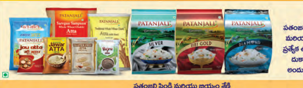
పతంజలి పెండి మరియు జియ్యం శ్రేణి