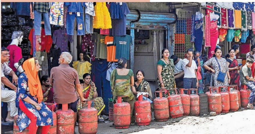
ముంబయిలోని ఓ గ్యాస్ ఏజెన్సీ కేంద్రం వద్ద బుద్ధవారం ఖాళీ నిలిచడంతో క్యూలో ఉన్న ప్రజలు