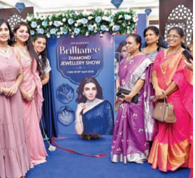
జ్యువెలరీ షో పంజాగుట్ట షోరూమ్లో మాత్రమే ఈ నెల 19 వరకు నిర్వహించ బడుతుందని తెలిపారు. విలాసానికి, ప్రేమకు శాశ్వతమైన అందానికి బహుమతిగా నిలిచే ఈ అద్భుతమైన ప్రజల ప్రపంచాన్ని సందర్శించాలని అందరినీ అభ్యుదయం కోరుకుంటున్నామని తెలిపారు.