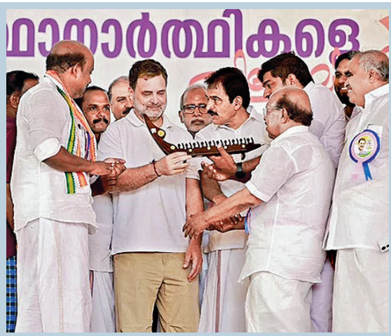
కేరళలోని అలప్పుజాలో శనివారం జరిగిన ఎన్నికల ప్రచార సభలో రాహుల్, కాంగ్రెస్ సీనియర్ నేత కెసి వేణుగోపాల్ తదితరులు