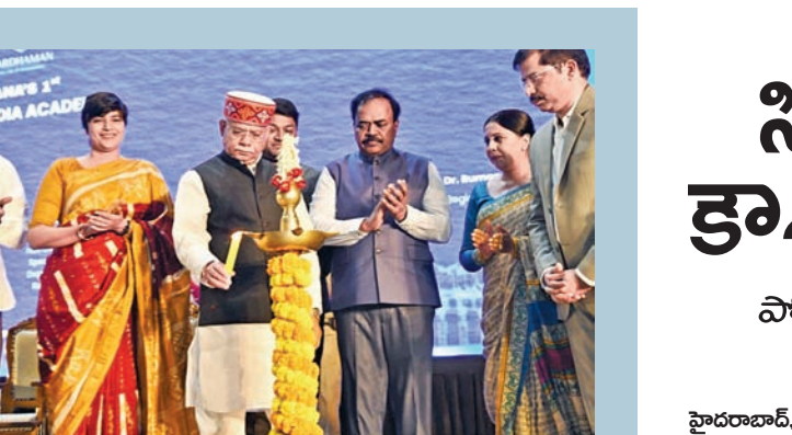
శనివారం హైదరాబాద్ లో ఎటిఆర్ సార్టి అండ్ మెంటర్ ఇండియా అకాడమీని ప్రారంభిస్తున్న గవర్నర్ శుక్లా

తెలంగాణలో అటల్ టింకరింగ్ ల్యాబ్లు పాఠశాల నుంచి స్టార్టప్ ల దిశగా అభివృద్ధి పుంజుకుంటున్నాయి