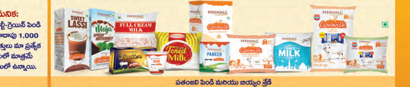
పతంజలి పెండి మరియు జయ్యం శ్రేణి