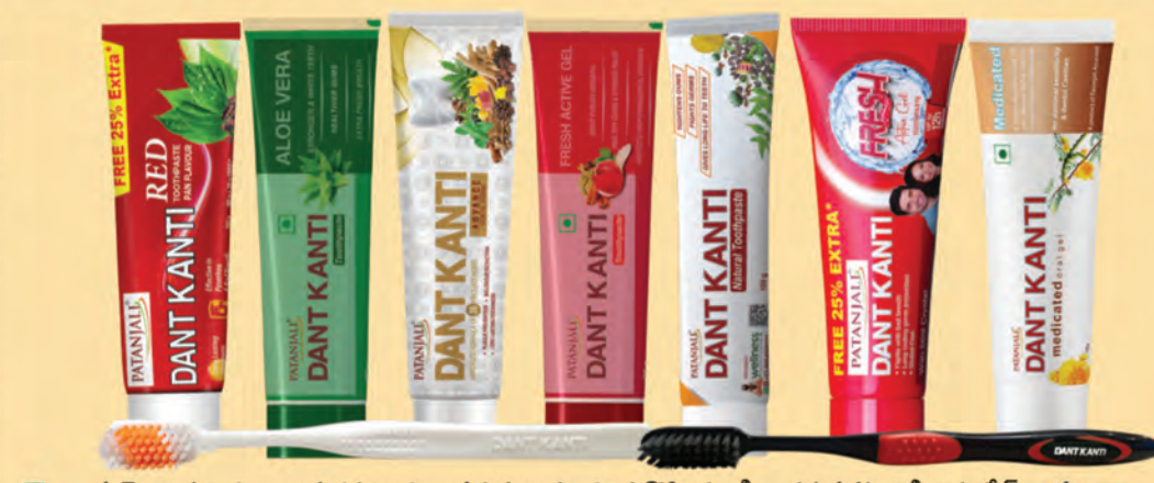
పయోరియా, దంతాల మరకలు, దుర్వాసన మరియు దంత నొప్పి నుండి బయటపడటానికి జాటాపేస్ట్ కాకుండా నిజమైన ట్రూత్ పేస్ట్ దంత కాంతిని సృష్టించండి.