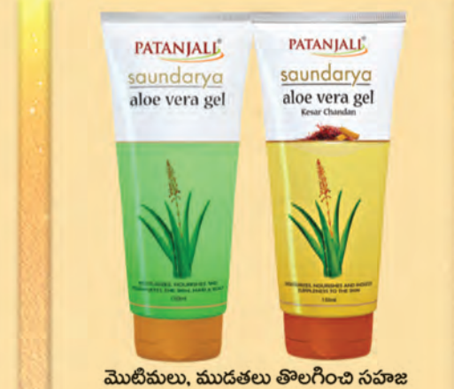
మొటిమలు, ముడతలు తొలగించి సహజ సౌందర్యాన్ని తిరిగి పొందడానికి పతంజలి అలోవెరా జెల్