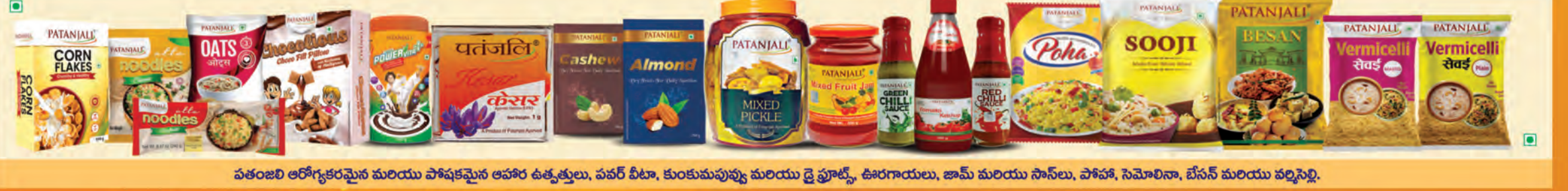
పతంజలి ఆరోగ్యకరమైన మరియు పోషకమైన ఆహార ఉత్పత్తులు, పవర్ బీటా, కుంకుమపువ్వు మరియు డ్రై ఫ్రూట్స్, తీరగారాలు, జామ్ మరియు సాస్లు, పోపా, సెమోలినా, బేసన్ మరియు వర్మిచెల్లీ.