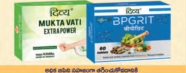
అధిక బిపిని సహజంగా తగ్గించుకోవడానికి

దాతృత్వానికి శ్రేయస్సు: పతంజలి గ్రూప్ సంపాదించే లాభాలన్నీ విద్య, ఔషధాల అభివృద్ధి, చెట్ల పెంపకం, సనాతన ధర్మ ప్రచారం మరియు భారతమాత సేవలో నిమగ్నమై ఉన్న పతంజలి గురుకులం, భారతీయ శిక్షా బోర్డు, ఆచార్యకులం, పతంజలి విశ్వవిద్యాలయం మరియు పరిశోధనా ఫౌండేషన్ కు అంకితం చేయబడ్డాయి. ఈ విధంగా లాభాలలో 100% నిస్వార్థ దాతృత్వం మరియు జాతీయ సేవలో పెట్టుబడి పెట్టబడతాయి. ఆరోగ్యకరమైన, సంపన్నమైన మరియు ఉజ్వలమైన భారతదేశాన్ని సృష్టించడానికి తన చివరి శ్వాస వరకు స్వచ్ఛ మరియు సమగ్రతతో భారతమాతకు సేవ చేస్తూనే ఉంటానని పూజ్య స్వామి రామ్ దేవ్ జీ ప్రతిజ్ఞ చేశారు. చాలా సంవత్సరాలుగా, పూజ్య ఆచార్య బాలకృష్ణ జీ ప్రపంచంలోని అగ్రశ్రేణి 2% శాస్త్రవేత్తలు మరియు పరిశోధకులలో ఒకరిగా ఉన్నారు. ఆయన ద్వారా నికత పతంజలిని సైన్స్, పరిశోధన మరియు స్వదేశీ ఆవిష్కరణల ద్వారా ప్రపంచ పటంలో ప్రముఖ బ్రాండ్ గా ఎదగడానికి దారితీసింది. నేడు, పతంజలి యోగా, ఆయుర్వేదం, స్వదేశీ మరియు సనాతన ధర్మాలకు సేవలందిస్తున్న భారతదేశంలోని ప్రముఖ సంస్థ.