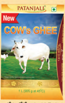
దేశంలోనే అత్యుత్తమమైన పతంజలి ఆవు దేశీ నెయ్యి

పతంజలిలో వైద్యం మరియు దాతృత్వ స్ఫూర్తితో పనిచేస్తూ, మేము దేశాన్ని మా కుటుంబంగా చూస్తాము మరియు లాభాలను ఆర్జించడానికి బదులుగా ప్రజల సంక్షేమం కోసం ఉత్పత్తులను సృష్టిస్తాము. మేము మా లాభాలలో 100% దాతృత్వంలో పెట్టుబడి పెడతాము. 'దార్శికతకు శ్రేయస్సు' అనే నినాదంతో ఉన్న సంస్థగా, జది దేశం యొక్క ఆత్మగౌరవానికి ప్రతిరూపంగా ఉద్భవించింది. విద్య, వైద్యం, ఆర్థిక వ్యవస్థ, భావజాల రంగాలలో బానిస మనస్తత్వం నుండి విముక్తి పొంది, దానిని ఆరోగ్యకరమైన, సంపన్నమైన మరియు ఉజ్వలమైన భారతదేశంగా మార్చాలనే ఉద్దేశ్యంతో మేము భారతమాత సేవలో కోట్లాది రూపాయలను పెట్టుబడి పెట్టాము.