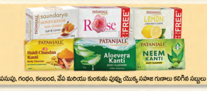
పసుపు, గంధం, కలబంద, వేప మరియు కుంకుమ పువ్వు యొక్క సహజ గుణాలు కలిగిన సబ్బులు