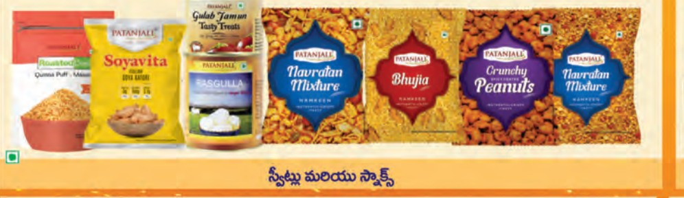
స్వీట్లు మరియు సాక్స్