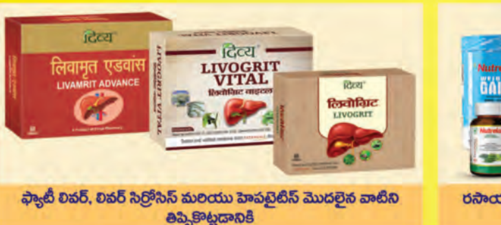
ఫ్యాటీ లివర్, లివర్ సిస్ట్రోసిస్ మరియు హెపటైటిస్ మొదలైన వాటిని తిప్పికొట్టడానికి