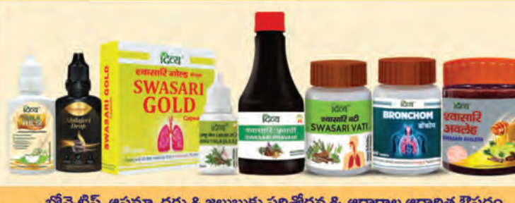
బ్రోన్చైటిస్, ఆస్తమా, దగ్గు & జలుబుకు పరిశోధన & ఆధారాల ఆధారిత ఔషధం