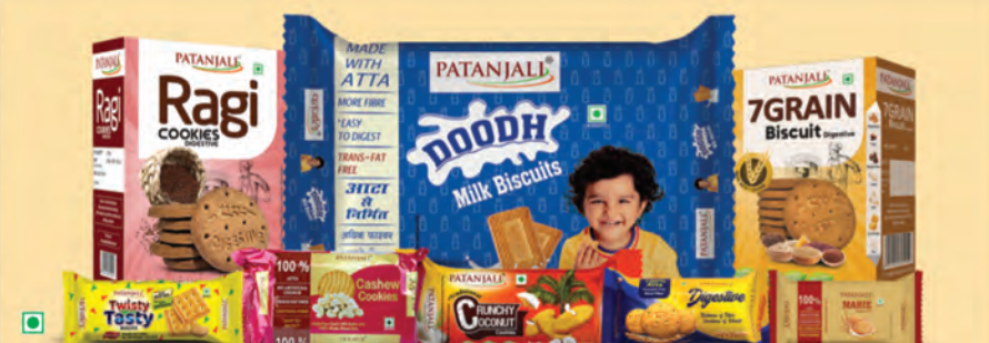
పతంజలి బిస్కెట్లు: 0% మైదా, 0% కొరిన్డైల్, పోషకాలతో నిండి ఉంటుంది.