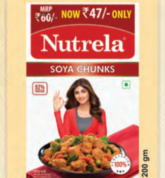
52% ప్రోటీన్ తో స్మూత్రిలా సోయా చంక్స్