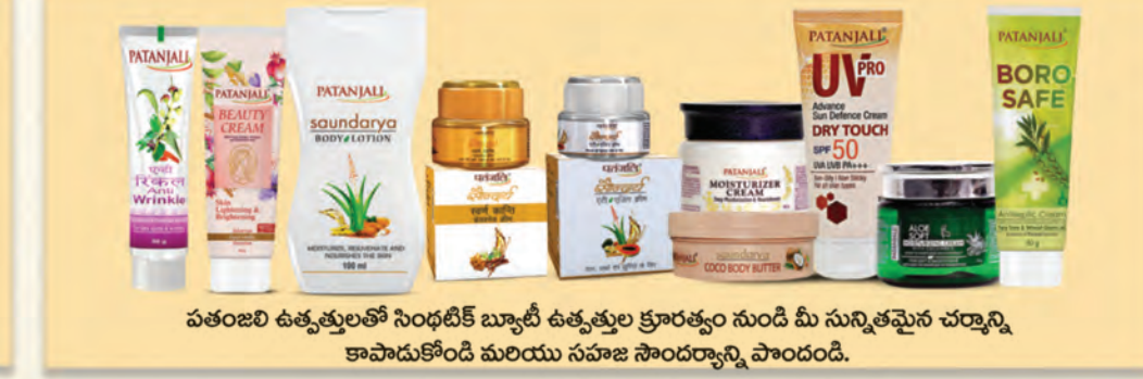
పతంజలి ఉత్పత్తులతో సింథటిక్ బ్యూటీ ఉత్పత్తుల క్రూరత్వం నుండి మీ సున్నితమైన చర్మాన్ని కాపాడుకోండి మరియు సహజ సౌందర్యాన్ని పొందండి.