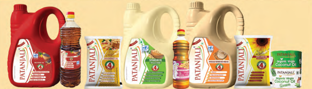
హానికరమైన శుద్ధి చేసిన నూనెలను పక్కనపెట్టి, మీ కుటుంబాన్ని కల్గి అనే విషం నుండి కాపాడటానికి ఉత్తమమైన పతంజలి కర్ణి ఘన ఆవాల నూనె మరియు పతంజలి భౌతికంగా శుద్ధి చేసిన నూనెను ఇంటికి తీసుకురండి.