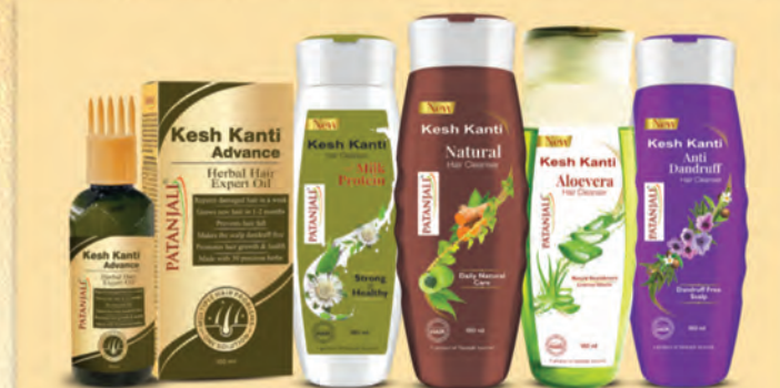
జుట్టు రాలడం, విరిగిపోవడం మరియు అకాల బూడిద రంగును ఆపడానికి పతంజలి కేశ్ కాంతి లిఫ్టాన్స్ హెయిర్ ఆయిల్ మరియు షాంపూల శ్రేణి.