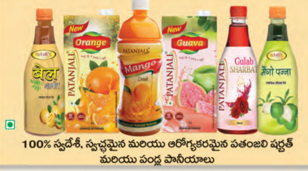
100% స్వచ్ఛమైన మరియు ఆరోగ్యకరమైన పతంజలి షర్బత్ మరియు పండ్ల పానీయాలు