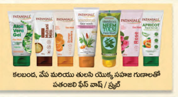
కలబంద, వేప మరియు తులసి యొక్క సహజ గుణాలతో పతంజలి ఫేస్ వాష్ / ప్రైవ్