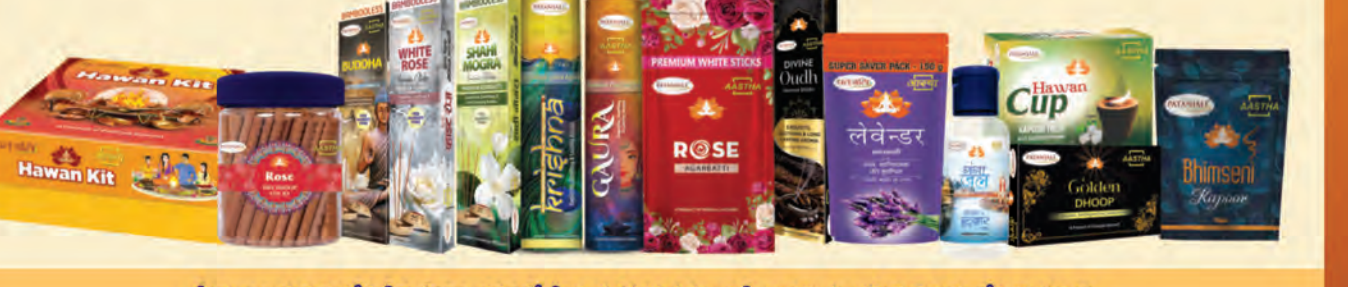
మీరు ఎంచుకున్న దేవుడిని ప్రార్థించడంలో మీకు సహాయపడడానికి 100% స్వచ్ఛమైన వెదురు లేని అగర్ బేస్, భోమ్మని కర్పూరం, స్వచ్ఛమైన సువ్వుల సూనె మరియు హవాన్ సమగ్ర.