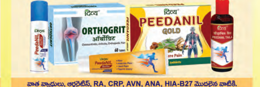
వాత వ్యాధులు, ఆర్థరైటిస్, RA, CRP, AVN, ANA, HIA-B27 మొదలైన వాటికి.