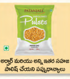
అర్బార్డ్ మరియు అన్ని ఇతర సహజ పాలిష్ చేయని పప్పుధాన్యాలు