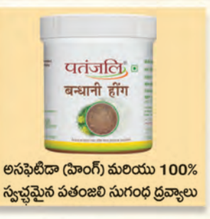
అసఫీడిడా (హాంగ్) మరియు 100% స్వచ్ఛమైన పతంజలి సుగంధ ద్రవ్యాలు