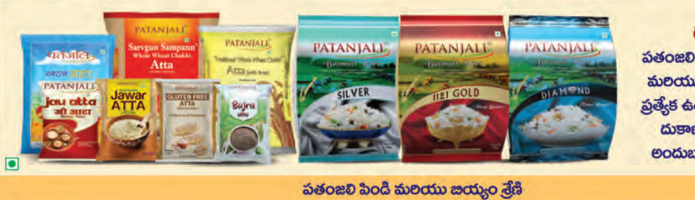
పతంజలి పెండి మరియు జయ్యం శ్రేణి