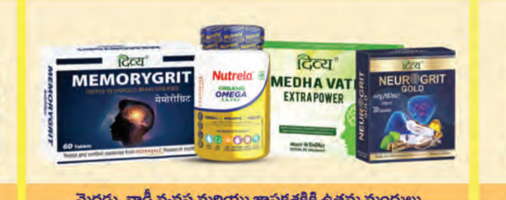
మెదడు, నాడీ వ్యవస్థ మరియు జ్ఞాపకశక్తికి ఉత్తమ మండులు