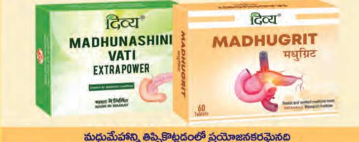
మధుమేహాన్ని తిప్పికొట్టడంలో ప్రయోజనకరమైనది