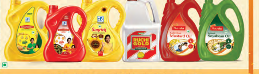
మహాకోవ్, సనోలచ్, మరియు దేశంలో నంబర్ 1 పామ్ ఆయిల్ బ్రాండ్, రుచి గోల్డ్, అలాగే స్వచ్ఛమైన శ్రేణి సూనెలు.