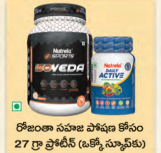
రోజంతా సహజ పోషక కోసం 27 గ్రా ప్రోటీన్ (ఒక్కో స్కూప్ కు)