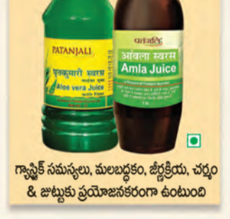
గ్నాష్టిక్ సమస్యలు, మలబద్ధం, త్వక్తియ, చర్మం & జుట్టుకు ప్రయోజనకరంగా ఉంటుంది