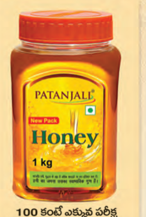
100 కంటే ఎక్కువ పరీక్ష పారామిటర్లను దాటిన ఉత్తమ పతంజలి తేనె