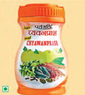
500 కంటే ఎక్కువ ఔషధ మూలకాలతో పతంజలి చ్యవన్ ప్రాష్