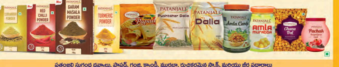
పతంజలి సుగంధ ద్రవ్యాలు, పాపిడ్, గంజ, క్యాండ్, మురబ్బా, రుచికరమైన సాక్స్ మరియు జీర్ణ పదార్థాలు