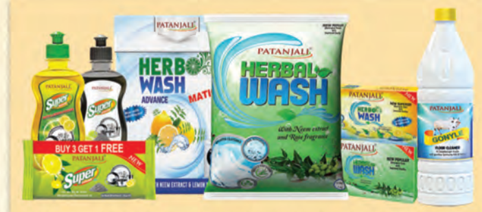
బూడిద మరియు నిమ్మకాయల శక్తితో పతంజలి డిష్ వాష్, వేప లక్షణాలతో పతంజలి డిటర్జెంట్. పవిత్రమైన గోమూత్రంతో తయారు చేయబడిన గోనైట్ ప్లస్ క్లీనర్.