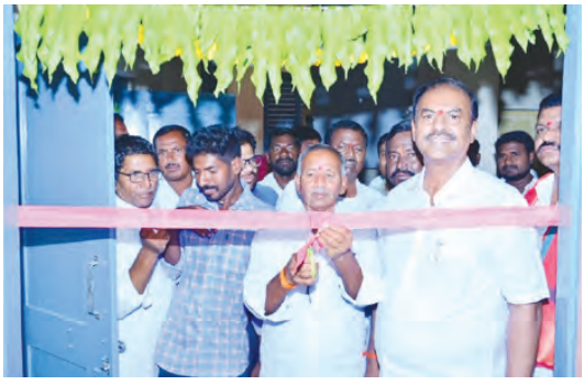
కార్యాలయాన్ని ప్రారంభిస్తున్న ఎమ్మెల్యే గ్రామ సర్పంచ్

ధరూర్ ఏప్రిల్ 4, ప్రభాతవార్త : ధరూర్ మండల పరిధిలోని నాగర్ డోడ్డి ఆర్ అండ్ ఆర్ సెంటర్ గ్రామంలో నూతన గ్రామపంచాయతీ కార్యాలయంలో ప్రారంభోత్సవానికి ముఖ్యఅతిథిగా ఎమ్మెల్యే బండ్ల కృష్ణమోహన్ రెడ్డి హాజరయ్యారు. 30 లక్షల వ్యయంతో నిర్మాణమైన నూతన గ్రామపంచాయతీ భవనమును ఎమ్మెల్యే రిబ్బన్ కటింగ్ చేసి ప్రారంభించడం జరిగింది. ఎమ్మెల్యేకి గ్రామ సర్పంచ్ శాలువా కప్పి పుష్పగుచ్ఛం ఇచ్చి ఘనంగా సత్కరించారు. గ్రామ సర్పంచ్ నూతన పంచాయతీ కార్యాలయంలో ఎమ్మెల్యే శాలువా కప్పి ఘనంగా సత్కరించి హాగ్రిక శుభాకాంక్షలు తెలిపారు. ఎమ్మెల్యే మాట్లాడుతూ నాగర్ డోడ్డి గ్రామం ఆర్ అండ్ ఆర్ సెంటర్ నూతన గ్రామపంచాయతీ నిర్మాణం చేసినందుకు గ్రామ సర్పంచ్ కు హాగ్రిక శుభాకాంక్షలు ప్రతి గ్రామంలో గ్రామ పంచాయతీ కార్యాలయం తప్పనిసరిగా ఉండాలి. గ్రామంలోని ప్రజల అందరూ తమ సమస్యలను పరిష్కరించడానికి సర్పంచ్ కలవడానికి పంచాయతీ కార్యాలయం ఉండాలి అని తెలిపారు. గ్రామపంచాయతీ కార్యాలయం ఉండడం వల్ల నీ సమస్యల పైన సర్పంచ్ నేతృత్వంలో గ్రామ వార్డు నెంబర్ల ప్రజలు కలిసి సమస్యలను పరిష్కరించడానికి ఒక వేదికగా గ్రామపంచాయతీ కార్యాలయం ఉంటుంది తెలిపారు. గ్రామంలో ప్రజలకు ఎల్లప్పుడూ అందుబాటులో ఉంటూ గ్రామంలోని సమస్యలను పరిష్కరిస్తూ గ్రామ అభివృద్ధికి ప్రజలందరూ కలిసికట్టుగా సమిష్టిగా కృషి చేయాలి అప్పుడే గ్రామం