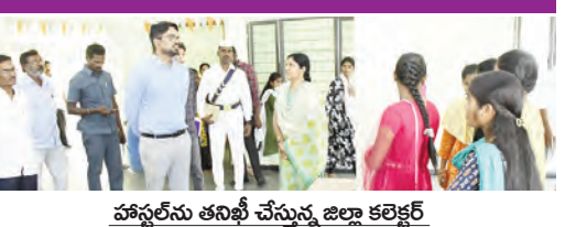
హాస్టల్ ను తనిఖీ చేస్తున్న జిల్లా కలెక్టర్