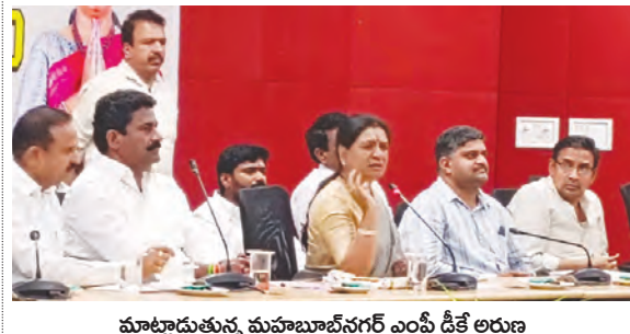
మాట్లాడుతున్న మహబూబ్ నగర్ ఎంపీ డీకే అరుణ

నగర్ పెద్దగా భౌతిక సంపదలు లేకపోయినా, పిల్లల తెలివితేటలే అసలు సంపద అని పేర్కొంటూ, ప్రతి ఇంట్లో ఒక కోటాసూర వజ్రం ఉందని, ఆ ప్రతిభకు సాన పెట్టే అర్హులైన సాధ్యమని తెలిపారు. విద్యార్థుల్లో జీవితంలో 8వ తరగతి నుండి ఇంటర్మీడియట్ వరకు ఉన్న విద్య సంపత్తులు అత్యంత కీలకమని, ఈ దశలో క్రమశిక్షణ, మాధ్యమిక కల్పన వారు అద్భుత ఫలితాలు సాధిస్తారని వివరించారు. మహబూబ్ నగర్ ఫస్ట్ ఏర్పాటు చేసిన క్యాంపు ద్వారా విద్యార్థుల్లో క్రమశిక్షణ, పోటీ భావన, అభివృద్ధి సంపాదించుకున్నారని తెలిపారు. ప్రభుత్వ పాఠశాలల్లోనే నాణ్యమైన విద్య అందించేందుకు అన్ని చర్యలు తీసుకుంటున్నామని, ప్రైవేట్ పాఠశాలపై ఆధారపడమని - మగతా2లో..