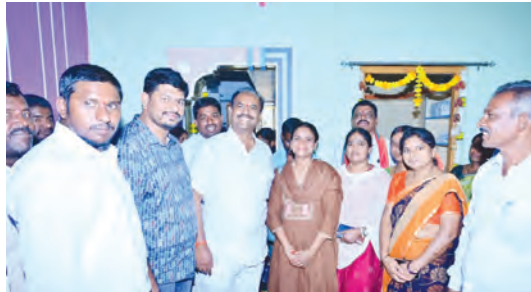
ఎమ్మెల్యేకి ఇందిరమ్మ ఇల్లు నిర్మాణం శాలువా కప్పి సత్కరించిన దృశ్యం