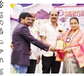
భూత్పూర్, ఏప్రిల్ 4, ప్రభాతవార్త: