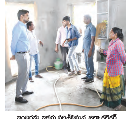
ఇందిరమ్మ ఇళ్లను పరిశీలించిన జిల్లా కలెక్టర్