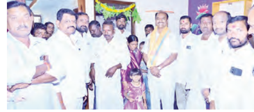
కెటిడోడ్డిలో ఇందిరమ్మ జిల్లాను ప్రారంభించు ఎమ్మెల్యే

వర్గం చేశారు. ప్రజా పాలనలో భాగంగా గద్వాల నియోజకవర్గంలో కెటిడోడ్డి మండల పరిధిలోని కె.టి.డోడ్డి, పాతపాఠశాల, గ్రామంలో మొట్టమొదటి ఇందిరమ్మ జిల్లా మంజూరు కావడం జరిగింది. నేడు జిల్లా పూర్తి నిర్మాణం చేసుకోని ప్రారంభించుకోవడం జరిగింది. తెలంగాణ రాష్ట్ర ప్రభుత్వం నిరు పేద ప్రజల ప్రజలకు ఇందిరమ్మ జిల్లాను మంజూరు చేయించి వారికి విడతల వారీగా వారి భాతాలు దబ్బులను ఐదు లక్షల రూపాయలను సమాను చేయడం జరిగింది. వాటికి తోడుగా లబ్ధిదారులు మరలొక డబ్బులను తో ఇంటిని అన్ని వసతులలో ఏర్పాటు చేసుకోవడం జరిగింది. గద్వాల నియోజకవర్గంలో మొదటి విడత లో 3,500 ఇందిరమ్మ జిల్లా మంజూరు కావడం జరిగింది. దాదాపుగా 1500 పైగా ఇండ్లు నిర్మాణం పనులు కొనసాగుతున్నాయి. త్వరగా ఇంటి నిర్మాణం పనులు పూర్తి చేసుకోని గృహ