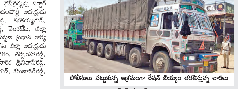
పోలీసులు పట్టుకున్న అక్రమంగా రేవంత్ బయ్యం తరలిస్తున్న లారీలు

పుల్వే, ఏప్రిల్ 4, ప్రభాతవార్త: అక్రమంగా రేవంత్ బయ్యం తరలిస్తున్న మూడు లారీలను పుల్వేలో పోలీసులు పట్టుకున్నారు. ఈ నెల 2న రెండులారీలను పట్టుకొని శుక్రవారం మరోలారీని పట్టుకున్నారు. కర్ణాటక రాష్ట్రంలోని యాచిగిరి జిల్లా గురుమిట్టల్ నుంచి జెజె 25యూ9759, జెజె25డబ్ల్యూ4065 లారీల్లో 340 క్వింటాళ్ళ వాస్తు 680 క్వింటాళ్ళ రేవంత్ బయ్యం గుజరాత్ తరలిస్తుండగా తాడ్కానిట్టి టోల్ ప్లాజా వద్ద ఎవీసె నల్లా విజ్ఞానీ పట్టుకున్నారు. హైదరాబాద్ నుంచి గుజరాత్ కు 200 క్వింటాళ్ళ బయ్యంతో వెళుతున్న ఎఫ్3924479 లారీని సైతం ఎవీసె అదుపులోకి తీసుకున్నారు. స్వాధీనం చేసుకున్న 3లారీలను, అక్రమ రేవంత్ బయ్యం పౌరసరఫరాశాఖ అధికారులకు అప్పగించి కేసు నమోదుచేసి దర్యాప్తు చేస్తున్నట్లు ఎవీసె విజ్ఞానీ వివరించారు.