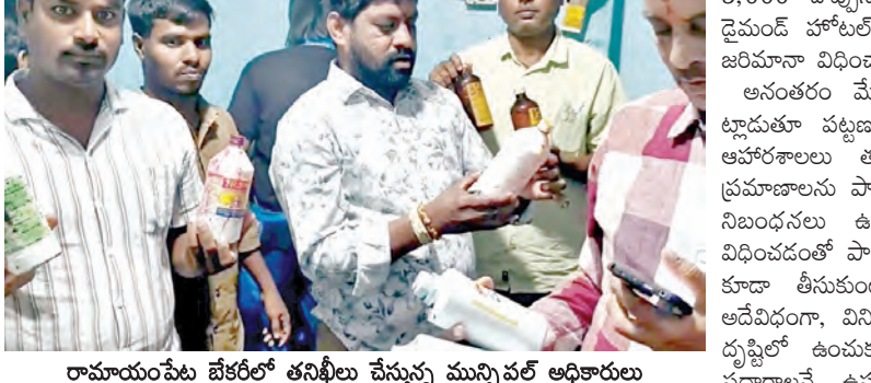
రామాయంపేట జేకరీలో తనిఖీలు చేస్తున్న మున్సిపల్ అధికారులు

-పరిశుభ్రతా లోపాలపై బిఆర్ ఎస్ నాయకులు -నాణ్యతలేని ఆహారంపై కేసులు హెచ్చరిక