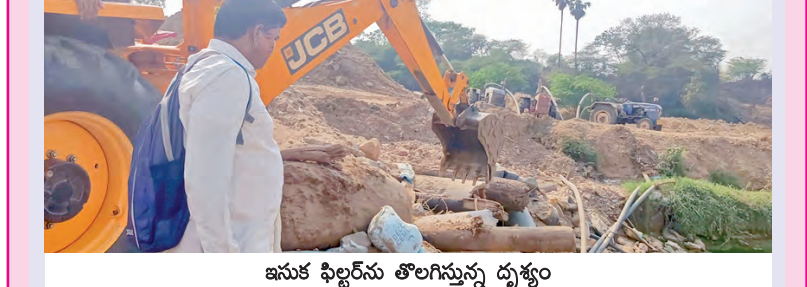
ఆసుక ఫిల్టర్లను తొలగిస్తున్న దృశ్యం