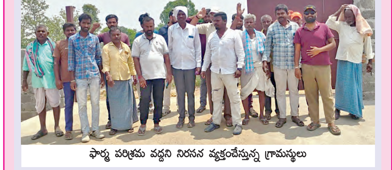
ఫార్మ పరిశ్రమ వద్దని నిరసన వ్యక్తం చేస్తున్న గ్రామస్థులు

మండలపరిషత్ విద్యార్థులకు కాలుష్య పరిశ్రమను ఏర్పాటుచేసే ఊరుకునేదిలేదని గ్రామస్థులు అగ్రహారం వ్యక్తంచేశారు. శనివారం మండలపరిషత్ కార్యాలయంలో విస్తృత పరిశ్రమను నిర్మించడానికి ప్రయత్నించడంతో గ్రామస్థులు అక్కడికివెళ్ళి నిరసన వ్యక్తంచేశారు. ఈ సందర్భంగా వారు మాట్లాడుతూ గ్రామపంచాయతీ అనుమతులులేకుండా పరిశ్రమను ఎలా నిర్మిస్తారని ప్రశ్నించారు. గతంలో కూడా పరిశ్రమ వద్దని తోటకూర మొక్కలు, పనులు ఆపివేసి ఇప్పుడు మళ్ళీ మొదలుపెట్టడం పట్ల అగ్రహారం వ్యక్తంచేశారు. ఆనంతరం తహసీల్దార్ మాతలికి వినతిపత్రం అందించారు. పరిశ్రమ ఏర్పాటుచేసే పెద్ద ఎత్తున అందోళనచేసేవారు హెచ్చరించారు.