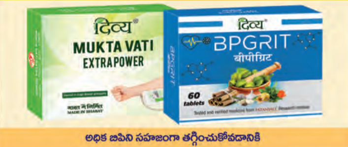
అధిక బిపిని సహజంగా తగ్గించుకోవడానికి

దాతృత్వానికి శ్రేయస్సు: పతంజలి గ్రూప్ సంపాదించే లాభాలన్నీ విద్య, ఔషధాల అభివృద్ధి, చెట్ల పెంపకం, సనాతన ధర్మ ప్రచారం మరియు భారతమాత సేవలో నిమగ్నమై ఉన్న పతంజలి గురుకులం, భారతీయ శిక్షణ బోర్డు, ఆచార్యులం, పతంజలి విశ్వవిద్యాలయం మరియు పరిశోధనా ఫౌండేషన్లకు అంకితం చేయబడ్డాయి. ఈ విధంగా లాభాలలో 100% నిస్వార్థ దాతృత్వం మరియు జాతీయ సేవలో పెట్టుబడి పెట్టబడతాయి. ఆరోగ్యకరమైన, సంపన్నమైన మరియు ఉజ్వలమైన భారతదేశాన్ని సృష్టించడానికి తన చివరి శ్వాస వరకు స్వచ్ఛత మరియు సమగ్రతతో భారతమాతకు సేవ చేస్తూనే ఉంటానని పూజ్య స్వామి రాందేవ్ జీ ప్రతిజ్ఞ చేశారు. చాలా సంవత్సరాలూ, పూజ్య ఆచార్య బాలకృష్ణ జీ ప్రపంచంలోని అగ్రశ్రేణి 2% శాస్త్రవేత్తలు మరియు పరిశోధకులలో ఒకరిగా ఉన్నారు. ఆయన దార్శనికత పతంజలిని సైన్స్, పరిశోధన మరియు స్వదేశీ ఆవిష్కరణల ద్వారా ప్రపంచ పటంలో ప్రముఖ బ్రాండ్ గా ఎదగడానికి దారితీసింది. నేడు, పతంజలి యోగా, ఆయుర్వేదం, స్వదేశీ మరియు సనాతన ధర్మాలకు సేవలందిస్తున్న భారతదేశంలోని ప్రముఖ సంస్థ.