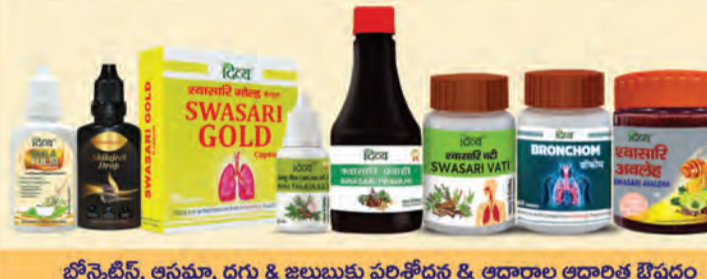
బ్రోన్కైటిస్, అస్తమా, దగ్గు & జలుబుకు పరిశోధన & ఆధారాల ఆధారిత ఔషధం