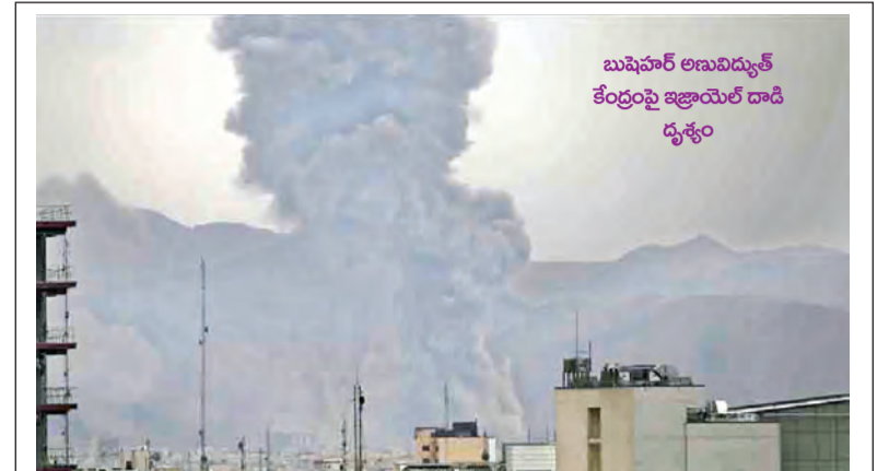
బుజుపాల్ లాబుద్వారా కేంద్రంపై ఇజ్రాయెల్ దాడి దృశ్యం

ఇబ్బందులు ఉన్నాయని కాంట్రాక్టర్లు సీఎం దృష్టికి తెచ్చారు. వివిధ రాష్ట్రాల్లో ఎన్నికల జరుగుతున్న దృష్ట్యా వాలా మంది కార్మికులు వెళ్లారని నిర్మాణ సంస్థ ప్రతినిధులు చెప్పారు. స్థానికంగా నైపుణ్యమున్న మ్యాన్ పవర్ ఎంత వరకు అందుబాటులో ఉంటుందో చూసి వినియో గించుకోవాలని సీఎం సూచించారు. రాజధాని పనుల్లో ఎంత మెషిన్లని వినియోగిస్తున్నారనే అంశం పై సీఎం ఆకా టీకారు. రాజధాని పనుల్లో 5,580 మెషిన్ల అవసరమండగా ప్రస్తుతం 3767 మెషిన్ల ఉందని అధికారులు వివరించారు. ఇవి కాకుండా హాట్ మిక్స్ 16, వెట్ మిక్స్ మెషిన్లు 36, ఆర్ఎంసీ మిషన్లు 34 ఉన్నాయని తెలిపారు. వారం, నెల వారీగా టార్గెట్లు పెట్టుకుని రాజధాని పనులు చేపట్టాలని సీఎం >>2