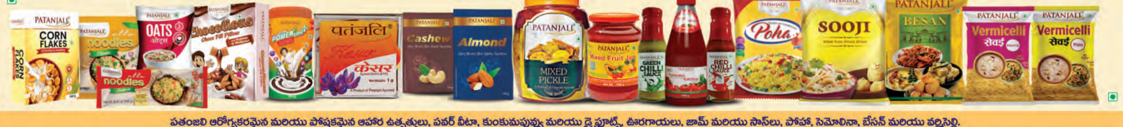
పతంజలి ఆరోగ్యకరమైన మరియు పోషకమైన ఆహార ఉత్పత్తులు, పవర్ బీటా, కుంకుమపువ్వు మరియు డై ఫ్రూట్స్, ఊరగాయలు, జామ్ మరియు సాసలు, పోహా, నెమోలినా, బేసన్ మరియు వల్సెల్లి.