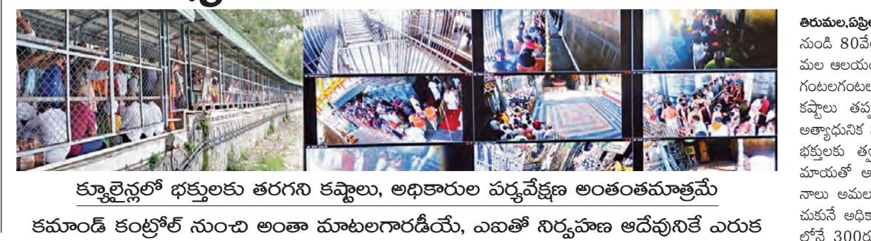
కర్నూలులో భక్తులకు తరగని కష్టాలు, అధికారుల పర్యవేక్షణ అంతంమాత్రమే కమాండ్ కంట్రోల్ నుంచి అంతా మాటలగారడీయే, ఎణితో నిర్వహణ ఆదేవునికే ఎరుక

తిరుమల, ఏప్రిల్ 4 ప్రభాతవార్త ప్రతినిధి: రోజుకు సరాసరి 70వేలమంది నుండి 80వేలమంది వరకు భక్తులకు మహాళభు విధానంలో తిరుమల అలయంలో టిడిడి అధికారులు శ్రీవారి దర్శనం చేయిస్తున్నా. గంటలంటులు క్యూలైన్లలో, వైకుంఠం కంపార్టుమెంట్లలో నిరీక్షణ కష్టాలు తప్పడం లేదనేది అధికారంతో మంది భక్తులు ఆవేదన. అత్యధునిక సాంకేతిక పరిజ్ఞానం వినియోగించి ఎంబ అమలుచేస్తూ భక్తులకు త్వరగా దర్శనం చేయిస్తున్నామని టిడిడి అధికారులు మాయతో అలంకరణలు చెప్పిస్తున్నారు. అయితే వాస్తవంగా దర్శనాలు అమలులో మాత్రం భక్తుల కష్టాలు విని పించుకునే, పట్టించుకునే అధికారి లేదనే ఆరోపణలు వస్తున్నాయి. సాధారణ రోజుల్లోనే 300రూపాయలు ఎన్ఇడి దర్శన టికెట్ కలిగిన >>2