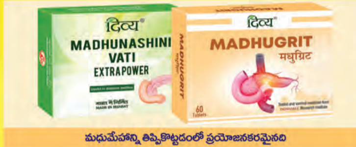
మధుమేహాన్ని తిప్పికొట్టడంలో ప్రయోజనకరమైనది