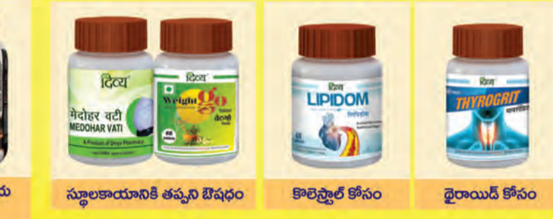
స్థూలకాయానికి తప్పని ఔషధం కొలెస్ట్రాల్ కోసం ధైరామిడ్ కోసం

వైద్య సంప్రదింపుల కోసం సమీపంలోని పతంజలి చికిత్సాలయాలను సందర్శించండి.