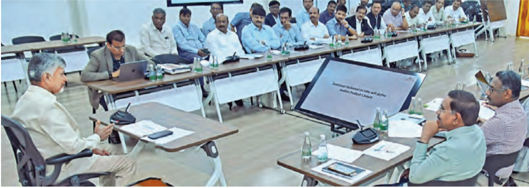
శనివారం అమరావతి నిర్మాణ పనులపై కాంట్రాక్టు సంస్థల ప్రతినిధులతో చర్చిస్తున్న సీఎం చంద్రబాబు. చిత్రంలో మంత్రి నారాయణ, అధికారులు

విజయవాడ, ఏప్రిల్ 4, ప్రభాతవార్త ప్రతినిధి: అమరావతి రాజధాని నిర్మాణ పనులను సకాలంలో పూర్తిచేసి తీరాల్సిందిగా ముఖ్య మంత్రి నారా చంద్రబాబు నాయుడు సుప్రసంగం చేశారు. నిర్దేశించిన కచ్చిత సమయానికి పనులు పూర్తి చేసి ప్రధానితో ప్రారంభోత్సవం చేస్తామని, ఈ మేరకు పనులు వేగంగా చేపట్టి పూర్తి చేసేలా కాం ట్రాక్టర్ల చర్యలు తీసుకోవాలని సూచించారు. ఈ మేరకు అధికారులు కూడా పనుల్ని ఎప్పటికప్పుడు పర్యవేక్షిస్తామని అంటూ ఆదేశించారు. రాజధాని నిర్మాణ పనులను ఓ కాంట్రాక్టు వర్గం అన్నట్లుగా భావించవద్దని చరిత్రలో భాగస్వాములు అవుతున్నట్లుగా భావించాలన్నారు. శనివారం క్యాంప్ కార్యాలయంలో రాజధానిలో నిర్మాణ పనులు చేపట్టిన వివిధ కాంట్రాక్టు సంస్థలతో ముఖ్యమంత్రి చంద్ర బాబు సమావేశమయ్యారు. ప్రస్తుతం రాజధానిలో వివిధ