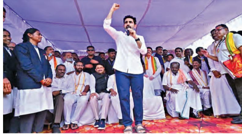
శనివారం కర్ణాటక నింధనూరులో సైనిక స్మారక ప్రారంభ సభలో మాట్లాడుతున్న మంత్రి లోకేశ్

స్వామి. దానికి మేం రుణపడి ఉన్నాం కర్ణాటకలోని రాయచూర్ జిల్లా నింధనూరులో ఆయన పర్యటించారు. ఈ సందర్భంగా తన తండ్రి అరెస్టు నాటి జ్ఞాపకాలను నెమరువేసుకున్నారు. సమాజంలో సైనిక విలువల ఆపవృత్త గురించి ఆసక్తికర వ్యాఖ్యలు చేశారు. మంత్రి నారా లోకేశ్ ఉదయం కర్ణాటకలోని నింధనూరుకు చేరుకున్నారు. స్థానిక తెలుగు యువత ఆయనకు ఘన స్వాగతం పలికింది. భారీ గజమాలతో లోకేశ్ ను సత్కరించారు. యువగళం జెండాలు చేతబాని జై లోకేశ్ అంటూ నినాదాలు చేశారు. నింధనూరులోని ఎంజీ సర్కిల్ నుంచి గంగావతి రోడ్డు వరకు భారీ ట్రైక్ ర్యాలీ నిర్వహించారు. ఈ ర్యాలీలో కేంద్ర మంత్రులు హెచ్.డి కుమారస్వామి, సంజయ్ సేథ్ పాల్గొన్నారు. ఉత్సాహంగా సాగిన ఈ ర్యాలీలో ప్రజలందరికీ అభినందనలు చెప్పి లోకేశ్, కేంద్ర మంత్రులు ముందుకు సాగారు. ర్యాలీ అనంతరం హోసల్లో క్యాంప్ గంగావతి రోడ్డులోని కర్పూరి కర్పూరి మండలం వద్దకు చేరుకున్నారు. అక్కడ సర్కిల్ ఎన్టీఆర్ కాంస్య విగ్రహాన్ని కేంద్ర మం