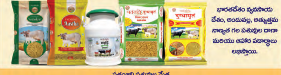
పతంజలి పశువుల మేత

పతంజలి ఉత్పత్తులు దాదాపు 1 కోటి దుకాణాల్లో అందుబాటులో ఉన్నాయి. అయితే, ఏదైనా ఉత్పత్తి దుకాణంలో అందుబాటులో లేకపోతే, దయచేసి దుకాణదారుడితో డిమాండ్ చేసినట్లు అతను దాని లభ్యతను నిర్ధారిస్తాడు.