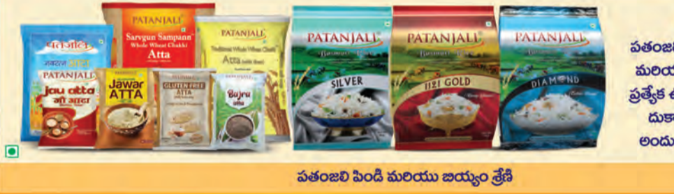
పతంజలి పెండి మరియు జియ్యం శ్రేణి