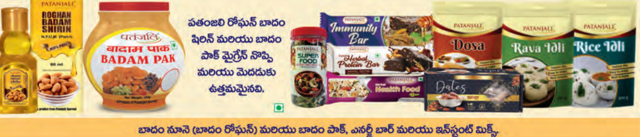
బాదం నూనె (బాదం రోఫుస్) మరియు బాదం పాక, ఎనర్జీ బార్ మరియు ఇన్ స్టంట్ మిక్స్