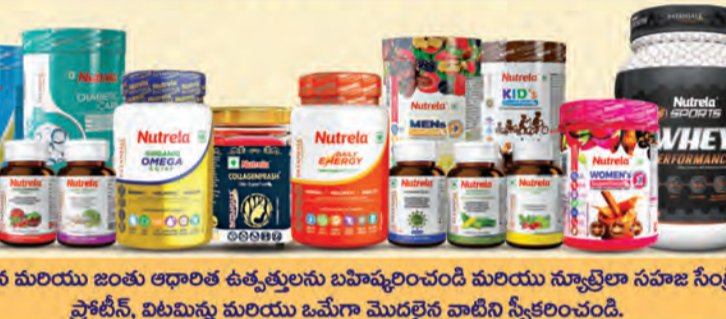
రసాయన మరియు జంతు ఆధారిత ఉత్పత్తులను బహిష్కరించండి మరియు స్కాల్ప్ లా సహజ సింట్రియ ప్రోటీన్, విటమిన్లు మరియు ఒమేగా మొదలైన వాటిని స్వీకరించండి.