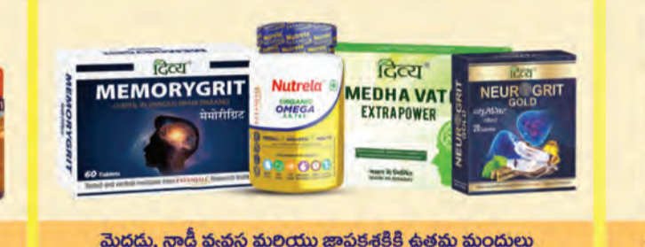
మెదడు, నాడీ వ్యవస్థ మరియు జ్ఞాపకశక్తికి ఉత్తమ మందులు