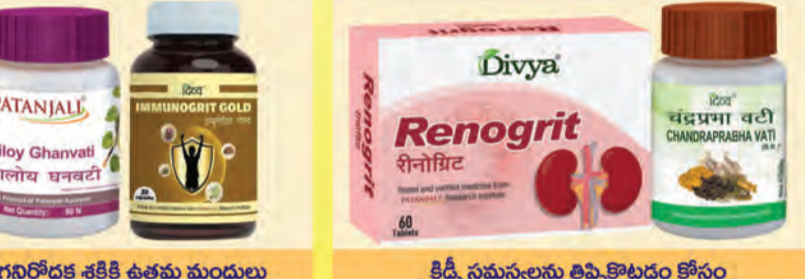
రోగనిరోధక శక్తికి ఉత్తమ మందులు కిడ్నీ సమస్యలను తిప్పికొట్టడం కోసం