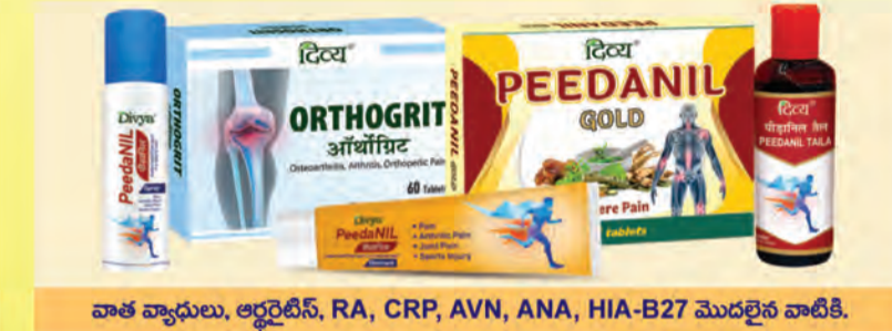
వాత వ్యాధులు, ఆర్థరైటిస్, RA, CRP, AVN, ANA, HIA-B27 మొదలైన వాటికి.