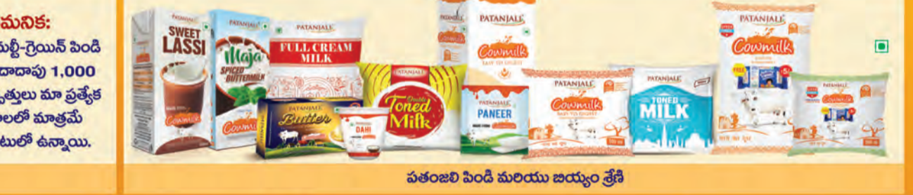
పతంజలి పెండి మరియు జియ్యం శ్రేణి