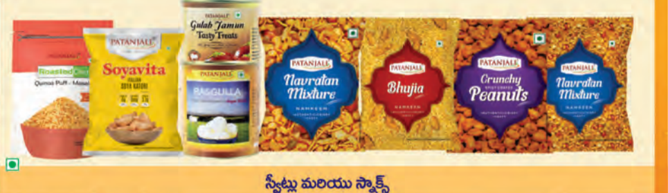
స్వీట్లు మరియు స్నాక్స్