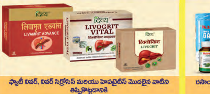
స్పాటి లివర్, లివర్ సిస్టెమ్ మరియు హెపటైటిస్ మొదలైన వాటిని తిప్పికొట్టడానికి