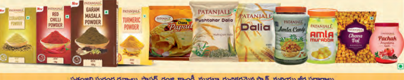
పతంజలి సుగంధ ద్రవ్యాలు, పావడ్, గంజి, క్యాండ్, మురబ్జా, రుచికరమైన స్నాక్స్ మరియు జిడ్ల పదార్థాలు