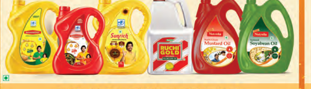
మహాకోప, సనోలచ్, మరియు దేశంలో నంబర్ 1 పామ్ ఆయిల్ బ్రాండ్, రుచి గోల్డ్, అలాగే స్వాచ్ఛల శ్రేణి నూనెలు.