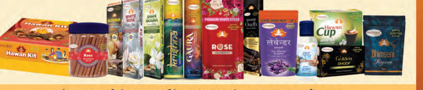
మీరు ఎంచుకున్న దేవుడిని ప్రార్థించడంలో మీకు సహాయపడటానికి 100% స్వచ్ఛమైన వెదురు లేని అగర్ బిల్లు, టిమ్మోని కర్రపూరం, స్వచ్ఛమైన సువ్యంజల నూనె మరియు హావాన్ సమగ్ర.