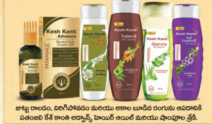
జుట్టు రాలడం, విరిగిపోవడం మరియు అకాల బూడిద రంగును ఆపడానికి పతంజలి కేశ్ కాంతి అద్వాన్స్ హెయిర్ ఆయిల్ మరియు ఫౌన్ షూల్ త్రేణి.