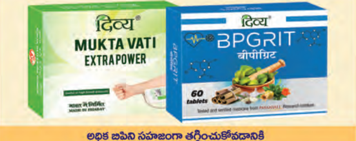
అధిక బిపిని సహజంగా తగ్గించుకోవడానికి

దాతృత్వానికి శ్రేయస్సు: పతంజలి గ్రూప్ సంపాదించే లాభాలన్నీ విద్య, ఔషధాల అభివృద్ధి, చెట్ల పెంపకం, సనాతన ధర్మ ప్రచారం మరియు భారతమాత సేవలో నిమగ్నమై ఉన్న పతంజలి గురుకులం, భారతీయ శిక్షా బోర్డు, ఆచార్యులకు, పతంజలి విశ్వవిద్యాలయం మరియు పరిశోధనా ఫౌండేషన్ కు అంకితం చేయబడ్డాయి. ఈ విధంగా లాభాలలో 100% నిస్వార్థ దాతృత్వం మరియు జాతీయ సేవలో పెట్టుబడి పెట్టబడతాయి. ఆరోగ్యకరమైన, సంపన్నమైన మరియు ఉజ్వలమైన భారతదేశాన్ని సృష్టించడానికి తన చివరి శ్వాస వరకు స్వచ్ఛత మరియు సమగ్రతతో భారతమాతకు సేవ చేస్తూనే ఉంటానని పూజ్య స్వామి రాందేవ్ జీ ప్రతిజ్ఞ చేశారు. చాలా సంవత్సరాలుగా, పూజ్య ఆచార్య బాలకృష్ణ జీ ప్రపంచంలోని అగ్రశ్రేణి 2% శాస్త్రవేత్తలు మరియు పరిశోధకులలో ఒకరిగా ఉన్నారు. ఆయన దార్శనికత పతంజలిని సైన్స్, పరిశోధన మరియు స్వదేశీ ఆవిష్కరణల ద్వారా ప్రపంచ పటంలో ప్రముఖ బ్రాండ్ గా ఎదగడానికి దారితీసింది. నేడు, పతంజలి యోగా, ఆయుర్వేదం, స్వదేశీ మరియు సనాతన ధర్మాలకు సేవలందిస్తున్న భారతదేశంలోని ప్రముఖ సంస్థ.