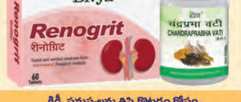
కిడ్నీ సమస్యలను తిప్పికొట్టడం కోసం