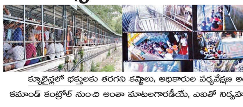
కర్నూలులో భక్తులకు తరగని కప్పాలు, అధికారుల పర్యవేక్షణ అంతంమాత్రమే కమాండ్ కంట్రోల్ నుంచి అంతా మాటలగారడీయే, ఎవణో నిర్వహణ ఆదేవునికే ఎరుక

తిరుమల, ఏప్రిల్ 4 ప్రభాతవార్త ప్రతినిధి: రోజుకు సరాసరి 70వేలమంది నుండి 80వేలమంది వరకు భక్తులకు మహాలక్ష్మి విధానంలో తిరుమల అలయంలో టిటిడి అధికారులు శ్రీవారి దర్శనం చేయిస్తున్నారు. గంటలగంటలు క్యూలైన్లో, వైకాంట్ కంప్యూటర్లలో నిరీక్షణ కష్టాలు తప్పడం లేదనేది అధికారంలో ఉన్న భక్తుల ఆవేదన. అత్యాధునిక సాంకేతిక పరిజ్ఞానం వినియోగించి ఎలా అమలుచేస్తూ భక్తులకు త్వరగా దర్శనం చేయిస్తున్నామని టిటిడి అధికారులు మాయతో అభివృద్ధిని చెప్పిస్తున్నారు. అయితే వాస్తవంగా దర్శనాలు అమలులో మాత్రం భక్తుల కష్టాలు విని పించుకునే, పట్టించుకునే అధికార లేదంటే అతిశయోక్తిలేదు. సాధారణ రోజుల్లోనే 300 రూపాయలు ఎనెడీ దర్శన టికెట్ కలిగిన