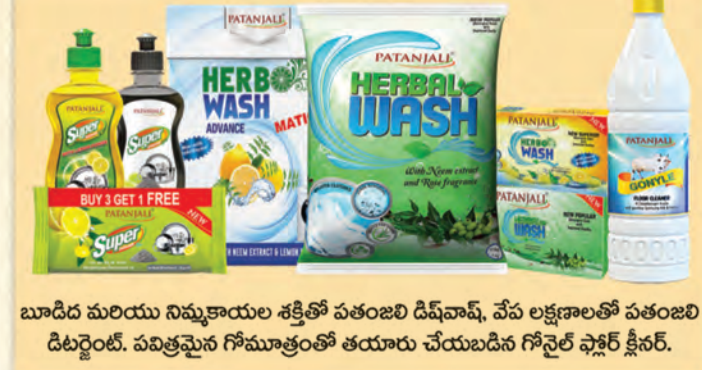
బూడిద మరియు నిమ్మకాయల శక్తితో పతంజలి డిష్ వాష్, వేప లక్షణాలతో పతంజలి డిటర్జెంట్. పవిత్రమైన గోమూత్రంతో తయారు చేయబడిన గోనైట్ ఫ్లెక్సర్ క్లీనర్.