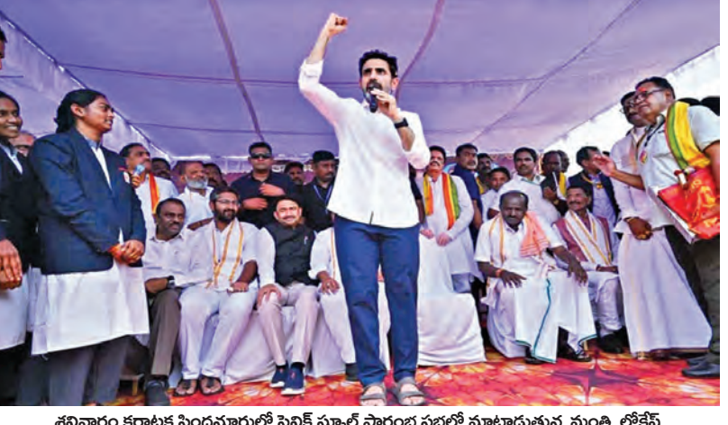
శనివారం కర్ణాటక సింధునూరులో సైనిక స్కూల్ ప్రారంభ సభలో మాట్లాడుతున్న మంత్రి లోకేశ్

విజయవాడ, ఏప్రిల్ 4 ప్రభాతవార్త ప్రతినిధి: అమరావతి సహజమే, అది కుంగిపోవాలి నీతి కాదు, ఆలోచించాలి సమయం, విజయానికి మార్గదర్శనమని ఏపీ మంత్రి నారా లోకేశ్ వ్యాఖ్యానించారు. జీవితంలో ఓటమి సహజం అత్యుపాధ్యక్షులు పరిష్కారం ఎన్నికలకు ముందు ఏ తప్పు చేయని మా పెద్దాయన (చంద్రబాబు)ను ఆక్షేపించగా జైలులో పెట్టారు. ఏ తప్పు చేయకుండా జైలులో పెట్టి నందుకు నేను తీవ్రంగా బాధపడ్డాను. కానీ, ఆ క్షిప్త సమయంలో ప్రపంచవ్యాప్తంగా ఉన్న తెలుగు ప్రజలంతా మా కుటుంబానికి అండగా నిలబడ్డారు. నాడు అండగా నిలిచిన ప్రతి ఒక్కరికీ జీవితాంతం రుణపడి ఉంటాను" అని ఏపీ విద్యా, జల శాఖల మంత్రి నారా లోకేశ్ ఉద్ఘోషించారు. కర్ణాటక సొంత తల్లిలాంటిది నారా లోకేశ్ ఉద్ఘోషించారు. యువగళం జెండాలు చేతబాసి జై లోకేశ్ అంటూ నినాదాలు చేశారు. సింధునూరులోని ఎంజీ సర్కిల్ నుంచి గంగాపతి రోడ్డు వరకు డాబ్ల డి రోడ్డు నిర్వహించారు. ఈ రోడ్డులో కేంద్ర మంత్రులు హెచ్. డి కుమారస్వామి, సంచయ్ సీట్ పాల్గొన్నారు. ఉత్సాహంగా సాగిన ఈ రోడ్డులో ప్రజలందరికీ అభివాదం చేస్తూ లోకేశ్, కేంద్ర మంత్రులు ముందుకు సాగారు. రోడ్డు అనంతరం హోస్పిట్ క్యాంప్ గంగాపతి రోడ్డులోని కమ్యూనికేషన్ కల్యాణ మండపం వద్దకు చేరుకున్నారు. అక్కడ స్వర్ణంపై ఎన్టీఆర్ కాంస్య విగ్రహాన్ని కేంద్ర మం