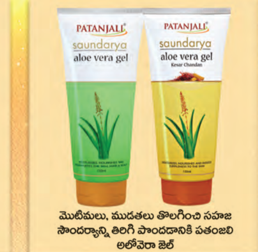
మొటిమలు, ముడతలు తొలగించి సహజ సౌందర్యాన్ని తిరిగి పొందడానికి పతంజలి అలోవెరా జెల్