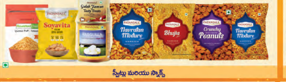
స్వీట్లు మరియు స్నాక్స్