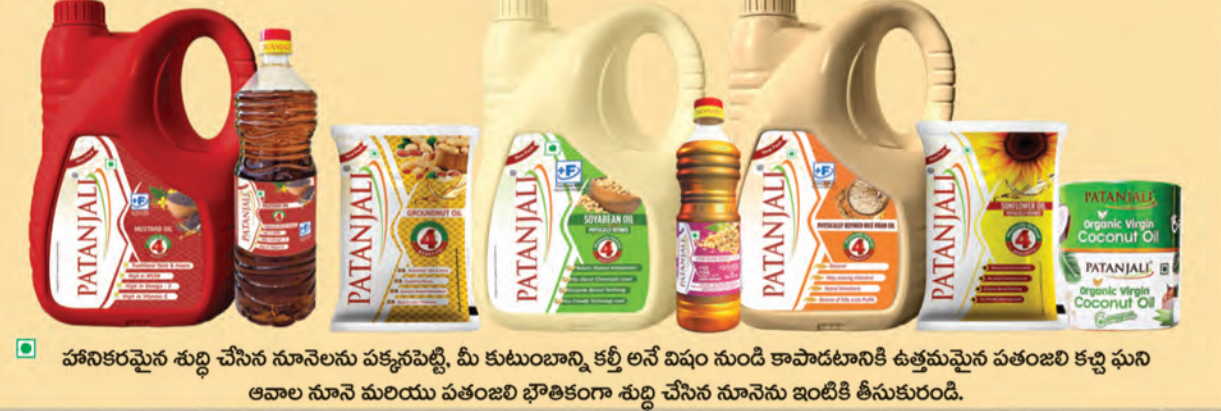
హానికరమైన శుద్ధి చేసిన నూనెలను పక్కనపెట్టి, మీ కుటుంబాన్ని కల్గి అనే విషం నుండి కాపాడటానికి ఉత్తమమైన పతంజలి కర్ణి ఫుని ఆవాల నూనె మరియు పతంజలి భౌతికంగా శుద్ధి చేసిన నూనెను ఇంటికి తీసుకురండి.