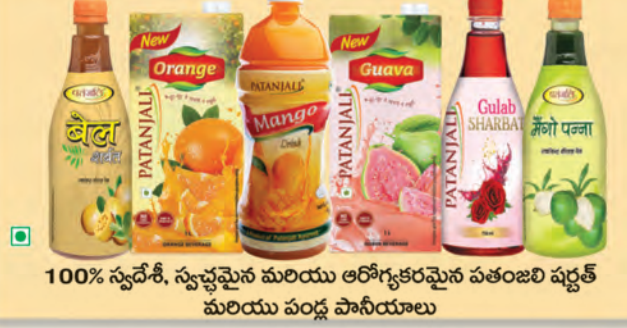
100% స్వదేశీ, స్వచ్ఛమైన మరియు ఆరోగ్యకరమైన పతంజలి షర్బత్ మరియు పండ్ల పానీయాలు