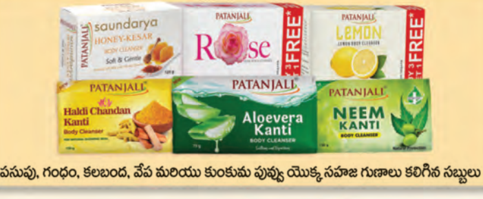
పసుపు, గంధం, కలబంద, వేప మరియు కుంకుమ పువ్వు యొక్క సహజ గుణాలు కలిగిన సబ్బులు