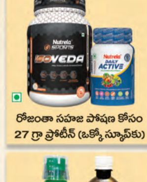
రోజంతా సహజ పోషకా కోసం 27 గ్రా ప్రోటీన్ (ఒక్కో స్కూప్ కు)