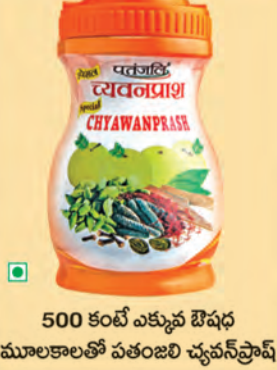
500 కంటే ఎక్కువ ఔషధ మూలకాలతో పతంజలి చ్యవన్ ప్రాష్