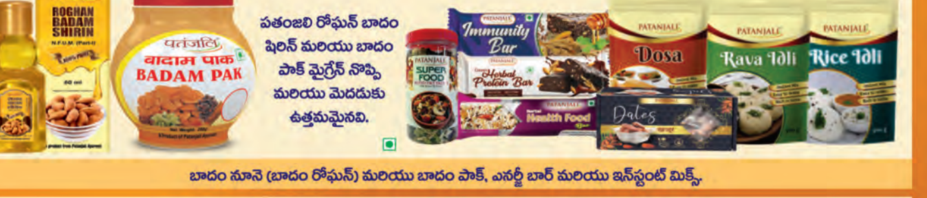
బాదం నూనె (బాదం రోఫుస్) మరియు బాదం పాక్, ఎనర్జీ బార్ మరియు ఇన్ స్పెంట్ మిక్స్.