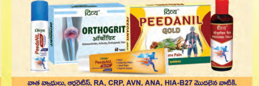
వాత వ్యాధులు, ఆర్థరైటిస్, RA, CRP, AVN, ANA, HIA-B27 మొదలైన వాటికి.