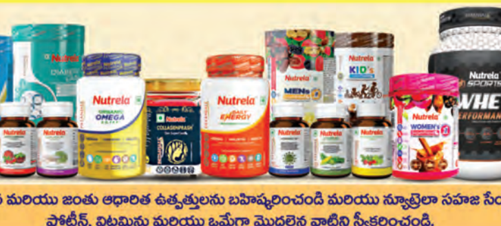
రసాయన మరియు జంతు ఆధారిత ఉత్పత్తులను బహిష్కరించండి మరియు స్వచ్ఛమైన సహజ సేంద్రీయ ప్రోటీన్, విటమిన్లు మరియు ఒమేగా మొదలైన వాటిని స్వీకరించండి.