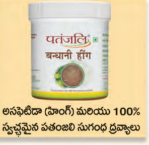
అసఫీదీడా (హింగ్) మరియు 100% స్వచ్ఛమైన పతంజలి సుగంధ ద్రవ్యాలు