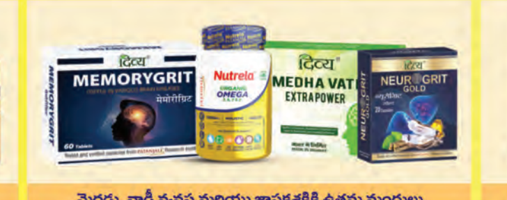
మెదడు, నాడీ వ్యవస్థ మరియు జ్ఞాపకశక్తికి ఉత్తమ మండులు