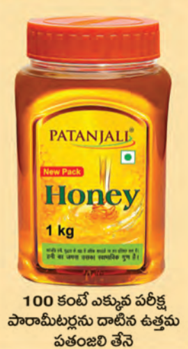
100 కంటే ఎక్కువ పరీక్ష పారామీటర్లను దాటిన ఉత్తమ పతంజలి తేనె