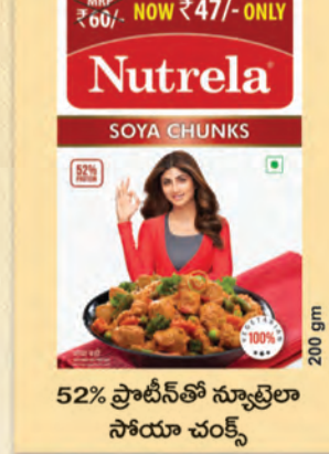
52% ప్రోటీన్ తో న్యూట్రలా సోయా చంక్స్