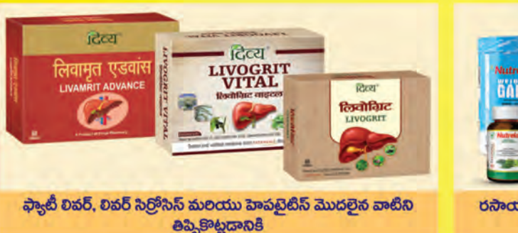
ఫ్యాటీ లివర్, లివర్ సెల్లోని మరియు హెపటైటిస్ మొదలైన వాటిని తిప్పికొట్టడానికి