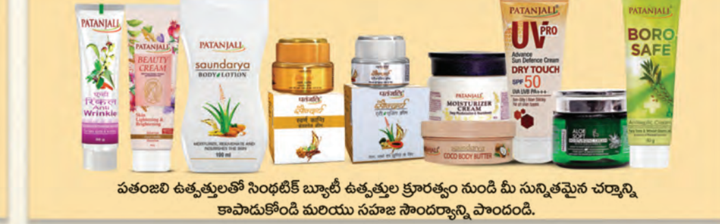
పతంజలి ఉత్పత్తులతో సింధిటిక్ బ్యూటీ ఉత్పత్తుల క్రూరత్వం నుండి మీ సున్నితమైన చర్మాన్ని కాపాడుకోండి మరియు సహజ సౌందర్యాన్ని పొందండి.