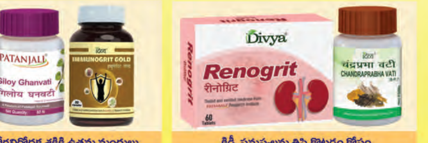
రోగనిరోధక శక్తికి ఉత్తమ మండులు కిడ్నీ సమస్యలను తిప్పికొట్టడం కోసం