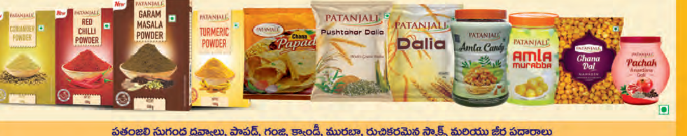
పతంజలి సుగంధ ద్రవ్యాలు, పాపడ్, గంజ, క్యాండ్, మురబ్బా, రుచికరమైన స్నాక్స్ మరియు జిర్ పదార్థాలు