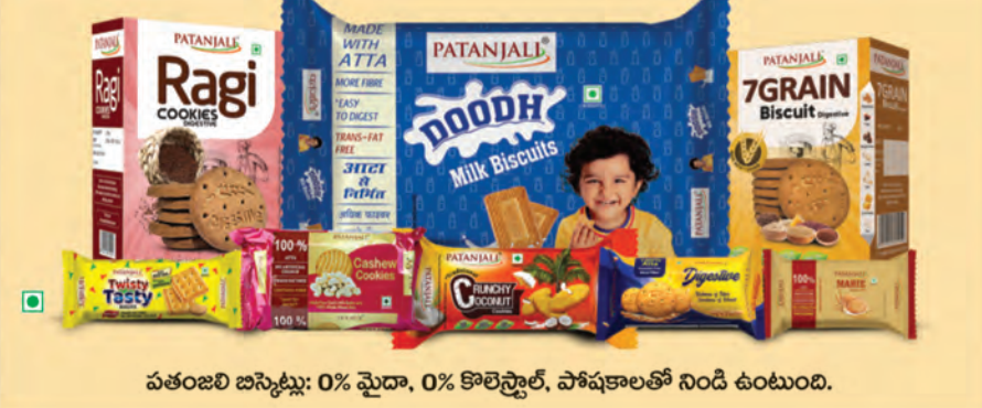
పతంజలి బిస్కెట్లు: 0% వైదా, 0% కొలెస్ట్రాల్, పోషకాలతో నిండి ఉంటుంది.