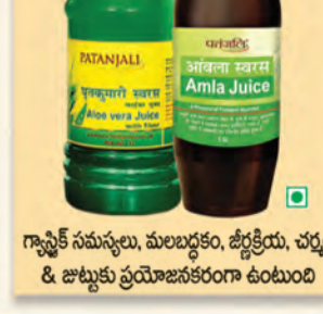
గ్లూకోసమస్సు, మలబద్ధం, శ్లేష్మిత్రయ, చర్మం & జాబ్బుకు ప్రయోజనకరంగా ఉంటుంది