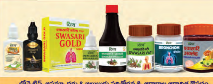
బ్రోన్ఛైటిస్, ఆస్తమా, దగ్గు & జలుబుకు పరిశోధన & ఆధారాల ఆధారిత ఔషధం