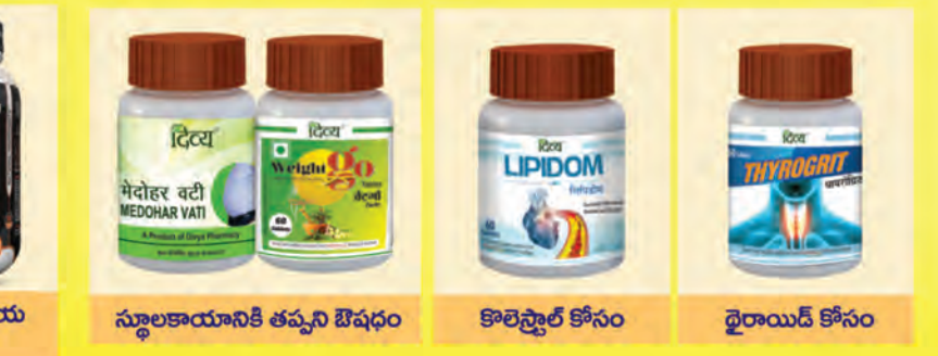
స్థూలకాయానికి తప్పని ఔషధం కొలెస్ట్రాల్ కోసం థైరాయిడ్ కోసం

వైద్య సంప్రదింపుల కోసం సమీపంలోని పతంజలి చికిత్సాలయాలను సంప్రదించండి. 5,000 పతంజలి ఎక్స్ క్యూజిన్ స్టోర్లను కనుగొనడానికి Googleలో శోధించండి. మీ ఇంటి నుండి 1800 296 1111 కు కాల్ చేసి మీ సమస్యలన్నింటినీ ఉచితంగా పరిష్కరించుకోండి. పతంజలి సేవల గురించి తెలుసుకోవడానికి 8954 555 999 కు కాల్ చేయండి. పతంజలి ఉత్పత్తుల కోసం ఆన్ లైన్ ఆర్డర్ చేయడానికి, OrderMe యాప్ ను డౌన్ లోడ్ చేసుకోండి.