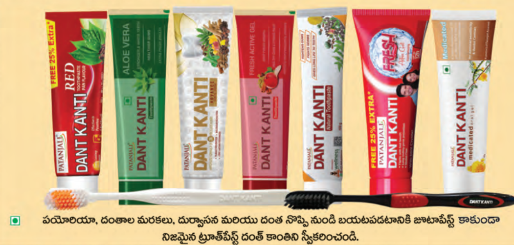
పయోరియా, దంతాల మరకలు, దుర్వాసన మరియు దంత నొప్పి నుండి బయటపడటానికి జాటాపేస్ట్ కాకుండా నిజమైన ట్రూత్ పేస్ట్ దంత కాంతిని సృష్టించింది.