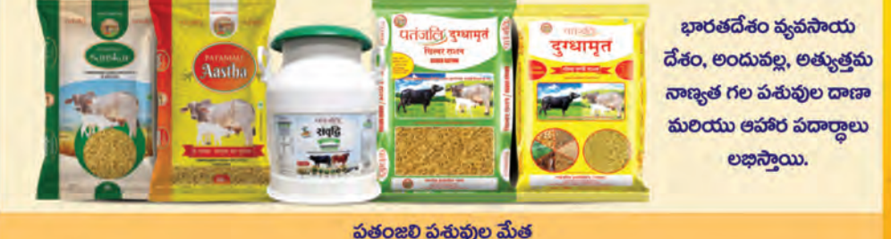
పతంజలి పశువుల మేత

పతంజలి ఉత్పత్తులు దాదాపు 1 కోటి దుకాణాల్లో అందుబాటులో ఉన్నాయి. అయితే, ఏదైనా ఉత్పత్తి దుకాణంలో అందుబాటులో లేకపోతే, దయచేసి దుకాణదారుడితో డిమాండ్ చేసినట్లయితే అతను దాని లభ్యతను నిర్ధారిస్తాడు.