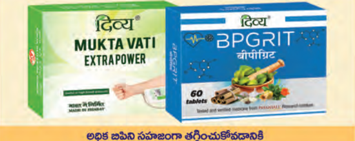
అధిక బియ్యం సహజంగా తగ్గించుకోవడానికి

దాతృత్వానికి శ్రేయస్సు: పతంజలి గ్రూప్ సంపాదించే లాభాలన్నీ విద్య, ఔషధాల అభివృద్ధి, చెట్ల పెంపకం, సనాతన ధర్మ ప్రచారం మరియు భారతమాత సేవలో నిమగ్నమై ఉన్న పతంజలి గురుకులం, భారతీయ శిక్షణా బోర్డు, ఆచార్యులకు, పతంజలి విశ్వవిద్యాలయం మరియు పరిశోధనా ఫౌండేషన్ కు అంకితం చేయబడ్డాయి. ఈ విధంగా లాభాలలో 100% నిస్వార్థ దాతృత్వం మరియు జాతీయ సేవలో పెట్టుబడి పెట్టబడతాయి. ఆరోగ్యకరమైన, సంపన్నమైన మరియు ఉజ్వలమైన భారతదేశాన్ని సృష్టించడానికి తన చివరి శ్వాస వరకు స్వచ్ఛత మరియు సమగ్రతతో భారతమాతకు సేవ చేస్తూనే ఉంటానని పూజ్య స్వామి రాందేవ్ జీ ప్రతిజ్ఞ చేశారు. చాలా సంవత్సరాలుగా, పూజ్య ఆచార్య బాలకృష్ణ జీ ప్రపంచంలోని అగ్రశ్రేణి 2% శాస్త్రవేత్తలు మరియు పరిశోధకులలో ఒకరిగా ఉన్నారు. ఆయన దార్శనికత పతంజలిని సైన్స్, పరిశోధన మరియు స్వదేశీ ఆవిష్కరణల ద్వారా ప్రపంచ పటంలో ప్రముఖ బ్రాండ్ గా ఎదగడానికి దారితీసింది. నేడు, పతంజలి యోగా, ఆయుర్వేదం, స్వదేశీ మరియు సనాతన ధర్మాలకు సేవలందిస్తున్న భారతదేశంలోని ప్రముఖ సంస్థ.