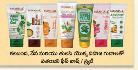
కలబంద, వేప మరియు తులసి యొక్క సహజ గుణాలతో పతంజలి ఫేస్ వాష్ / స్క్రబ్