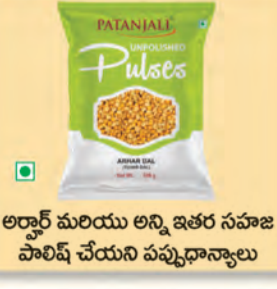
అర్బార్ మరియు అన్ని ఇతర సహజ పాలిష్ చేయని పప్పుధాన్యాలు