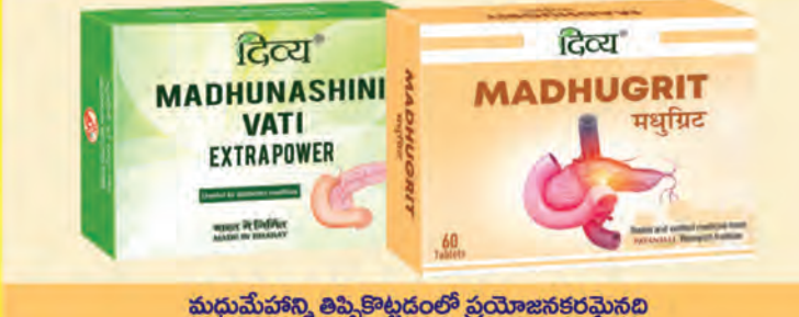
మధుమేహాన్ని తిప్పికొట్టడంలో ప్రయోజనకరమైనది