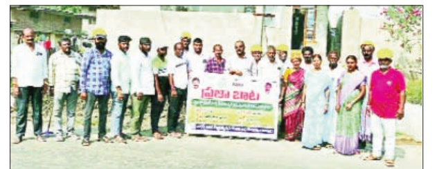
దామెర ఏప్రిల్ 4, ప్రభాతవార్త

వేసవి కాలానికి ఎలాంటి సమస్యలు లేకుండా సరఫరా..