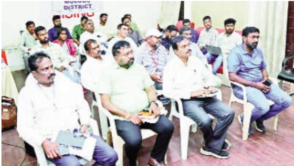
సమయంలో అండర్ గ్రౌండ్ కేబుల్స్ దెబ్బతినకుండా కాల్ బిఫోర్ యు డిగ్ యాప్ ను తప్పనిసరిగా వినియోగించాలని సూచించారు. టి ఫైబర్, బిఎస్ఎన్ఎల్, ట్రైవేట్ సంస్థల కేబుల్ అనుమతులు వేగంగా పూర్తి చేయాలని, టవర్ల ఏర్పాటుకు అనుమతులు, విద్యుత్ కనెక్షన్ లో జాప్యం తొలగించాలని ఆదేశించారు. మారుమూల ప్రాంతాలకూ నెట్ వర్క్ విస్తరణ లక్ష్యంగా అన్ని శాఖలు సమన్వయంతో పనిచేయాలని స్పష్టం చేశారు. సమావేశంలో అదనపు కలెక్టర్లు, ఆర్డీవో, డిఆర్ డి, టెలికాం సంస్థల ప్రతినిధులు పాల్గొన్నారు.