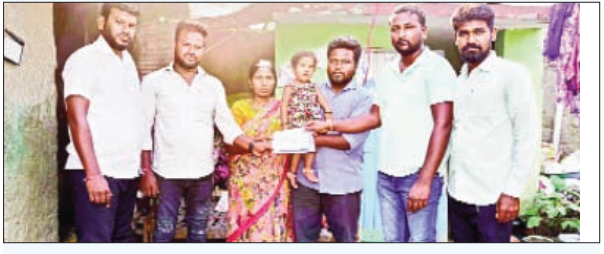
నెక్కొండ, ఏప్రిల్ 4, ప్రభాతవార్త