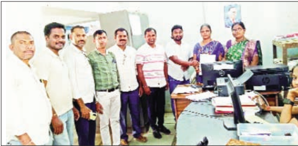
ప్రభాతవార్త ఏటూర్ నాగారం ఏప్రిల్ 4: జనగణన (సెన్సెస్) డ్యూటీస్ వివక్ష పూరితంగా మహిళా ఉపాధ్యాయులకు కేటాయిం చకపోవడం దారుణం