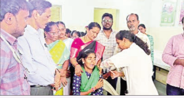
దుగ్గొండి, ఏప్రిల్ 4, ప్రభాతవార్త