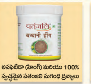
అసఫీటిడా (హింగ్) మరియు 100% స్వచ్ఛమైన పతంజలి సుగంధ ద్రవ్యాలు