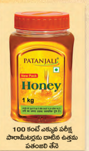
100 కంటే ఎక్కువ పరిశ్చ పారామీటర్లను దాటిన ఉత్తమ పతంజలి తేనె