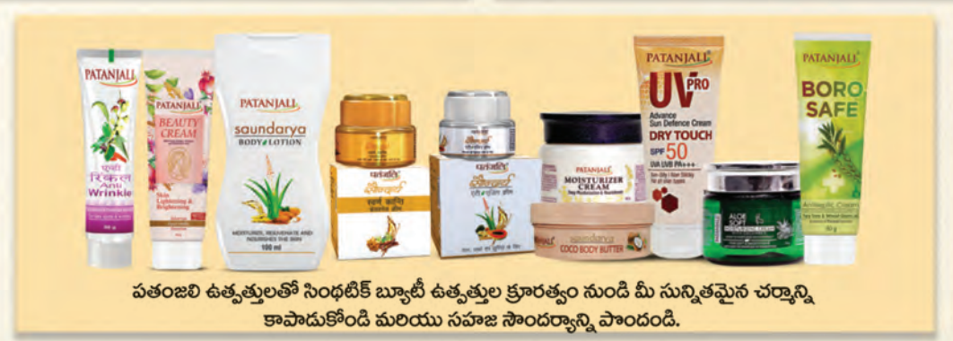
పతంజలి ఉత్పత్తులతో సింధుబీక్ బ్యూటీ ఉత్పత్తుల క్రూరత్వం నుండి మీ సున్నితమైన చర్మాన్ని కాపాడుకోండి మరియు సహజ సౌందర్యాన్ని పొందండి.