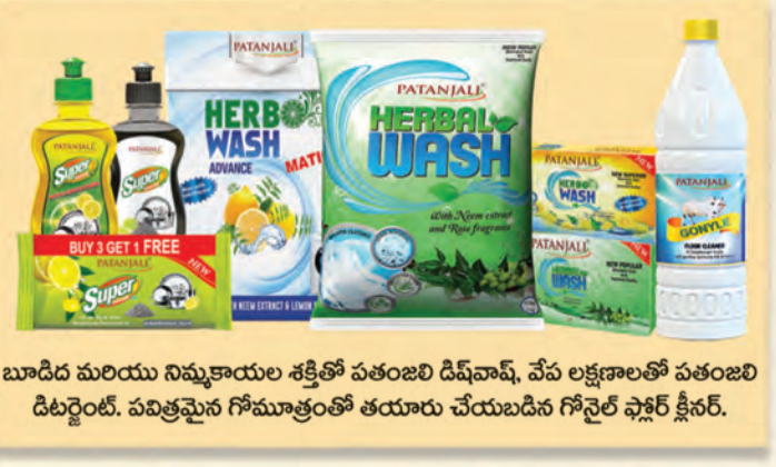
బూడిద మరియు నిమ్మకాయల శక్తితో పతంజలి డిష్ వాష్, వేప లక్షణాలతో పతంజలి డిటర్జెంట్, పవిత్రమైన గోమూత్రంతో తయారు చేయబడిన గోనైల్ ఫాస్ట్ క్లీనర్.