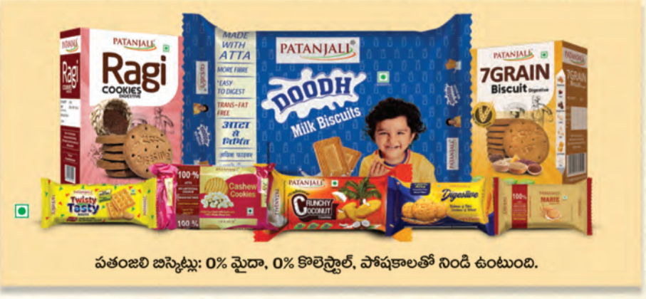
పతంజలి బిస్కెట్లు: 0% మైదా, 0% కొలెస్ట్రాల్, పోషకాలతో నిండి ఉంటుంది.