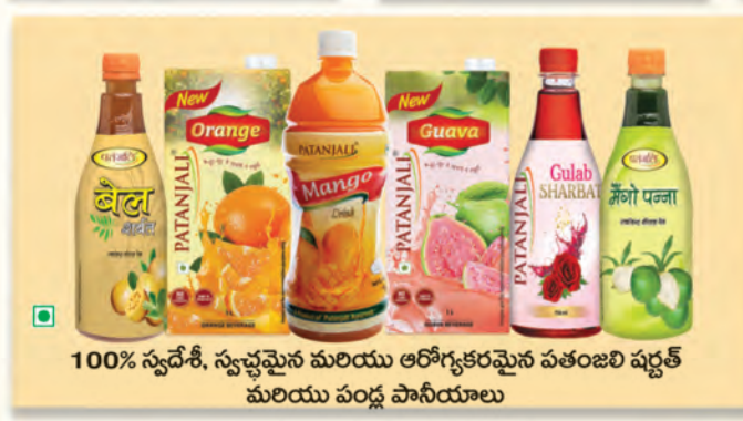
100% స్వచ్ఛ, స్వచ్ఛమైన మరియు ఆరోగ్యకరమైన పతంజలి షర్బత్ మరియు పండ్ల పానీయాలు