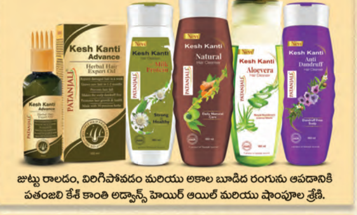
జాబ్బు రాదండం, విరిగిపోవడం మరియు అకాల బూడిద రంగును ఆపడానికి పతంజలి కేశ్ కాంతి అడ్వాన్స్ హెయిర్ ఆయిల్ మరియు షాంపూ శ్రేణి.