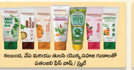
కలబంద, వేప మరియు తులసి యొక్క సహజ గుణాలతో పతంజలి ఫేస్ వాష్ / స్ప్రే