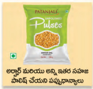
అర్జాన్ మరియు అన్ని ఇతర సహజ పోలిష్ చేయని పప్పుధాన్యాలు