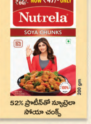
52% ప్రోటీన్ తో న్యూట్రెలా సోయా చంక్స్