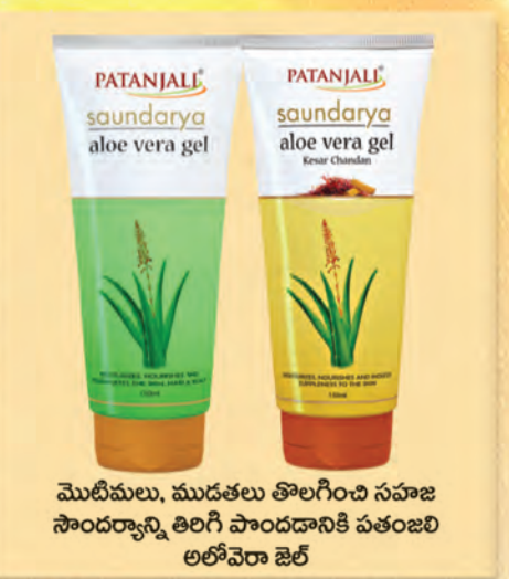
మొటిమలు, ముడతలు తొలగించి సహజ సౌందర్యాన్ని తిరిగి పొందడానికి పతంజలి అలోవెరా జెల్