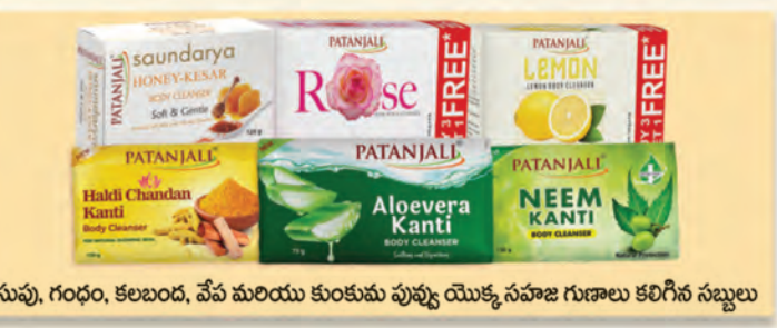
పసుపు, గంధం, కలబంద, వేప మరియు కుంకుమ పువ్వు యొక్క సహజ గుణాలు కలిగిన సబ్బులు