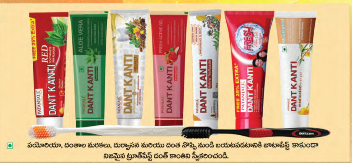
పయోలియా, దంతాల మరకులు, దుర్వాసన మరియు దంత నొప్పి నుండి బయటపడటానికి జాటాపేస్ట్ కాకుండా నిజమైన ట్రూత్ పేస్ట్ దంత కాంతిని స్వీకరించండి.