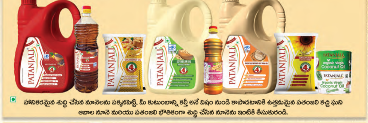
పనికరమైన శుద్ధి చేసిన నూనెలను పక్కనపెట్టి, మీ కుటుంబాన్ని కల్గి అనే విషం నుండి కాపాడటానికి ఉత్తమమైన పతంజలి కర్ణి ఘని ఆవాల నూనె మరియు పతంజలి భౌతికంగా శుద్ధి చేసిన నూనెను ఇంటికి తీసుకురండి.