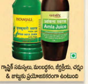
గ్నాస్టిక్ సమస్యలు, మలబద్ధకం, త్వక్తియ, చర్మం & జొట్లకు ప్రయోజనకరంగా ఉంటుంది