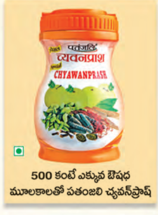
500 కంటే ఎక్కువ ఔషధ మూలకాలతో పతంజలి చ్యవన్ ప్రాశ్