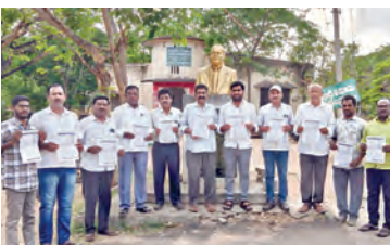
ప్రజా సంఘాల ఆధ్వర్యంలో కరవలాల విడుదల చేస్తున్న దృశ్యం

పాండనగర్, ఏప్రిల్ 4, ప్రభాతవార్త : ఇజ్రాయిల్ ఆమెరికా దేశాలు ఇరాన్ మీద ఆక్రమణ యుద్ధం ప్రారంభించి ప్రపంచ ప్రజలు జీవితాలతో చెలగేట మారుతున్నాయని సామ్యజ్యవాద యుద్ధాన్ని వ్యతిరేకిస్తూ ప్రపంచ ప్రజలు శాంతి కోసం జరిగే సదస్సుకు సంబంధించిన కరవలాలను అడివనల్ నాడు పాండనగర్ ఎంపీ.డి.ఎ. కార్యాలయ ఆవరణలో విడుదల చేశారు మహబూబ్ నగర్ జిల్లాలో జరిగే సదస్సును విజయవంతం చేయాలని వివిధ ప్రజాసంఘాల నాయకులు కోరారు. ఆమెరికా ఇజ్రాయిల్ దేశాలు వనరుల దోపిడీ కోసం ప్రపంచం మీద ఆధిపత్యం కోసం పాఠశాలను మీద ఆసుపత్రులు మీద జనావాసాల మీద దాడులు చేస్తున్నాయని అవి యుద్ధాన్ని ప్రాణాంతకం సమస్యగా విధ్వంసం చేశారు ఒక నరదా శ్రీకాంత్ భావిస్తున్నాయని ఇజ్రాయిల్ పాలసీలను ఉపసంహరించాలని అమెరికా మద్దతు ఇస్తుందని ఇప్పుడు ఈ రెండు దేశాలు కలిసి ఇరాన్ మీద దాడికి దిగాయని మీద మూడు దేశాల ముప్పులు కాదు ఇంకా వైపున రహస్య ఉర్రుకొనే మీద యుద్ధం చేస్తుంది యావత్ ప్రపంచ డిజిటల్ పర్యవసానాలు అనుభవించక తప్పని పరిస్థితి యుద్ధాన్ని దేశాలు కల్పిస్తున్నాయని ఈ యుద్ధాలను వ్యతిరేకించవలసిన భారత ప్రభుత్వం ఎందుకు వెనకబడి పోతుందని ఇజ్రాయిల్ పాలసీలను మీద హింసాంధం ఇరాన్ మీద ఆమెరికా ఇజ్రాయిల్ చేస్తున్నట్లుంటే హింసాంధం భారత ప్రభుత్వం ఎందుకు ఖండించడం లేదని నిలువరించే కృషి ఎందుకు చేయలేకపోతుందని యుద్ధ ప్రభావం ప్రపంచ ప్రజలపై ఏవిధంగా ప్రభావం చూపుతుందో