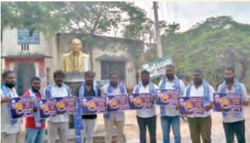
జ్ఞాన యాత్ర కరవలాల విడుదల చేస్తున్న నాయకులు