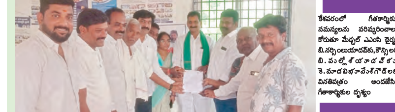
కేవలంలో గీతకార్మికుల సమస్యలు పరిష్కరించాలి