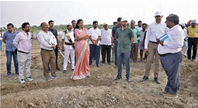
అదివారం సింఛంద్రబాబు పర్వటన ఏర్పాట్లను పరిశీలిస్తున్న అధికారులు