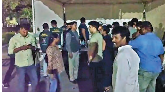
శనివారం ఆర్డర్లు తారామతి బారాదరిలో ఈగల్ పోలీసులు దాడులు నిర్వహించిన దృశ్యం

త్రన్ సేవించి పట్టుబడిన ఆరుగురికి కౌన్సెలింగ్ పునరావాస కేంద్రానికి తరలింపు గంజాయి సరఫరాదారుల కోసం గాలింపు హైదరాబాద్, ఏప్రిల్ 5, ప్రభాతవార్త: నగర శివార్లలోని తారామతి బారాదరిలో శనివారం రాత్రి కొందరు యువకులు 'మోర్ దేన్ ఫ్రెండ్స్' పేరిట నిర్వహించిన పార్టీలో పాల్గొన్న వారిలో పలువురు మాడప్రవాసులు సేదించినట్లు ఆదివారం సమాచారంపై ఈగల్ పోలీసులు శనివారం ఆర్డర్లు దాడులు నిర్వహించారు. ఈ సందర్భంగా పార్టీలో పాల్గొన్న వారిలో అనుమానాస్పదంగా ఉన్న 64 మందిని అదుపులోకి తీసుకుని మూల్చపరీక్షలు నిర్వహించారు. వీరిలో బయటరు గంజాయి సేవించగా ఒకడు ఎవీఎం అనే సింథటిక్ డ్రగ్స్ తీసుకున్నట్లు నిర్ధారణ అయ్యింది. ఈ ఆరుగురు యువకులు తాము డ్రగ్స్ కు అలవాటు పడ్డామని ఈగల్ పోలీసుల ముందు అంగీకరించారు. దీనికి సంబంధించి నాల్గొంటికి పోలీసులు తారామతి బారాదరిలో పార్టీ నిర్వహించిన నిర్మాణాలపై కేసు సమూహం చేశారు. డ్రగ్స్ సేవించిన