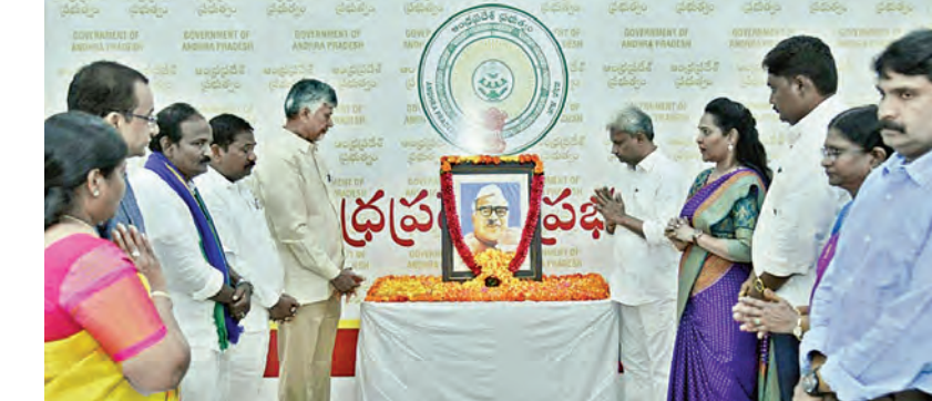
అదివారం బాబూ జగ్జీవన్ రామ్ జయంతి సందర్భంగా ఆయన చిత్రపటం వద్ద నివాళి అర్పిస్తున్న సీఎం చంద్రబాబు

విజయవాడ, ఏప్రిల్ 5, ప్రభాతపాఠశాల ప్రతినిధి: ప్రభుత్వం ఏను పునరుత్థానం సందర్భంగా జరిపే ఈస్టర్ క్రైస్తవ లోకానికి పర్వదినమని విద్య, బడి శాఖల మంత్రి నారా లోకేశ్ స్పష్టం చేశారు. సత్యం, ధర్మంలదే అంతిమ విజయం అని ఈస్టర్ సందేశం ఇస్తోందన్నారు. ఏనుక్రైస్తవ మానవ మార్పులో పరుగునూ సాటి మనుషులకు ప్రేమ, కరుణ వందచూపామన్నారు. మూగజీవుల పట్ల దయ చూపుదామని పిలుపు నిచ్చారు. ఏనుక్రైస్తవ కృపతో ప్రపంచంలో శాంతి నెలకొనాలని, ప్రజల శ్రేయస్సు కోసం ప్రార్థనలు సన్నాధు. క్రైస్తవులందరికీ ఈస్టర్ శుభాకాంక్షలు తెలిపారు.