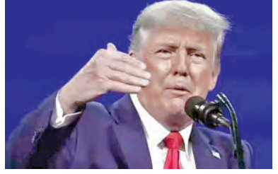
ఇది ఆమెరికా చరిత్రలోనే అత్యంత సాహసోపేతమైన రెండో ఫైలీస్ అని అభివర్ణించారు. విమానం కూలిపోయిన తర్వాత ఒక ఫైలీస్ వెంటనే దోచకగా రెండో ఫైలీస్ ఆహాకీ కోసం గత రెండు రోజులుగా తీవ్ర అత్యంత నెలకొంది. ఇరాన్లోని ప్రమాదకరమైన పర్యట ప్రాంతంలో సదరు ఫైలీస్ చిక్కుకుపోయారు. ఒకవైపు ఇరాన్ సైన్యం, స్థానిక గిరిజన తెగలు అతడి కోసం వేట సాగిస్తుండగా మరోవైపు ఆమెరికా సాంకేతికతతో అతడి లోకేషన్ను నిరంతరం పర్యవేక్షించింది. కమాండర్ ఇన్ చీఫ్ నుంచి జాయింట్ చీఫ్స్ ఆఫ్ స్టాఫ్ వరకు ప్రతి ఒక్కరూ 24 గంటల పాటు ఈ ఆపరేషన్ను సజీతంగా గమనించారు. ట్రంప్ వెల్లడించారు. ఈ ఆపరేషన్ కోసం ట్రంప్ డిజిన్ యుద్ధ విమానాలను రంగంలోకి దింపారు. శతృవుల నుంచి ఎలాంటి అటంకం కలగకుండా ఉండేందుకు.. ఫైలీస్ సురక్షితంగా బయటపడే వరకు ఈ విషయాన్ని అత్యంత రహస్యంగా ఉంచారు. శత్రు భూభాగంలోకి చొప్పకొని ఒక ఎయిర్ మెన్ ను ప్రాణాలతో వెలికి తీసుకురావడం ఆమెరికా చరిత్రలో ఇదే మొదటిసారి అని ట్రంప్ గర్వంగా ప్రకటించారు. ఏ ఆమెరికన్ యోధుడిని మేము ఎప్పుడీ ఒంటరిగా వదిలిపెట్టం. మన సైనికులకు ఇచ్చే హామీ ఇదే అని స్పష్టం చేశారు. ప్రస్తుతం సదరు ఫైలీస్ ఆమెరికా బలగా ఆఫీస్లో సురక్షితంగా ఉన్నారని అతడి ఆరోగ్యవసరాలిని నిలకడగా ఉంచిన వెల్లెహాన్ వర్గాలు తెలిపాయి.

ఏ ఒక్క సైనికుడిని వృధాగా పోగొట్టుకోవద్దామని వాషింగ్టన్, ఏప్రిల్ 5: ఇరాన్లో జరుగుతున్న ధీకార యుద్ధంలో ఆమెరికా రక్షణ దళాలు అద్భుత విజయాన్ని సమూహం చేశాయి. గత శుక్రవారం ఇరాన్ కూల్చివేసి ఎఫ్ 15ని డ్రైక్ ఈగల్ యుద్ధ విమానానికి సంబంధించి గల్లంతైన రెండో ఫైలీస్ను ఆమెరికా సైన్యం రక్షించింది. ఈ విషయాన్ని స్వయంగా ఆదేశ అధ్యక్షుడు డొనాల్డ్ ట్రంప్ ధృవీకరించారు. ఇది ఆమెరికా చరిత్రలోనే అత్యంత సాహసోపేతమైన రెండో ఫైలీస్ అని అభివర్ణించారు. విమానం కూలిపోయిన తర్వాత ఒక ఫైలీస్ వెంటనే దోచకగా రెండో ఫైలీస్ ఆహాకీ కోసం గత రెండు రోజులుగా తీవ్ర అత్యంత నెలకొంది. ఇరాన్లోని ప్రమాదకరమైన పర్యట ప్రాంతంలో సదరు ఫైలీస్ చిక్కుకుపోయారు. ఒకవైపు ఇరాన్ సైన్యం, స్థానిక గిరిజన తెగలు అతడి కోసం వేట సాగిస్తుండగా మరోవైపు ఆమెరికా సాంకేతికతతో అతడి లోకేషన్ను నిరంతరం పర్యవేక్షించింది. కమాండర్ ఇన్ చీఫ్ నుంచి జాయింట్ చీఫ్స్ ఆఫ్ స్టాఫ్ వరకు ప్రతి ఒక్కరూ 24 గంటల పాటు ఈ ఆపరేషన్ను సజీతంగా గమనించారు. ట్రంప్ వెల్లడించారు. ఈ ఆపరేషన్ కోసం ట్రంప్ డిజిన్ యుద్ధ విమానాలను రంగంలోకి దింపారు. శతృవుల నుంచి ఎలాంటి అటంకం కలగకుండా ఉండేందుకు.. ఫైలీస్ సురక్షితంగా బయటపడే వరకు ఈ విషయాన్ని అత్యంత రహస్యంగా ఉంచారు. శత్రు భూభాగంలోకి చొప్పకొని ఒక ఎయిర్ మెన్ ను ప్రాణాలతో వెలికి తీసుకురావడం ఆమెరికా చరిత్రలో ఇదే మొదటిసారి అని ట్రంప్ గర్వంగా ప్రకటించారు. ఏ ఆమెరికన్ యోధుడిని మేము ఎప్పుడీ ఒంటరిగా వదిలిపెట్టం. మన సైనికులకు ఇచ్చే హామీ ఇదే అని స్పష్టం చేశారు. ప్రస్తుతం సదరు ఫైలీస్ ఆమెరికా బలగా ఆఫీస్లో సురక్షితంగా ఉన్నారని అతడి ఆరోగ్యవసరాలిని నిలకడగా ఉంచిన వెల్లెహాన్ వర్గాలు తెలిపాయి.