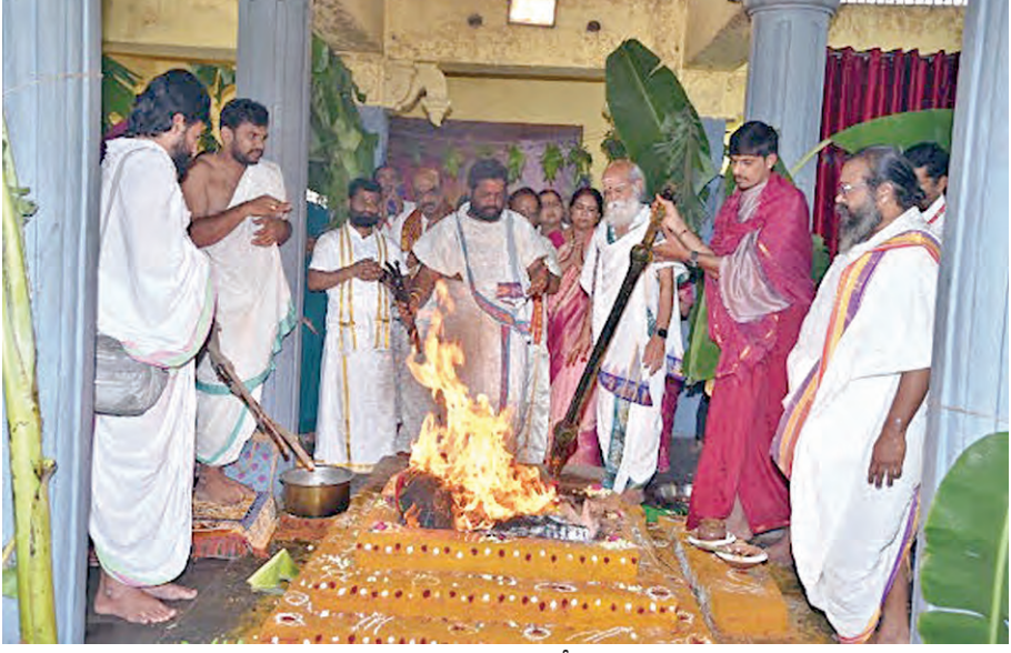
సంకష్టహర చతుర్థి వేడుకలు

ఇండ్రావతి, ఏప్రిల్ 5 ప్రభాతవార్త: దుర్గమ్మవారి భారత పార్లమెంట్లో చట్టబద్ధ కల్పించిన సందర్భంగా ఆలయంలో సంకష్టహర చతుర్థి వేడుకలు వైభవంగా ఆంధ్రప్రదేశ్ రాష్ట్ర అభివృద్ధి, అమరావతి మహాజ్యోతిషాలకు జరిపారు. ఆంధ్రుల ప్రజా రాజధాని అమరావతికి అభివృద్ధి, రాష్ట్ర ప్రజలకు అన్నింటా సర్వత్రా