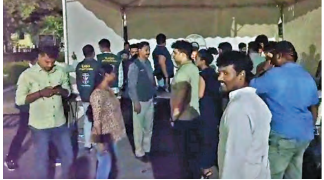
శనివారం ఆర్గెన్స్ తారామతి బారాదరిలో