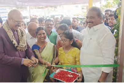
సర్వజన వైద్యశాల ఏపీతోపాటు తెలంగాణ, కర్ణాటక రాష్ట్రాల పేద ప్రజలకు ఎన్నో ఎట్టా వైద్య సేవలు అందిస్తుంది పేర్కొన్నారు. ఇలాంటి ప్రాంతంలో