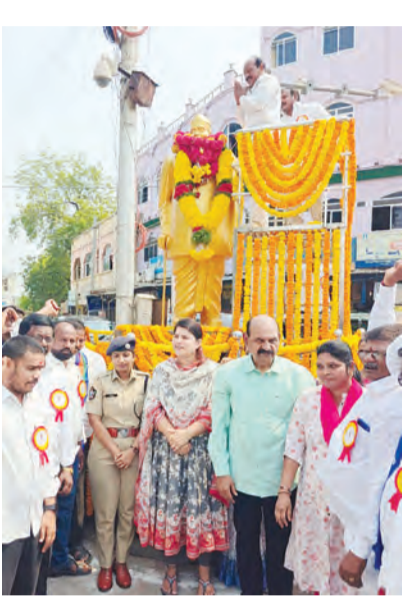
మట్టి నేతల్లో ఎన్నిరామారావు ఒకరని మట్టి కొనియాడారు.. హైరాబాద్ కు ట్యాంకులను పంపి బాబు జగ్జీవన్ రామ్ విగ్రహాన్ని ఏర్పాటు చేయించిన ఘనత ఆయనదేనని తెలిపారు. ఎస్సీ, వర్గీకరణ రిజర్వేషన్ అంశాలపై సుప్రీంకోర్టు తీర్పు నేపథ్యంలో మాట్లాడుతూ న్యాయవ్యవస్థను గౌరవించాలని బాధ్యత అందరిపైన అయితే బాధిత