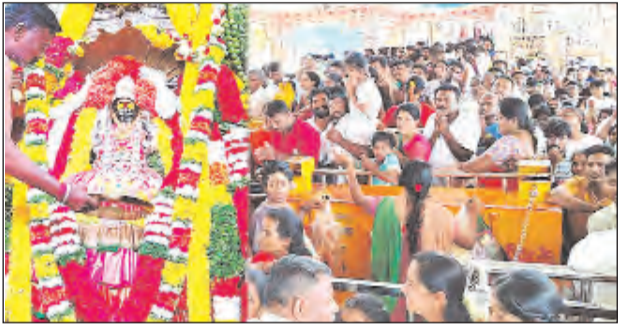
భోయకొండ, (వోడేపల్లి), ఏప్రిల్ 5 ప్రభాతవార్త

శ్రీశ్రీలతో భోయకొండ గంగమ్మ ఆలయం ఆదివారం భక్తులతో కిక్కిరిసి పోయింది. ఉదయం నుంచి సాయంత్రం వరకు అమ్మవారి కృపాచైత్రంలో యాత్రీ కుల రద్దీ కనిపించింది. కొండ దినాన్ని పురస్కరించుకొని ఆలయ అర్చకులు అమ్మవారికి ప్రత్యేకాభిషేకం, అలంకరణ నిర్వహించారు. తీవ్ర ఎండను సైతం లెక్క చేయకుండా రాష్ట్రవ్యాప్తంగా కరాటక, తమిళనాడుల నుంచి అధిక సంఖ్యలో భక్తులు తరలివచ్చారు. యాత్రీకులతో ఆలయ ప్రాంగణం గంగమ్మ నామస్మరణతో మార్మోగింది. ఆలయ జడ, ఉపకమిషన్ల ఏకాంబరం, అధికార, అర్చక సిబ్బంది భక్తులకు సేవలందించారు.