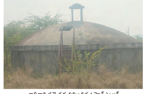
గాలివారి పల్లె వద్ద నిర్మించిన ఓహెచ్ఎంఆర్