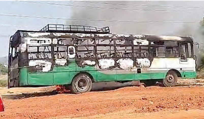
వేంపల్లె, ఏప్రిల్ 05 ప్రభాతవార్త

ఉపిల పీల్చుకున్న ప్రయాణికులు... తప్పిన ప్రమాదం.. ప్రయాణికులు సురక్షితం...రవాణా శాఖ మంత్రి..