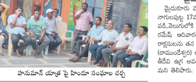
హనుమాన్ యాత్ర పై హిందూ సంఘాల చర్చ

భిప్రాయాలను పంచుకున్నారు. ఇంకా సమగ్ర ఏర్పాట్ల కోసం త్వరలోనే మరో సమావేశాన్ని నిర్వహించ వస్తున్నట్లు హిందూ సంఘాల ప్రతినిధులు వెల్లడించారు.