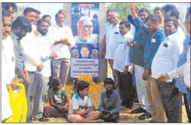
పీలేరు ఏప్రిల్ 5 ప్రభాతవార్త: