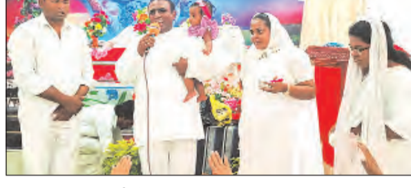
పీలేరు, ఏప్రిల్ 05 ప్రభాతవార్త: