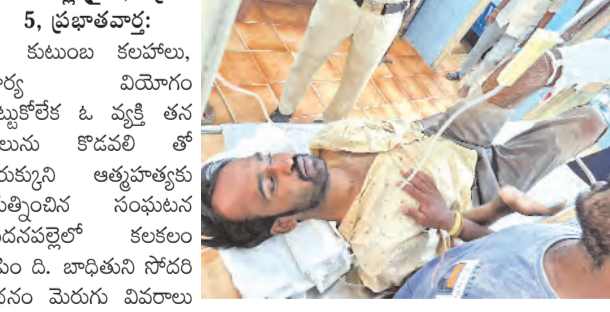
మదనపల్లె క్రైమ్, ఏప్రిల్ 5, ప్రభాతవార్త: