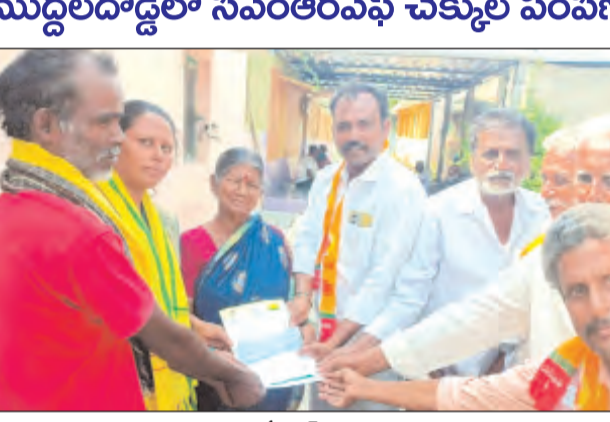
తంబళ్లపల్లె ఏప్రిల్ 5 ప్రభాతవార్త :

ముద్దలదొడ్డిలో సీఎంఆర్ఎఫ్ చెక్కుల పంపిణీ