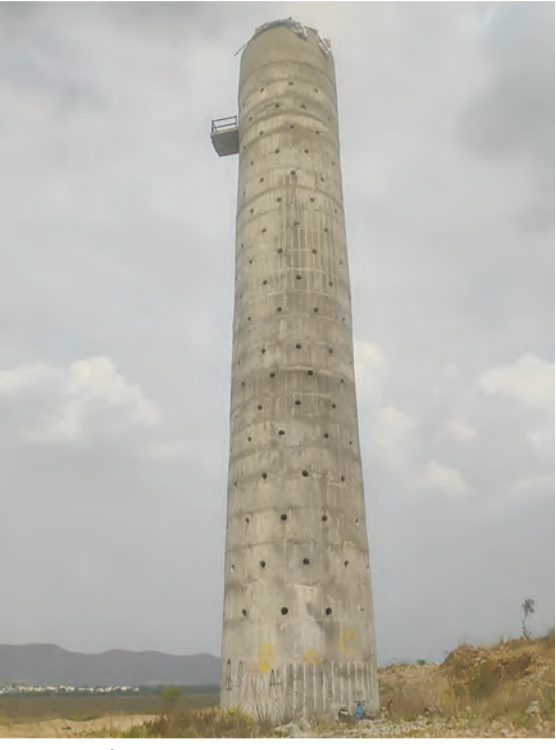
రోహాల గుట్టపై నిర్మించిన నీటి నిల్వ ట్యాంక్

పోలేదు. ఈ పనులు చేసిన సబ్ కాంట్రాక్టర్ ఇంతలోపే మరణించారు. ముఖ్య కాంట్రాక్టర్ చేతులెత్తేశారు. జగన్ సర్కార్ కూడా పథకాన్ని పూర్తి చేసేందుకు ఏ దశలోనూ ప్రయత్నించిన దాఖలాలు లేవు. అప్పటి వైసీపీ స్థానిక నేతలు కూడా ఈ పథకాన్ని పూర్తి చేయాలని ఛోరవ మామి వారే లేరు. ఫలితంగా ప్రజల దాహం తీర్చడానికి శాపంగా మారింది. దీనికి తోడు గత కాంట్రాక్టర్లు చేసిన పనుల కంటే లక్షలాది రూపాయల నిధులు ఇప్పుడు అర్జెంటైన్ ఇంజనీర్లు ఎక్కువగా బిల్లులు చేశారని సమాచారం. దీనిపై ఆర్ డబ్ల్యు శాఖ అధికారులు దిక్కు తోచక మల్లగుల్లాలు పడుతున్నారు. కాగా కూటమి ప్రభుత్వం అధికారంలోకి వచ్చిన తర్వాత ఈ పథకాన్ని పూర్తి చేయాలని ఉద్దేశంతో గత ఎడాది ప్రతిపాదనలు సిద్ధం చేసింది. వారం రోజులు క్రితం నిధులు మంజూరు చేస్తూ ఉత్తర్వులు జారీ చేసింది. పెండింగ్ పనుల పూర్తికి 1.55 కోట్ల నిధులు మంజూరు చేశారు. ఏ ఏ పనులు పెండింగ్ ఉన్నాయో పరిశీలించి సమగ్ర నివేదిక సిద్ధం చేయాలి ఉందని రాజంపేట మం