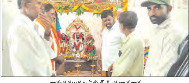
రామసముద్రం ఏప్రిల్ 5 ప్రభాతవార్త

రాష్ట్ర టిడిపి తెలుగు యువత శ్రీరామ్ చినబాబు