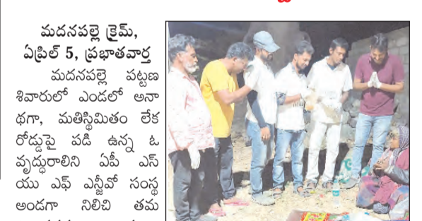
మదనపల్లె క్రైమ్, ఏప్రిల్ 5