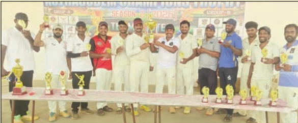
మొదటి బహుమతి అందుకున్న శంభో 11 జట్టు