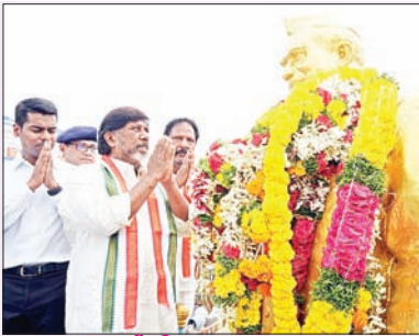
డిప్యూటీ సీఎం భట్టి విక్రమార్క