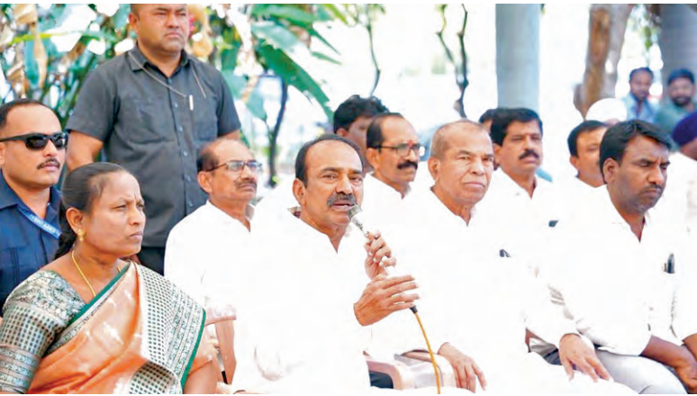
మీడియాతో మాట్లాడుతున్న ఎంపీ ఈటల రాజేందర్

విషయం వారందరిని బాధిస్తుంది. వారితో ఉన్న సంబంధాలతో కొంతమంది ప్రాజెక్టివ్ ఆనందంతో తాను పార్టీ మారబోతున్నానని, కరీంనగర్ లాంటి పట్టణంలో తనపై పోస్టెరిలు వేయించడం వారి