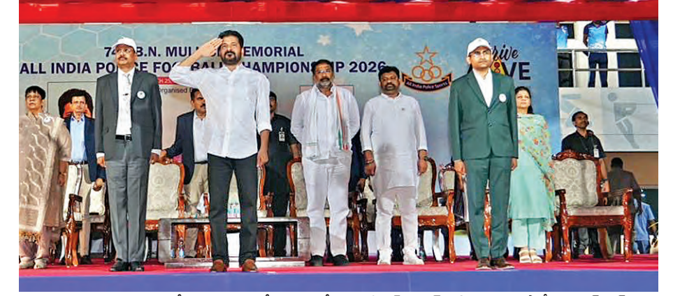
ఆదివారం గర్బుభారిలోని బాలయోగి స్టేడియంలో 74వ డివిన్ మల్లిక్ అఖిల భారత పోలీసు ఫుట్ బాల్ టోర్నీ మెంట్ ఫాంపీయన్ షిప్ ముగింపు వేడుకల్లో పాల్గొన్న ముఖ్యమంత్రి రేవంత్ రెడ్డి

హించేందుకు, జాతీయ, అంతర్జాతీయ క్రీడాకారులను తీర్చిదిద్దేందుకు పబ్లిక్ డ్రైవ్ వేల్ పార్కర్ డివిజన్ స్ట్రాక్చర్ల యూనివర్సిటీని ఏర్పాటు చేశామని సింపి తెలిపారు. ఈ యూనివర్సిటీ పాలకులుగా అంతర్జాతీయ స్థాయిలో పాల్గొని, అర్జున అవార్డులు సహా అనేక అవార్డులు సాధించిన వారిని నియమించామని అయిన తెలిపారు. విద్యుత్ పాటు క్రీడల్లో యువత రాణించాలని, క్రీడల్లో రాణించిన యువతకు ఉద్యోగానిచ్చామని పేర్కొన్నారు. తెలంగాణ స్ట్రాక్చర్ల యూనివర్సిటీ నుంచి భవిష్యత్తులో కచ్చితంగా జాతీయ, అంతర్జాతీయ క్రీడాకారులు వచ్చారని అయిన ఆశాభావం వ్యక్తం చేశారు. ప్రపంచంలో చిన్న చిన్న దేశాలు సైతం ఒలింపిక్ లో అనేక పతకాలు సాధిస్తుండగా భారత్ ఒకటి అలా పతకాల కోసం నానా పాట్లు పడుతుండడం బాధగా వుందని, దీనిని యువ క్రీడాకారులు ముఖ్యంగా పోలీసు విభాగాల్లో పున్న వారు తీర్చాలని సింపి కోరారు. దేశ వ్యాప్తంగా అన్ని రాష్ట్రాలలో పాటు పాఠా మిలటరీ బలగాలతో కూడిన 34 జట్లు పాల్గొన్న డివిన్ మల్లిక్ 74వ టోర్నీ మెంట్ ను తెలంగాణ పోలీసు విభాగం అధ్యుతంగా నిర్వహించింది సింపి కొనియాడారు. డివిన్ మల్లిక్ దేశ నిఘా విభాగాన్ని అత్యుత్తమ స్థాయికి తీసుకువెళ్లిన గొప్ప పోలీసు అధికారిగా సింపి పేర్కొన్నారు. ఆయన పేరిట ఈ టోర్నీ మెంట్ నిర్వహించడం ఎంతో మంచిని సింపి తెలిపారు. ఈ టోర్నీ మెంట్లో పాల్గొన్న క్రీడాకారులు అద్భుత ప్రదర్శన చేశారని సింపి కొనియాడారు. పోలీసు విభాగాల్లో ఉత్తమ ఫుట్ బాల్ క్రీడాకారులు పున్నట్లు తాను పాశానని ఆ యువ తెలిపారు. తెలంగాణలో ఉత్తమ ఫుట్ బాల్ క్రీడాకారులు పున్నట్లు తాను పాశానని ఆ యువ తెలిపారు. అంతర్జాతీయ బాక్సింగ్ క్రీడాకారిణి నిఖత్ జరిన్, చరల్డ్ క్రీడల్ ఫాంపీయన్ సింపి అభినందనలకు గ్రామీ వన్ కింద పోలీసు శాఖలో డివిసిలుగా ఉద్యోగం ఇచ్చామని,