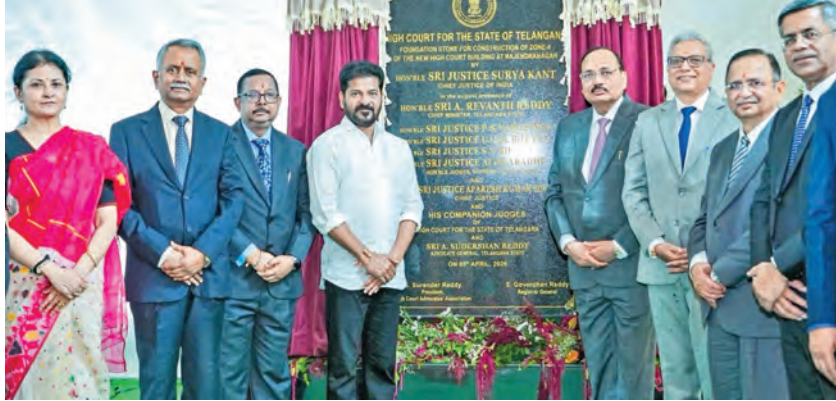
ఆదివారం హైకోర్టు జోన్-2 నిర్మాణానికి శంకుస్థాపన చేసిన సుప్రీం సీజెబి జస్టిస్ సూర్యకాంత్. బిల్డర్లతో సహా రేవంత్ రెడ్డి, హైకోర్టు సీజెబి అవరేకీ కుమార్ సింగ్ తదితరులు

ప్రభాతవార్ ప్రధాన ప్రతినిధి, హైదరాబాద్, ఏప్రిల్ 5: రాష్ట్ర రాజకీయాలలో ముఖ్యమైన సమస్యలను సూక్ష్మంగా చూడగలిగేలా ప్రజలకు సమాచారం అందించేందుకు ప్రభుత్వం ప్రయత్నించాలి. ప్రభుత్వం ప్రజలకు సమాచారం అందించేందుకు ప్రయత్నించాలి. ప్రభుత్వం ప్రజలకు సమాచారం అందించేందుకు ప్రయత్నించాలి.