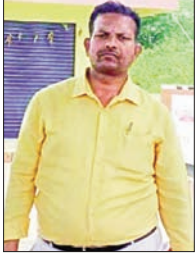
చందూరు రూరల్, ఎప్రిల్ 5, ప్రభాతవార్త: