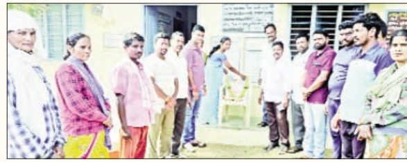
మర్రిగూడ, ఎప్రిల్ 5, ప్రభాతవార్త: