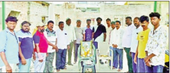
భారతదేశ స్వాతంత్ర్య సమర యోధుడు, సంఘసంగ్రహ మాజీ ప్రధాని

హుజూర్ నగర్ టౌన్, ఏప్రిల్ 5, ప్రభాత వార్త :