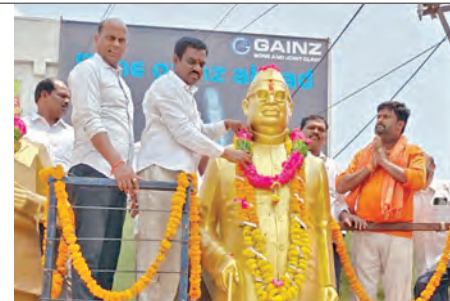
గాజులరామారం 125వ డివిజన్లో...