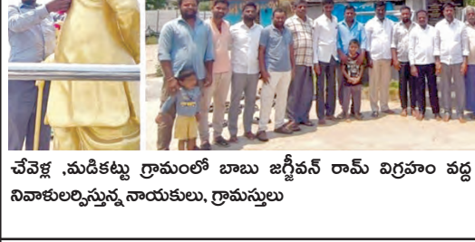
చేపేళ్ల మడికట్టు గ్రామంలో బాబు జగ్జీవన్ రామ్ విగ్రహం వద్ద నివాళులర్పిస్తున్న నాయకులు, గ్రామస్థులు