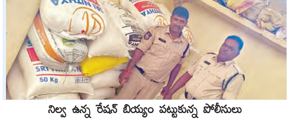
నిల్వ ఉన్న రేషన్ దియ్యం పట్టుకున్న పోలీసులు