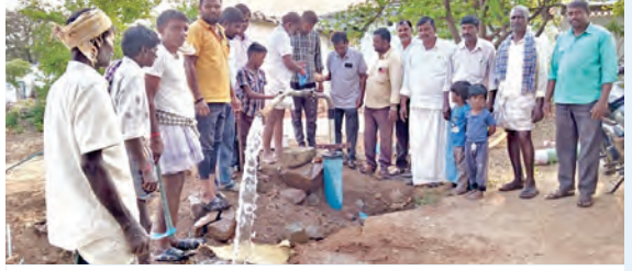
నూతన బోరు మోటార్ను ఏర్పాటు చేస్తున్న సర్పంచ్, స్టానికలు