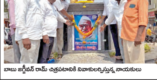
బాబు జగ్జీవన్ రామ్ చిత్రపటానికి నివాళులర్పిస్తున్న నాయకులు