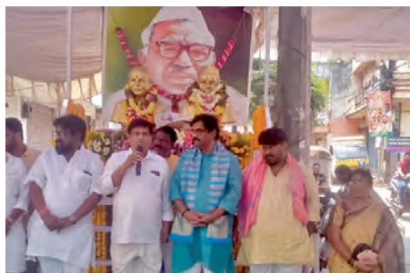
బాగ్లింగంపల్లి సాయిబాబా దేవాలయం ఎక్స్ రోడ్లో...