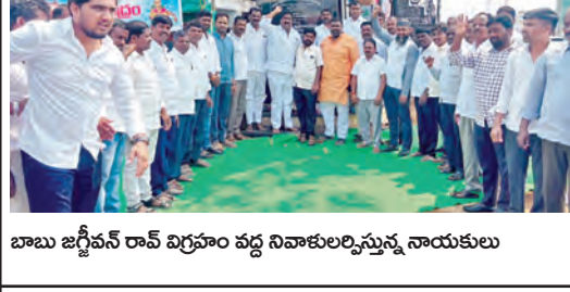
బాబు జగ్జీవన్ రామ్ విగ్రహం వద్ద నివాళులర్పిస్తున్న నాయకులు