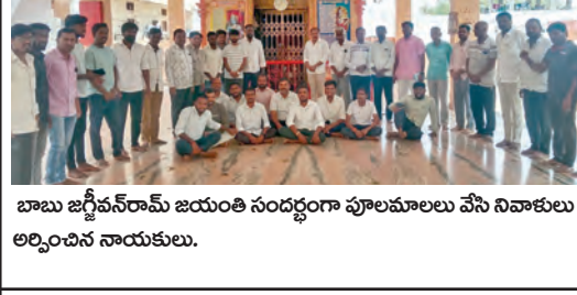
బాబు జగ్జీవన్ రామ్ జయంతి సందర్భంగా పూలమాలలు వేసి నివాళులు అర్పించిన నాయకులు.