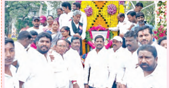
జగ్గీవనరామ్ చిత్రపటానికి పూలమాలలు వేసి నివాళు అర్పిస్తున్న