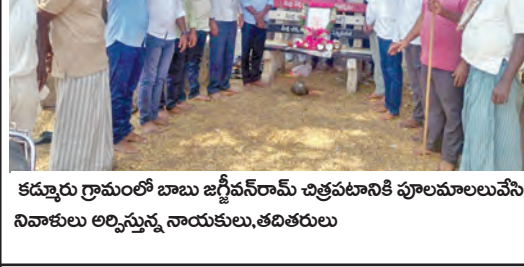
కడవూరు గ్రామంలో బాబు జగ్జీవన్ రామ్ చిత్రపటానికి పూలమాలలు వేసి నివాళులు అర్పిస్తున్న నాయకులు, తదితరులు