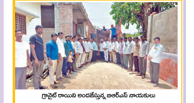
గ్రానైట్ రాయిని అందజేస్తున్న బిఆర్ఎస్ నాయకులు