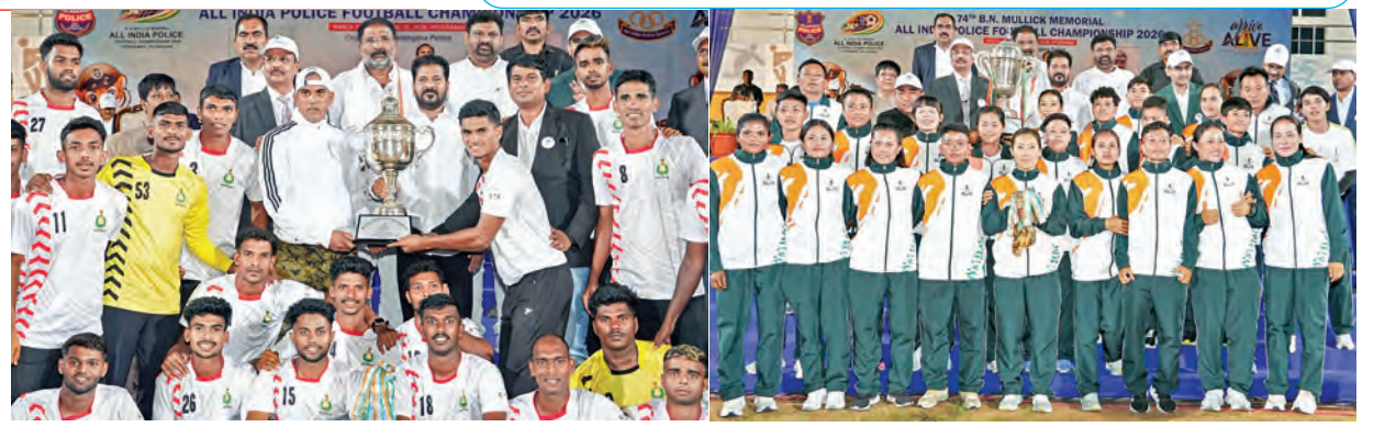
పోలీస్ ఫుట్ బాల్ విజేతలుగా సివిఎస్ఎఫ్, అసోం రైఫిల్స్

టాప్ ఓడీ మొదట బ్యాటింగ్కు దిగిన ఆర్పీఓ ఓపెనర్లు ఫిల్ సాల్స్ (30 బంతుల్లో 46), విఠాల్ కోహ్లా(18 బంతుల్లో 28) ఫ్లయింగ్ స్ట్రైక్ ఇచ్చారు. వచ్చిన వారు వచ్చినట్లే చెన్నై బౌలర్లు సిక్సలు, ఫోర్లతో విరుచుకుపడ్డారు. దేవదత్ పడిక్కల్ మరో హాఫ్ సెంచరీతో మెరిశాడు. కేవలం 29 బంతుల్లోనే 5 ఫోర్లు, 2 సిక్సలు తో పరుగుల రెండో అరు సెంచరీ సాధించాడు. ఇక కెప్టెన్ రజత్ పాటిదార్, టీమ్ డేవిడ్లైత్ చెన్నై బౌలర్లకు మక్కలు చూపాడు. ఓవర్లలో 6 ఓవర్లలో టీమ్ డేవిడ్ ఏకంగా 4 సిక్సలు, 6 ఫోర్లతో సహా 30 రన్స్ బాదాడు. వీరిద్దరూ చివరి 5 ఓవర్లలో మొదలు వేగంతో 97 రన్స్ అందించారు. రజత్ పాటిదార్ 19 బంతుల్లో 6 సిక్సలు తీసి 48 రన్స్... టీమ్ డేవిడ్ 25 బంతుల్లో 8 సిక్సలు తీసి 70 రన్స్ చేసి అజేయంగా నిలిచారు. దీంతో ఆర్పీఓ స్కోరు నిర్ణీత 20 ఓవర్లలో 3 వికెట్లు 250 పరుగులకు చేరింది. 251 రన్స్ భారీ లక్ష్యంతో దిగిన సీఎస్కేను అరంభంలోనే ఓడి, భువనేశ్వర్ దెబ్బ తీశారు. సంజా శామ్సీ(9), రుతురాజ్(7)లను ఓడి అవుట్ చేయారు.. ఆయుష్(1)ను భువనేశ్వర్, కార్తిక్ (6)ను కృణాల్ పాండ్య పెరిలియన్ చేర్చారు. సన్ రైజింగ్(25 బంతుల్లో 50), ప్రకాష్ వీర్(29 బంతుల్లో 43), జేమీ ఓవర్లలో(16 బంతుల్లో 37) రాణించారు.