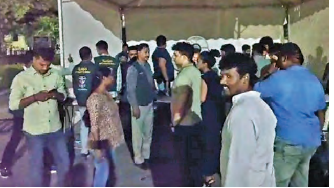
శనివారం ఆర్డర్ల తారామతి బారాదరిలో ఈగల్ పోలీసులు దాడులు నిర్వహించిన దృశ్యం