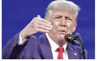
ఇరాన్లోని ప్రమాదకరమైన పర్వత ప్రాంతంలో సడరు ఫైలెట్ బిక్కుకుపోయారు. ఒకవైపు ఇరాన్ సైన్యం, స్థానిక గిరిజన తెగలు అతడి కోసం వేట సాగిస్తుండగా మరోవైపు అమెరికా సాంకేతికతతో అతడి కోల్పోవడం నిరంతరం పర్వతక్షిణించింది. కమాండర్ ఇన్ చీఫ్ నుంచి జాయింట్ చీఫ్స్ ఆఫ్ స్టాఫ్ వరకు ప్రతి ఒక్కరూ 24 గంటల పాటు ఈ ఆపరేషన్ను సజీతంగా గమనించారు. ట్రంప్ వెల్లడించారు. ఈ ఆపరేషన్ కోసం ట్రంప్ డజన్ల కొద్దీ యుద్ధ విమానాలను రంగంలోకి దింపారు. శత్రువుల నుంచి ఎలాంటి అటంకం కలగకుండా ఉండేందుకు.. ఫైలెట్ సురక్షితంగా బయటపడే వరకు ఈ విషయాన్ని అత్యంత రహస్యంగా ఉంచారు. శత్రు భూభాగాలలోకి చొచ్చుకొని ఒక ఎయిర్ మెన్ ను ప్రాణాలతో వెలికి తీసుకురావడం అమెరికా చరిత్రలో ఇదే మొదటిసారి అని ట్రంప్ గర్వంగా ప్రకటించారు. ఏ అమెరికన్ యొద్దూని మేము ఎప్పుడీ ఒంటరిగా వదిలిపెట్టం. మన సైనికులకు ఇచ్చే హామీ ఇదే అని స్పష్టం చేశారు. ప్రస్తుతం సడరు ఫైలెట్ అమెరికా బలగా ఆసిన్లో సురక్షితంగా ఉన్నారని అతడి ఆరోగ్యపరిస్థితి నిలకడగా ఉందని వెల్లడోస్తూ వర్షాలు తెలిపాయి.

వాషింగ్టన్, ఏప్రిల్ 5: ఇరాన్లో జరుగుతున్న భీకర యుద్ధంలో ఆమెరికా రక్షణ దళాలు అద్భుత విజయాన్ని సమూహం చేశాయి. గత శుక్రవారం ఇరాన్ కూల్చివేసి ఎఫ్ 15ని డ్రైక్ ఈగల్ యుద్ధ విమానానికి సంబంధించి గల్లంతైన రెండో ఫైలెట్ను అమెరికా సైన్యం రక్షించింది. ఈ విషయాన్ని స్వయంగా ఆదేశ అధ్యక్షుడు డొనాల్డ్ ట్రంప్ ధృవీకరించారు. ఇది అమెరికా చరిత్రలోనే అత్యంత సాహసోపేతమైన రెస్క్యూ ఆపరేషన్ అని అభివృద్ధించారు. విమానం కూలిపోయిన తర్వాత ఒక ఫైలెట్ వెంబడి దోచకగా రెండో ఫైలెట్ అవకాశం కోసం గత రెండు రోజులుగా తీవ్ర అత్యంత నెలకొంది. ఇరాన్లోని ప్రమాదకరమైన పర్వత ప్రాంతంలో సడరు ఫైలెట్ బిక్కుకుపోయారు. ఒకవైపు ఇరాన్ సైన్యం, స్థానిక గిరిజన తెగలు అతడి కోసం వేట సాగిస్తుండగా మరోవైపు అమెరికా సాంకేతికతతో అతడి కోల్పోవడం నిరంతరం పర్వతక్షిణించింది. కమాండర్ ఇన్ చీఫ్ నుంచి జాయింట్ చీఫ్స్ ఆఫ్ స్టాఫ్ వరకు ప్రతి ఒక్కరూ 24 గంటల పాటు ఈ ఆపరేషన్ను సజీతంగా గమనించారు. ట్రంప్ వెల్లడించారు. ఈ ఆపరేషన్ కోసం ట్రంప్ డజన్ల కొద్దీ యుద్ధ విమానాలను రంగంలోకి దింపారు. శత్రువుల నుంచి ఎలాంటి అటంకం కలగకుండా ఉండేందుకు.. ఫైలెట్ సురక్షితంగా బయటపడే వరకు ఈ విషయాన్ని అత్యంత రహస్యంగా ఉంచారు. శత్రు భూభాగాలలోకి చొచ్చుకొని ఒక ఎయిర్ మెన్ ను ప్రాణాలతో వెలికి తీసుకురావడం అమెరికా చరిత్రలో ఇదే మొదటిసారి అని ట్రంప్ గర్వంగా ప్రకటించారు. ఏ అమెరికన్ యొద్దూని మేము ఎప్పుడీ ఒంటరిగా వదిలిపెట్టం. మన సైనికులకు ఇచ్చే హామీ ఇదే అని స్పష్టం చేశారు. ప్రస్తుతం సడరు ఫైలెట్ అమెరికా బలగా ఆసిన్లో సురక్షితంగా ఉన్నారని అతడి ఆరోగ్యపరిస్థితి నిలకడగా ఉందని వెల్లడోస్తూ వర్షాలు తెలిపాయి.