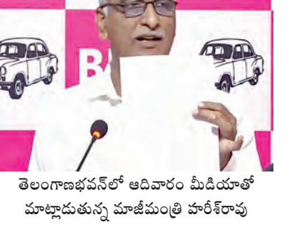
తెలంగాణభవన్ లో ఆదివారం మీడియాతో మాట్లాడుతున్న మాజీమంత్రి హరీశ్ రావు