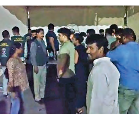
శనివారం అర్ధరాత్రి తారామతి బారాదరిలో ఈగల్ పోలీసులు దాడులు నిర్వహించిన దృశ్యం

సెంటర్లలో వారంతారాల్లో జరిగే పార్టీలపై ఈగల్ పోలీసులు స్థానిక పోలీసులతో కలిసి మరోసారి దాడులు చేపట్టారు. ఇందులో భాగంగా శనివారం రాత్రి గండి పేట మార్కెట్ గల తారామతి బారాదరిలో కొందరు 'మోర్ దేన్ ఫ్రెండ్స్' పేరిట నిర్వహించిన పార్టీపై ఈగల్ పోలీసులు గోల్డోండ్, నార్కొటిక్ పోలీసులతో కలిసి దాడులు నిర్వహించారు. ఈ పార్టీలో కొందరు యువకులు డ్రగ్స్ తీసుకున్నట్లు పక్కా సమాచారం అందడంతో చిత్తూరు మండలం సేవించడంతోపాటు అనుమానాస్పదంగా ఉన్న 64 మందిని అదుపులోకి తీసుకుని మూతపరీక్షలు నిర్వహించారు. వీరిలో ఐదుగురు గంజాయి సేవించగా ఒకడు ఎపిఎం అనే సింథటిక్ డ్రగ్స్ తీసుకున్నట్లు నిర్ధారణ అయ్యింది. ఈ అదుపుల యువకులు తాము డ్రగ్స్ కు అలాపాటు ఉన్నారని ఈగల్ పోలీసులు ముందు అంగీకరించారు. దీనికి సంబంధించి నార్కొటిక్ పోలీసులు తారామతి