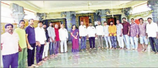
తరిగొప్పుల, ఏప్రిల్ 5 ప్రభాతవార్త :