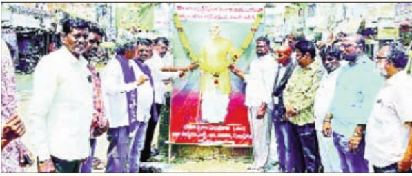
నర్సంపేట, ఏప్రిల్ 5, ప్రభాతవార్త