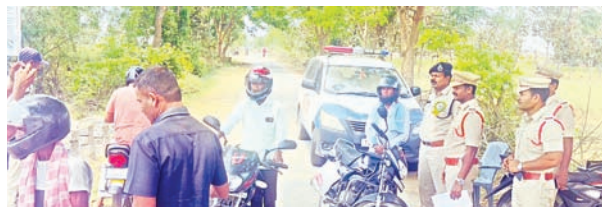
హెల్మెట్ ధరించి ప్రయాణం చేసే ద్వీచక్ర వాహనదారుల ప్రయాణం