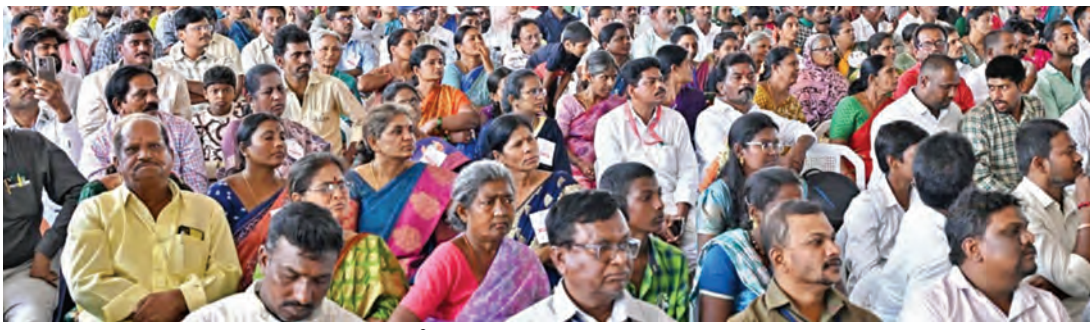
సోమవారం యాడికి సీఎం చంద్రబాబు సభకు హాజరైన రైతులు, అభిమానులు

మాట్లాడుతున్నాడని వైసిపి అధినేత వైఎస్.జగన్ మోహన్ రెడ్డిపై సీఎం తీవ్రస్థాయిలో విరుచుకుపడ్డారు. అధికారులు జాగ్రత్తగా పని చేసి ప్రజలకు సేవలు అందించాలని నేను 2014 సిబిఎన్ కాదు 1995 సిబిఎన్ అనేది గుర్తించుకోవాలని, రాజ్ కేంద్రం రోజుల్లో ఆగస్టుక తనిఖీలకు జిల్లాలకు వస్తానని, బాధ్యతాయుతంగా ప్రజలకు సేవలు అందించి మంచిపనులు తెచ్చుకోవాలని సీఎం చంద్రబాబు వెల్లడించారు. అనంతపురంజిల్లా యాడికి జలధార నీటి >>2