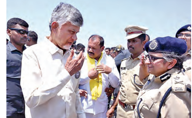
జిల్లా పర్యటనకు వచ్చిన సీఎంకె స్వాగతం పలుకుతున్న అధికారులు