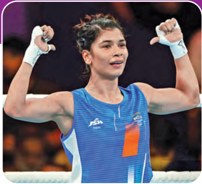
కాంస్యంతో సరిపెట్టిన నిఖత్ జలీల్

ఉల్హాస్ బాబర్: మంగోలియాలోని ఉల్హాస్ బాబర్లో జరుగుతున్న 2026 ఆసియా బాక్సింగ్ ఛాంపియన్ షిప్ లో భారత బాక్సర్లు జోరుమాపుతున్నారు. ప్రీతి పవార్ తో పాటు పలువురు పైనల్ చేరారు. సెమీనల్ చేరుకోవడం ద్వారా మహిళల 51 కేటగిరీ విభాగంలో మెడల్ ఖాయం చేసుకున్న హైదరాబాద్ బాక్సర్, మాజీ ప్రపంచ ఛాంపియన్ నిఖత్ జలీల్.. పైనల్ చేరడంలో విఫలమైంది. సెమీనల్ చైనాకు చెందిన పారీన్ ఓలింపిక్ ఛాంపియన్ పు యు చేతిలో పరాజయం ఎదురైంది. అరంభంలో చక్కగా డిఫెండ్ చేసిన నిఖత్ జలీల్.. చైనా బాక్సర్ దాడికి ఎదురునిలవలేకపోయింది. ఓలింపిక్ మెడల్స్ లభించిన బోకోచాన్.. మహిళల 75కిలో విభాగంలో