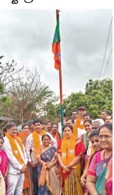
ఎటువంటి లాభాపేక్ష లేకుండా పార్టీకి అంకిత భావంతో పనిచేసిన కార్యకర్తలను, మహానీయులను స్మరించుకుంటూ తిరిగి బిజెపి సేవకు అంకితమవుతున్నారని సంకల్పించాలని రోజు