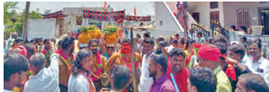
బీరప్పస్వామివారి జీవిత చరిత్రను కళారూపాలు (ఒక్కకథల) ద్వారా తెలియజేస్తూ, భాషా భజనం, దోలు వాయిద్యాల మధ్య స్వామివారి కళ్యాణం చూడమన్నట్లుగా నిర్వహించారు. చుట్టూ ప్రక్కల గ్రామాలవారు పెద్ద సంఖ్యలో పాల్గొని స్వామివారికి ప్రత్యేక పూజలు చేసి మ్రొక్కులు తీర్చుకున్నారు. దీంతో గ్రామం అంతా శ్రీ బీరప్ప స్వామివారి నామ స్మరణతో మార్చింది.

పూడూరు, ఏప్రిల్ 6, ప్రభాతవార్త : పూడూరు మండలం పరిధిలోని బాధ్యులపల్లి గ్రామ శివారులో వెలసిన శ్రీ బీరప్ప స్వామి దేవాలయంలో నిర్వహిస్తున్న ఉత్సవాలలో సోమవారం శ్రీ బీరప్పస్వామి కళ్యాణం కనుల పండువగా జరిగింది. రెండు రోజుల పాటు జరుగుతున్న బీరప్ప దేవాలయ ఉత్సవాల సందర్భంగా వివరాల బీరప్పస్వామివారికి గ్రామంలోని మహిళలు మధ్యాహ్నం వల రకాల పిండివంటలు తయారుచేసి నైవేద్యం సమర్పించేందుకు ఒక్క కళాకారులు (బిడ్డవారు)దేవులు వాయిద్యాల మధ్య వీధివీధిలో కలియ తిరుగుతూ భోజనాలతో గ్రామం నుండి దేవాలయం వరకు భారాలు తీశారు. ఈ సందర్భంగా జరిగిన కార్యక్రమంలో పోతురాజులు విన్నపాలు, శివ సత్తుల పూసకాలు భక్తులను ఆలరించడం. అనంతరం ఒక్క కళాకారులు (బిడ్డవారు) శ్రీ