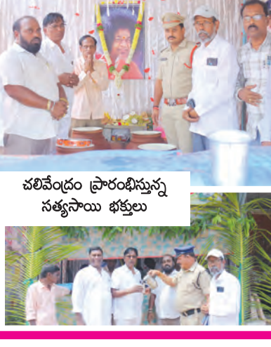
చలివేల్డం ప్రారంభిస్తున్న సత్యసాయి భక్తులు

32 ఏళ్ల అత్యంత సేవ ఒక్క ఏడాది కాదు.. రెండు ఏళ్లు కాదు.. ఏకంగా 32 ఏళ్లుగా ప్రతి వేసవిలోనూ ఒక్క చలివేల్డాన్ని నిర్వహిస్తూ ప్రజలకు సేవా సమితి భక్తులు తమ నిస్వార్థ భక్తిని చాటుకుంటున్నారు. స్థానిక బస్టాండ్ ఆవరణలో నిత్యం రాకపోకలు సాగించే వేలాది మంది ప్రయాణికులకు ఈ కేంద్రం ఒక వరంలా మారింది. ఫిల్టర్ వాటర్ కోసుగేలు చేసి, మట్టి కుండల్లో చల్లబరిచి స్వచ్ఛమైన నీటిని అందిస్తున్నారు. బస్సు దిగలేని స్థితిలో ఉండే డ్రైవర్లు, కండక్టర్ల వద్దకు భక్తులే స్వయంగా వెళ్లి మంచినీరు అందించడం వారి సేవా నిరతికి నిదర్శనం.