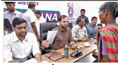
ఫిర్యాదులు స్వీకరిస్తున్న కలెక్టర్