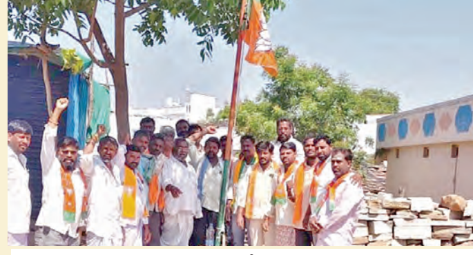
జెండా అవిష్కరణ కార్యక్రమంలో పాల్గొన్న బజెపి నాయకులు