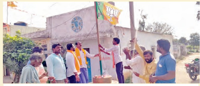
పాపనాశనం గ్రామంలో జరిపిన జెండా అవిష్కరణను నేతలు