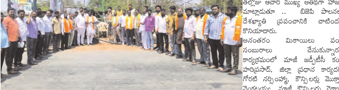
అమనగల్లులో పార్టీ జెండాను అవిష్కరిస్తున్న తల్లూ ఆచారి

అమనగల్లు, ఏప్రిల్ 6, ప్రభాతవార్త: అమనగల్లు మండల కేంద్రంలో శనివారం బజెపి ఆవిర్భావ దినోత్సవం నిర్వహించారు. పార్టీ బూత్ కమిటీ అధ్యక్షులు, నాయకులు, కార్యకర్తలు, అభిమానులు పెద్ద