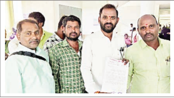
బచ్చన్నపేట, ఏప్రిల్ 6 ప్రభాతవార్త :