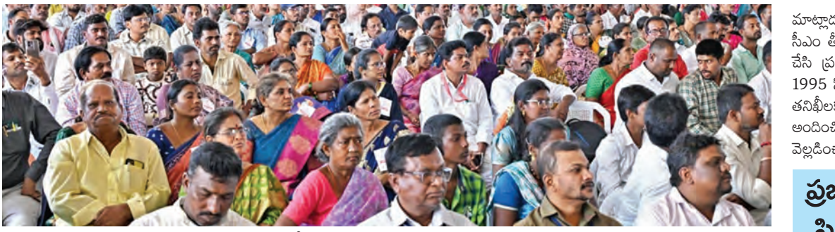
సోమవారం యాడికి సీఎం చంద్రబాబు సభకు హాజరైన రైతులు, అభిమానులు

మాట్లాడుతున్నాడని వైసిపి అధినేత వై.ఎస్.జగన్ మోహన్ రెడ్డిపై సీఎం తీవ్రస్థాయిలో విరుచుకుపడ్డారు. అధికారులు జాగ్రత్తగా పని చేసి ప్రజలకు సేవలు అందించాలని నేను 2014 సీబిఎన్ కాదు 1995 సీబిఎన్ అనేది గుర్తించుకోవాలని, రాజీవ్ రోజుల్లో ఆగస్టుక తనిఖీలకు జిల్లాలకు వస్తానని, బాధ్యతాయుతంగా ప్రజలకు సేవలు అందించి మంచిపనులు తెచ్చుకోవాలని సీఎం చంద్రబాబు వెల్లడించారు. అనంతపురంజిల్లా యాడికి జలధార నీటి >>2